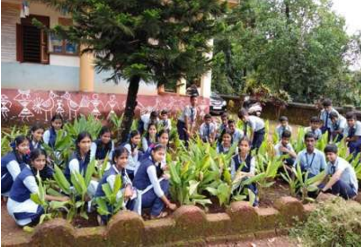
हळदीच्या पिकात काम करताना विद्यार्थी

सुरुवात केली. शालेय परीसरात पाण्याचा निचरा होणारी काही प्रमाणात पडीक जमीन त्यासाठी निवडली. अशा या कमी जागेत हळदीचे उत्पन्न घेता येते ही संकल्पना विद्यार्थ्यांमार्फत सर्व पालकांपर्यंत पोहोचावी म्हणून हा प्रकल्प प्रशालेने हाती घेतला आहे. या प्रकल्पासाठी खर्च १२८० रु इतका आला. २६५४ रु चे उत्पादन झाले. यातून १३७४ रु नफा मिळाला.