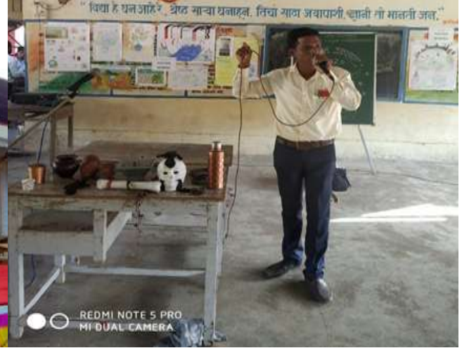
अंधश्रद्धा निर्मूलन कार्यक्रम

शाळा एकसंघ :- शाळा ही एक संघच आहे. शाळेतील विद्यार्थ्यांची प्रगती साधण्यासाठी शाळेतील सर्व घटकांचे सांघिक प्रयत्न उपयोगी ठरतात. सांघिक कार्य केवळ शाळेच्या सुयोग्य कार्यप्रणालीत कामकाजात मदत करत नाही तर प्रत्येक सदस्याची क्षमता व कौशल्य देखील विकसित करते. शिक्षकांनी प्रभावीपणे शिकविण्या करिता पुरेसा शिक्षक वर्ग आणि संसाधने यांची सुनिश्चिती करणे, विद्यार्थ्यांना घडविणारे म्हणून विकसित होत जाणारी शालेय संस्कृती तयार करणे, संघ तयार करणे, सर्व विद्यार्थ्यांना यशस्वी होण्यासाठी प्रयत्न करणे, अध्यापनाची पद्धती अधिक चांगली करण्यास वर्गात अध्यापन करतांना नवनवे प्रयोग करण्यास प्रोत्साहित करणे, त्यामुळे विद्यार्थ्यांच्या निकालात सुधारणा होण्यास मदत झाली. विद्यार्थ्यांचे अध्ययन हे आनंददायी झाले पाहिजे मुलांना त्यांची जास्तीत जास्त क्षमता मिळवून देण्यासाठी त्यांच्यात चिकित्सक विचार करण्याचे कौशल्य व चौकस वृत्ती वाढीसाठी आवश्यक ते प्रयत्न करण्यास प्रोत्साहन दिले. स्वयंअध्ययन, निरीक्षण, मत प्रदर्शित करणे, गट सादरीकरण करणे, प्रकल्प राबवणे अशा विविध उपाययोजनाद्वारे सक्रीय सहभाग विद्यार्थ्यांचा घेतल्याने अध्ययनाची त्यांच्यात आवड निर्माण झाली.