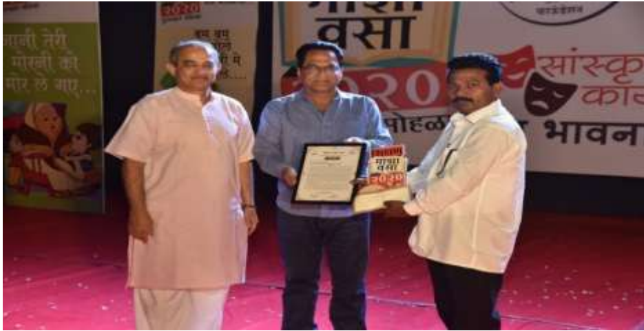
'शिक्षण माझा वसा' राज्यस्तरीय उपक्रमशील मुख्याध्यापक पुरस्कार

उपक्रमशील शिक्षक :- नाविन्य पूर्ण उपक्रम, शैक्षणिक उठाव, पटनोंदणी, दर्जेदार अध्यापन पद्धती, समाज सहभाग अशा कार्यासाठी उपक्रमशील शिक्षक आवश्यक असतात. त्यांना शिक्षण विवेक पुणे व टी. बी.लुल्ला चॅरिटेबल फाउंडेशन यांच्या संयुक्त विद्यमाने 2020 चा 'शिक्षण माझा वसा' राज्यस्तरीय उपक्रमशील मुख्याध्यापक हा पुरस्कार प्राप्त झाला आहे. त्यांना मानपत्र, सन्मानचिन्ह, 6500/- रु चेक देऊन गौरविण्यात आले होते. शिक्षण विवेक पुणे आयोजित ' शिक्षण माझा वसा ' कार्यक्रमांतर्गत उपक्रमशील मुख्याध्यापक म्हणून मुलाखत घेण्यात आली. लिंक- https://youtube.be/olThGmx4DVE