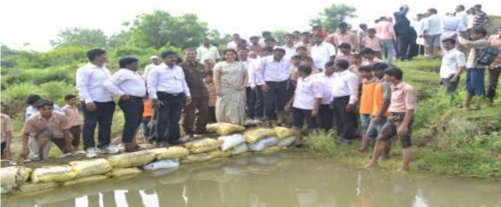
विद्यालयाने तयार केलेला वनराई बंधारा

सामाजिक सहभाग:- शाळा हा समाजाचा आरसा असतो असे म्हटले जाते आणि ते सत्यही आहे. यादृष्टीने समाजाचा शाळेशी संपर्क असणे अत्यंत आवश्यक आहे. आणि या बाबीचा विचार करूनच शासन स्तरावरून शिक्षक पालक संघ, शाळा व्यवस्थापन समिती यांची निर्मिती करण्याची तरतूद करण्यात आलेली आहे. शिक्षक पालक संघाच्या नियमित बैठका शालेय स्तरावरून घेण्यात येतात. यात शालेय गुणवत्ता विकासाच्या दृष्टीने विचार विनिमय होऊन त्याची प्रभावी अमलबजावणी राबविली जाते. शाळा ज्या सामाजिक परिसरात आहे त्या परिसरातील गरजा ओळखून शाळेने त्यावर काम करणे गरजेचे आहे. या उदात्त हेतूने विद्यालयाने विविध सामाजिक उपक्रम राबविलेले आहेत. यामध्ये आरोग्य तपासणी, विविध व्याख्यानमाला, मुख्याध्यापकांच्या संकल्पनेतून पाण्याची गरज ओळखून परिसरात विद्यालयाने वनराई बंधारांच्याची निर्मिती केलेली आहे. विद्यालयाने तयार केलेल्या वनराई बंधार्यामुळे परिसरातील जलपातळीत चांगलीच वाढ झाली आहे.