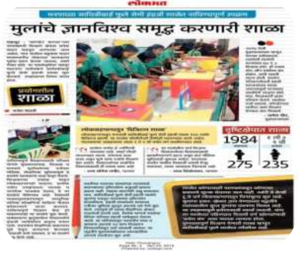
शाळेच्या प्रगतीची वृत्तपत्रांनी घेतलेली दखल

शाळेमध्ये राबविले जाणारे विविध उपक्रम:- शाळेच्या विकासात शालेय उपक्रमांचा सिंहाचा वाट असतो. हे लक्षात घेऊन शाळेत नवनवीन उपक्रम राबविण्यात येतात. ज्यात नवागतांचे स्वागत, आदर्श परिपाठ, दिनांकानुसार पाढा, कथाकथन, एक विषय देऊन त्यावर आपले मत व्यक्त करणे, सामान्य ज्ञानावर आधारीत प्रश्न, विविध स्पर्धा, स्नेहसंमेलन, शिक्षक पालक मेळावा, स्वच्छ शाळा सुंदर शाळा, क्षेत्रभेटी, मकर संक्रात निमित्त हळदीकुंकू, महिला मेळावा, बालसभा, बाल आनंद मेळावा, विज्ञान मेळावा, मीना राजू मंच, स्काऊट गाईड, मुल्यधिष्ठीत शिक्षण, शिष्यवृत्ती व नवोदय परिक्षा, NMMS परिक्षा, नवरत्न स्पर्धा, क्रीडा स्पर्धा, सांस्कृतिक स्पर्धा, बाल संस्कार शिबीर, इत्यादी सारखे विविध उपक्रम शाळेत राबविले जातात. 14 फेब्रुवारी मातृ-पितृपूजन या उपक्रमाद्वारे मुलगा आपल्या आई-वडिलांशी कसा जवळीक साधतो त्यांच्याविषयी त्यांच्या मनात काय भावना निर्माण होतात. आईवडिलांची पुजा करून त्यांना प्रणाम करून एक नवचैतन्य निर्माण होतो मुल संस्कारी बनलीत. मातीपासुन गणपती, बैल, मातीची भांडी, दिवे तयार करणे हा एक नाविण्यपूर्ण उपक्रम आहे. जेणेकरून विद्यार्थी माती घेऊन मातीपासुन अशा विविध वस्तू तयार करतात. या सर्व उपक्रमांचा फायदा विद्यार्थ्यांना भविष्यात उपयोगी ठरू शकतो.