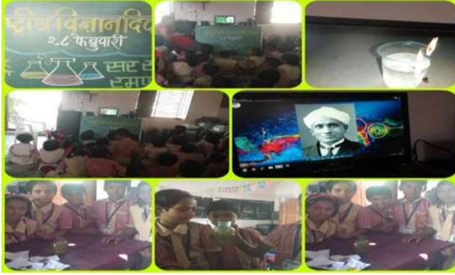
विद्यार्थी प्राप्त ज्ञानाच्या आधारे प्रयोग करताना

शाळेच्या विकासात शाळेच्या व्यवस्थापन समिती तसेच पालकांचा सहभाग :- आमच्या शाळेतील विद्यार्थ्यांचे पालक हे सर्व मजुरी करणारे असल्यामुळे त्यांची आर्थिक परिस्थिती बेताचीच आहे. ते जरी शाळेसाठी आर्थिक मदत देऊ शकत नसले तरी आपल्या परीने श्रमदानात सक्रीय सहभाग देत असतात. पालकांच्या सहकार्यातून शालेय कंपाउंड रंगकाम, तसेच परसबाग निर्मिती व शाळेच्या भौतिक सुविधेत सुधारणा करण्यात मोलाचा वाटा असतो. कोरोना कालावधीत शाळा बंद असताना पालक शाळेत येऊन शाळेच्या परिसराची स्वच्छता स्वतःहून ठेवत होते.