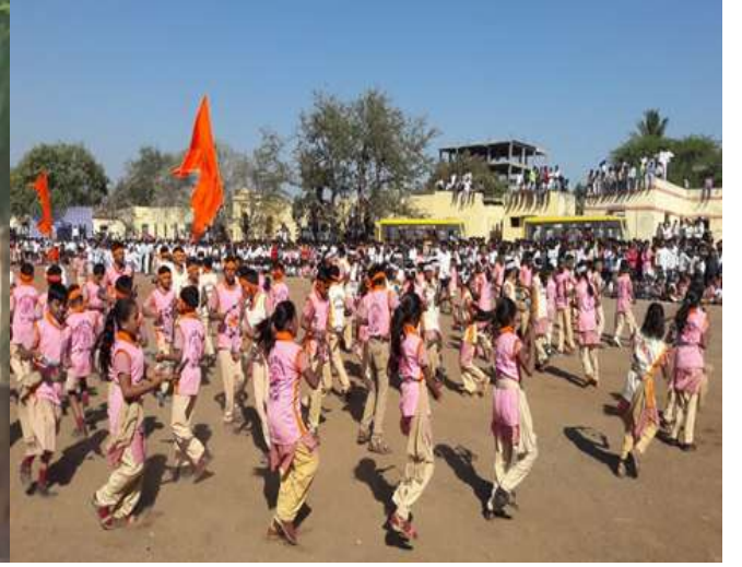
सांस्कृतिक कार्यक्रमात सहभागी विद्यार्थी