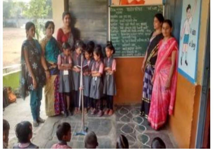
परिपाठत सहभागी विद्यार्थी

महिन्यातील 1 ते 31 या दिनांकानुसार दररोज पाढे म्हणत असल्यामुळे अनेक मुलांना पंचवीस ते तीस दरम्यानची पाढे पाठ झाली. त्यांचा गणित क्रीयेमध्ये वापर होतो व विद्यार्थ्यांचा कल गणिताकडे जास्त झुकल्यासारखा दिसून येतो. दररोज दहा नवीन शब्दांची स्पेलिंग पाठ करून सांगणे या उपक्रमामुळे मुलांचे शब्द ज्ञान व शब्दसंग्रह वाढीस लागले. मुलांना चित्रकला स्पर्धेमध्ये चित्र रेखाटण्याची रंग देण्याची माहिती मिळाली विद्यार्थ्यांमध्ये सुबकता व रंगसंगती दिसून आली. विद्यार्थ्यांकडून दररोज पंधरा ते वीस ओळी शुद्धलेखन इंग्रजी व मराठी भाषेत लिहून घेण्यात येते त्यामुळे विद्यार्थ्यांची स्पर्धा घेऊन बक्षीस देण्यात येते. स्पर्धा परीक्षा करिता सामान्यज्ञान व गणित क्रियेवर आधारित प्रश्नमंजुषा चे आयोजन करण्यात येते व विद्यार्थ्यांच्या गुणवत्तेवर विशेष लक्ष देण्यात येत आहे. शाळेत वर्गवार क्रीडा स्पर्धा आयोजित करण्यात येते व विद्यार्थ्यांच्या शारीरिक विकासासाठी विशेष लक्ष देण्यात येते.