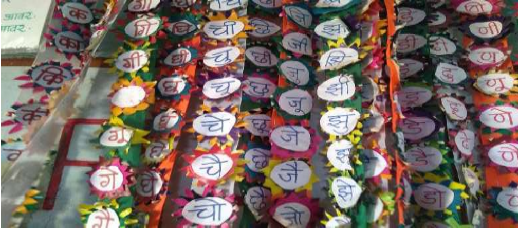
विद्यार्थ्यांच्या मदतीने बनविलेले शैक्षणिक साहित्य

शिक्षक सहभाग :- मी एक शिक्षक आहे, शिक्षण हा माझा स्वधर्म आहे, विद्यार्थी हे माझे दैवत आहेत. ह्या उक्तीनुसार येथील शिक्षकांचे वर्तन आहे. या शाळेतील शिक्षक उच्चशिक्षित तसेच टेकरोसेव्ही असून शाळेची गुणवत्ता वाढवण्यावर भर देत आहेत. विविध अध्यापनाची तंत्रे व कौशल्यांद्वारा मुलांना शिक्षणाच्या प्रवाहात आणत आहेत. शाळा आणि शाळेचा परिसर अंतर्बाह्य स्वच्छ होण्यासाठी प्लॅस्टिकमुक्ती, कचरामुक्ती, शिवीमुक्ती अभियान सुरू केले आहे. बंद पडणारी ही महानगर पालिकेची शाळा पुनरुज्जीवित होण्याचे श्रेय शिक्षक आणि मुख्याध्यापकांना जाते. मुलांमध्ये प्रामाणिकपणा हे मूल्य रुजविण्यासाठी प्रामाणिक रिश्काचालकाला शाळेत बोलवून त्याच्या मुलाखतीचा कार्यक्रम आयोजित केला होता. या रिश्काचालकाने 50000 रु. असलेली बॅग त्या मालकाला परत केली होती. असे विविध संस्कारात्मक अनुभूती मुलांना नकळत देण्याचे काम या शाळेतील शिक्षक करीत आहेत. मुलांना कौशल्यधिष्ठित शिक्षण मिळावे यासाठी पंजाबराव कृषी विद्यापीठ अंतर्गत आयोजित कृषी व तंत्रज्ञान प्रदर्शनाला आवर्जून मुलांना नेले जाते. जेणेकरून त्यांच्यातील कौशल्य विकसित व्हावे.