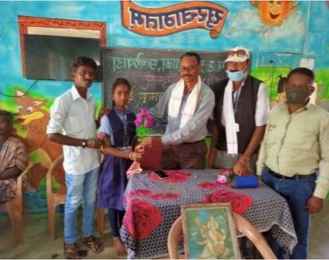
विद्यार्थीनीचा सत्कार करताना मुख्यध्यापक

महाराष्ट्र राज्य प्राथमिक शिक्षण परिषद, पुणे यांनी घेतलेल्या लाकडाऊनच्या काळात बालदिन स्पर्धा व महिला दिन स्पर्धा आयोजित केली होती, त्यास्पर्धे मध्ये सुधदा मुलामुलींनी सहभाग घेतला आहे. राज्यस्तरीय वेबिनार, सायबर सुरक्षा, यामध्ये सहभाग घेतला व आनापान प्रशिक्षण मध्ये सुधदा शाळेतून मुला-मुलींनी सहभाग नोंदविला.