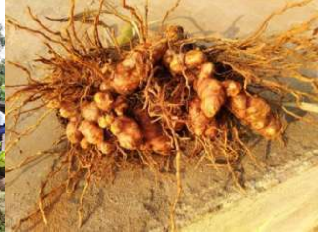
तयार झालेली हळद

कुक्कुटपालन प्रकल्प :- ग्रामीण भागातील नुलांच्या आहारात पुरेसे प्रोटीन्स यावेत, शाळेतील मुलांना अभ्यासाबरोबर शेती पूरक उद्योगाची आवड निर्माण व्हावी आणि घरा पाठीमागील परिसराकडे पाहण्याचा त्यांचा दृष्टीकोन बदलावा या उद्देशाने प्रशालेने कुक्कुटपालन प्रकल्प हाती घेतला आहे. प्रशालेने शाळेतील मुले आणि गावातील महिलांचा दृष्टीकोन बदलण्याच्या प्रयोगावर विचार सुरु केला आणि त्यातून परसबागेतील लक्ष्मी म्हणजेच कुक्कुटपालन या अनोख्या प्रकल्पाची आखणी झाली. प्रशालेने शाळेतील मुले आणि गावातील महिलांचा दृष्टीकोन बदलण्याच्या प्रयोगावर विचार सुरु केला आणि त्यातून परसबागेतील लक्ष्मी म्हणजेच कुक्कुटपालन या अनोख्या प्रकल्पाची आखणी झाली. या प्रयोगामध्ये प्रशालेतील विद्यार्थ्यांना व गावातील बचतगटातील महिलांना कुक्कुटपालनाचे प्रशिक्षण देऊन कावेरी जातीची एक महिन्याची पाच कोंबडीची पिल्ले आणि पाच किलो खाद्य दिले. प्रत्येक विद्यार्थ्यांनी ती पिल्ले घरी नेऊन शास्त्रोक्त पद्धतीने वाढविली. त्यातून मिळणारी अंडी बाजारपेठेत विक्री केली. त्यानंतर कोंबडीची पूर्ण वाढ झाल्यानंतर बाजारपेठेत नेवून त्यांची विक्री केली. विद्यार्थ्यांना कोंबडी पालन शिकवणे हा त्यामागचा मुळीच हेतू नाही. या कोंडी पालनाच्या माध्यमातून शालेय मुलांना अभ्यासाबरोबर शेतीपूरक व्यवसायाची आवड निर्माण व्हावी, त्यांना रोजगाराचा एक नवा पर्याय मिळावा हा या मागचा प्रमुख हेतू आहे.