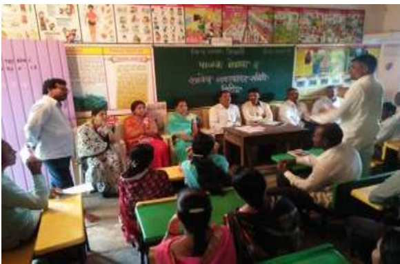
शाळा व्यवस्थापन समिती बैठक

लोकसहभाग :- लोकसहभागातून शाळेत स्वच्छतागृहे, पिण्याचे पाणी, किचनशेड साहित्य, आकर्षक रंगकाम, डिजिटल वर्गखोल्या, डिजिटल तक्ते, LED TV, कणाद प्रयोगशाळा निर्मिती, शेतीशाळा प्रकल्प, स्टडी टेबल, इंग्रजी, गणित कीट मांडणी, या सुविधा निर्माण करण्याचे आराखड्यात निश्चित झाले. एका शैक्षणिक वर्षात 940000 रुपये इतका रोख, वस्तू, बांधकाम आदि रूपाने लोकसहभाग मिळविला. गावातील महिला बचत गटांचा सहभाग घेतला. शाळेतील नियोजन क्रीडा, विविध स्पर्धा परीक्षा, सेमी इंग्रजी वर्ग सुरु करणे. कृतियुक्त अध्यापनासाठी प्रयोगशाळा निर्मिती, याकामी महिला पालकांचा उल्लेखनीय सहभाग दिसून आला.