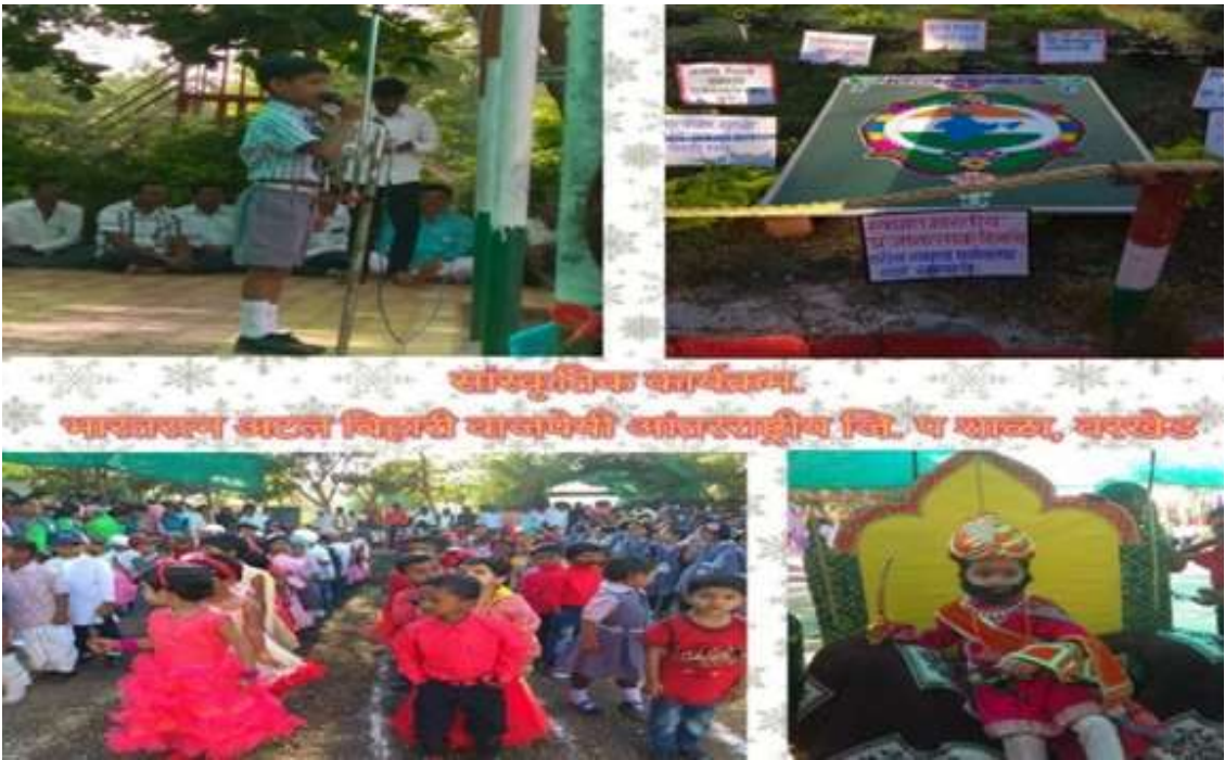
विविध सांस्कृतिक कार्यक्रमात सहभागी विद्यार्थी

सांस्कृतिक कार्यक्रम:- विद्यार्थ्यांच्या बौद्धिक विकासासोबतच सांस्कृतिक व सर्वांगीण विकास व्हावा सोबतच सभाधीटपणा, नेतृत्व, अशा गुणांचा विकास व्हावा व एक आदर्श नागरिक निर्माण होण्याच्या दृष्टिकोनातून सांस्कृतिक कार्यक्रमाचे आयोजन करण्यात येते. विद्यार्थ्यांमध्ये सभाधीटपणा येण्याच्या दृष्टिकोनातून शाळेमध्ये वक्तृत्व स्पर्धांचे हिंदी इंग्रजी व मराठी अशा विविध भाषांमधून आयोजन केले जाते