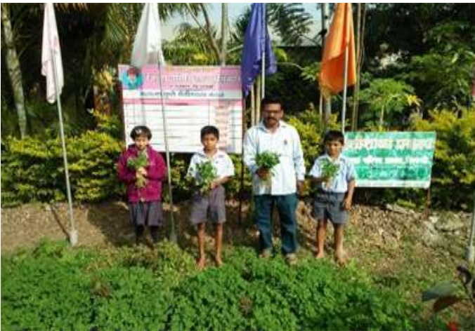
शेती शाळा प्रकल्प

शेती शाळा प्रकल्प :- “शेतीशाळा” प्रकल्पांनी मुलांचे मातीशी घट्ट नाते जोडले. बालवयातच मुलांना शेती शाळेचे धडे देणे, औषधी वनस्पतीच्या गुणधर्माबद्दल माहिती आत्मसात करणे, प्रात्यक्षिक अनुभव घेणे, श्रमप्रतिष्ठा, वृक्षसंवर्धन, वृक्षारोपण, शेती विषयक घटक मुलांच्या आवडीच्या पद्धतीने शिकवणे विद्यार्थ्यांना दृढकरण, स्वयंम अध्ययन, संशोधन इत्यादी संधी देणे व अध्ययन निष्पत्तीत 100% वाढ करणे यासाठी ह्या प्रकल्पाची परिणामकारकता दिसून आली. बालवयातच मुलांना शेतीशाळेचे धडे देण्यासाठी शालेय परिसरात भाज्यांची लागवड करून शेती शाळा प्रकल्पाची उभारणी केली आहे. मुलांना बियांची ओळख, वाफे तयार करणे, पाणी देणे, तण नाशके, कीड नियंत्रण, खुरपणे, भाज्या काढणे, पिकांचा कालावधी इत्यादी बाबतचे ज्ञान, प्रात्यक्षिक कृतीतून दिले जाते. उत्पादित होणाऱ्या बाबींचा शालेय पोषण आहारात उपयोग करून मुलांना जीवनसत्त्व युक्त आहार देण्याचा यशस्वी प्रयत्न शाळेने केला आहे. औषधी वनस्पती संवर्धन या प्रकल्पात कोरफड, तुळस, बेल, पानफुटी, हिरडा, बेहडा, आवळा, शतावरी, अडुळसा, गुळवेल, सदाफुली, धोतरा, ओवा, आले, हळद, पळस, पिंपळी, शेवगा, पपई यांची लागवड करून त्यांची माहिती दर्शक डिजिटल तक्ते विद्यार्थ्यांच्या अभ्यासासाठी लावले आहेत. त्याचा उपयोग विद्यार्थ्यांना प्रकल्प पध्दतीने गुणधर्म अभ्यासता येतात. गावातील महिला, मुले, तरुण, वृद्ध, औषधी वनस्पतीचा उपचारा साठी उपयोग करतात.