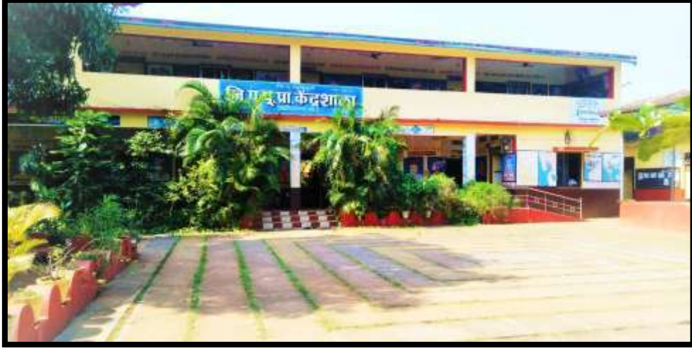
केंद्रशाळा खारेपाटण नं.१ शाळेची इमारत