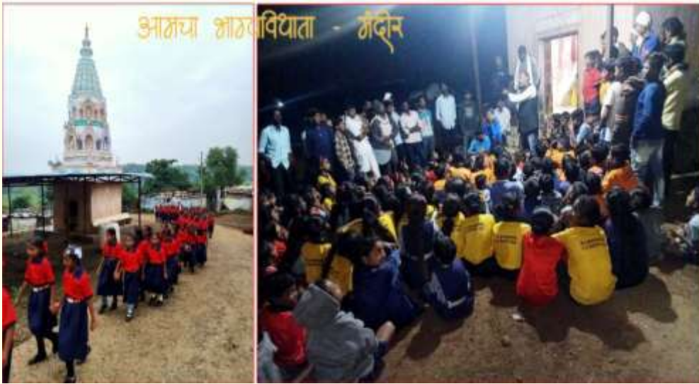
शाळेच्या विकासासाठी गावकर्यांनी दिलेला सहभाग