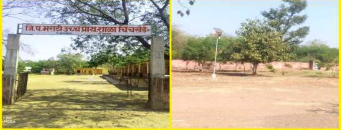
जिल्हा परिषद शाळा, चिंचखेडे बुद्रुक शाळेचे विस्तीर्ण मैदान असलेली इमारत