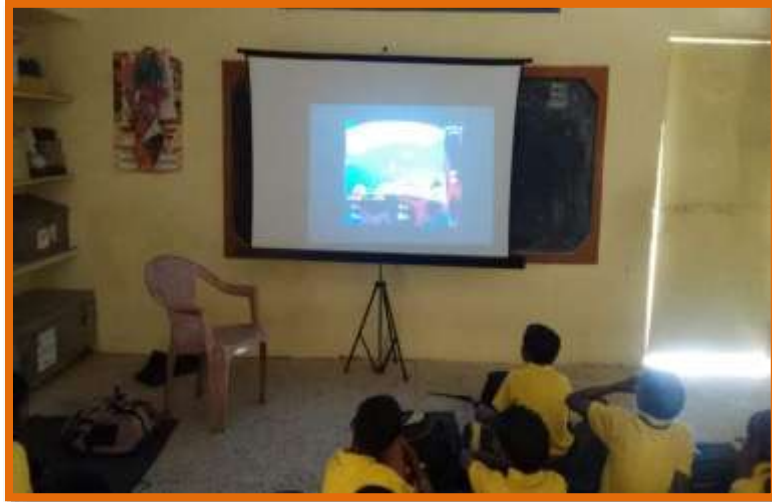
अध्यापनात तंत्रज्ञानाचा वापर

महिन्यातील 1 ते 31 या दिनांकानुसार दररोज पाढे म्हणत असल्यामुळे अनेक मुलांना पंचवीस ते तीस दरम्यानची पाढे पाठ झाली. त्यांचा गणित क्रीयेमध्ये वापर होतो व विद्यार्थ्यांचा कल गणिताकडे जास्त झुकल्यासारखा दिसून येतो. दररोज दहा नवीन शब्दांची स्पेलिंग पाठ करून सांगणे या उपक्रमामुळे मुलांचे शब्द ज्ञान व शब्दसंग्रह वाढीस लागले. मुलांना चित्रकला स्पर्धेमध्ये चित्र रेखाटण्याची रंग देण्याची माहिती मिळाली विद्यार्थ्यांमध्ये सुबकता व रंगसंगती दिसून आली. विद्यार्थ्यांकडून दररोज पंधरा ते वीस ओळी शुद्धलेखन इंग्रजी व मराठी भाषेत लिहून घेण्यात येते त्यामुळे विद्यार्थ्यांची स्पर्धा घेऊन बक्षीस देण्यात येते. स्पर्धा परीक्षा करिता सामान्यज्ञान व गणित क्रियेवर आधारित प्रश्नमंजुषा चे आयोजन करण्यात येते व विद्यार्थ्यांच्या गुणवत्तेवर विशेष लक्ष देण्यात येत आहे. शाळेत वर्गवार क्रीडा स्पर्धा आयोजित करण्यात येते व विद्यार्थ्यांच्या शारीरिक विकासासाठी विशेष लक्ष देण्यात येते.