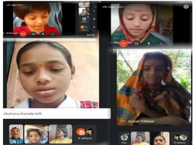
ऑनलाइन बालिका दिन