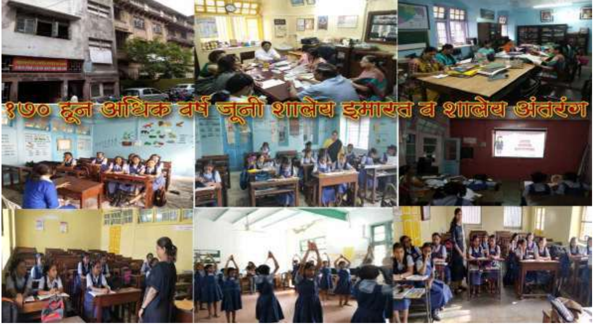
शाळेतील विविध उपक्रमात सहभागी विद्यार्थिनी

गेली 170 हून अधिक वर्ष ही संस्था आणि शाळा टिकून आहे. आजही या शाळेत विद्यार्थिनी उत्तमरित्या शिक्षण घेत आहेत. एस.एल.अँड एस.एस.गर्ल्स हायस्कूल या नावाने माध्यमिक शाळा ओळखली जाते. विद्यार्थिनीचा सर्वांगीण विकास व्हावा हे उद्दिष्ट डोळ्यासमोर ठेवून आजही मुख्याध्यपिका शाळेतील सर्व शिक्षक, कर्मचारी वृंद यांचे प्रयत्न चालू आहेत.