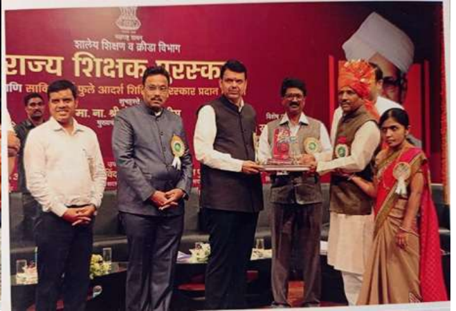
मुख्यमंत्र्यांच्या हस्ते राज्य आदर्श शिक्षक पुरस्कार

इयत्ता दहावी सलग दहा वर्षे शंभर टक्के निकाल आहे. तर एनएमएमएस, पाचवी व आठवी शिष्यवृत्ती परीक्षांमध्ये विद्यालयाने घवघवीत यश प्राप्त केले आहे.