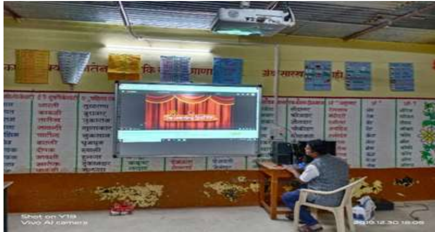
लोकसहभागातून डिजीटल शाळा

डिजीटल शाळा :- डिजीटल शाळा करण्यासाठी लोकवर्गणी 2 लाख रुपये गोळा करून त्यातून विद्यार्थ्यांना त्यातून SMART TV घेण्यात आला. पालकांनी भेट दिलेल्या स्मार्ट टीव्ही सामाजिक समस्यावर उदबोधन करण्यात आले.