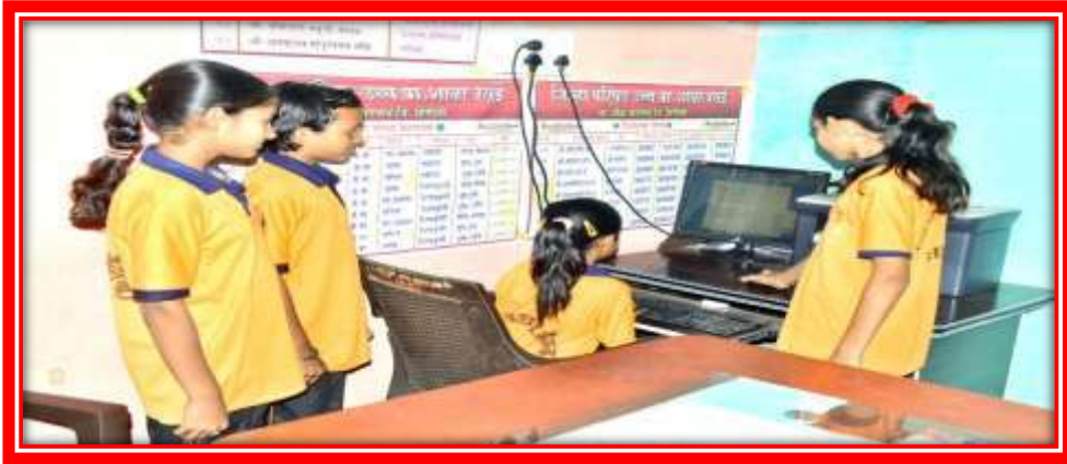
विविध विषय शिकविण्यासाठी संगणकाचा वापर

तंत्रज्ञानाचा वापर:- सध्याचे युग हे संगणकाचे युग म्हणून ओळखले जाते. संगणकाचा वापर दैनंदिन जीवनात पदोपदी होत आहे. प्राथमिक शाळा वसई येथे संगणकाची लॅब आहे. संगणक लॅब मध्ये पाच संगणक उपलब्ध आहेत. विद्यार्थ्यांच्या शैक्षणिक प्रगतीकरिता संगणकाचा वापर शाळेमार्फत केला जातो. विद्यार्थ्यांकडून स्कॉलरशिप, नवोदय विद्यालय, व MTS मंथन या परीक्षांचा सराव घेतल्या जातो. हे विषय शिकविण्यासाठी संगणकाचा वापर शाळेत प्रभावीपणे केला जातो. संगणक हे दृक्श्राव्य माध्यम असल्यामुळे विद्यार्थ्यांच्या मनावर ज्ञान प्रभावीपणे ठसविले जाते. प्रशासकीय कामकाजात सुद्धा संगणकाचा वापर केला जातो.