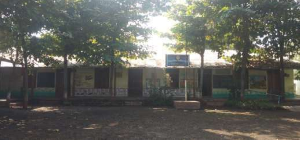
जिल्हा परिषद प्राथमिक शाळा हॅरिसन ब्रॅच शाळेची इमारत