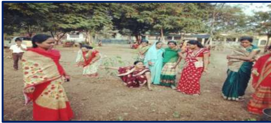
शाळा विकासात पालक सहभाग

शाळा विकासात लोकसहभाग :- शाळेच्या विकासात शालेय व्यवस्थापन समितीची भूमिका खूप महत्वाची राहिली आहे. शाळेच्या कोणत्याही उपक्रमाला समितीचा दुजोरा मिळत असे. “एक दिवस शाळेसाठी” या अंतर्गत प्रत्येक महिन्याला एकदा गावातील पालक शाळेच्या विकास कामात मदत करत असत. श्रमदानातून शाळेचा विकास करण्यात आला. विशेषतः महिला मंडळी च्या सहकार्यातून शाळेची जैविक परसबाग फुलविण्यात आली. ओसाड असलेल्या जमिनीवर गावकार्यांच्या मदतीने मशागत करून विद्यार्थ्यांना कार्यानुभव विषयातील उत्पादक उपक्रमातार्गत परसबागेचे महत्व पटवून देण्यात आले. महिला बचत गटाच्या मदतीने परसबागेत वांगे, टमाटर, पालक, इ. विविध उत्पादन घेतले जाऊ लागले.