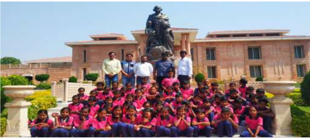
शैक्षणिक सहल महात्मा गांधी रिसर्च सेंटर जळगाव

शैक्षणिक सहल- सहल म्हटले की मुलांना मौज,मस्ती,मज्जा, उत्सुकता, जिज्ञासा, आनंद आणि अभ्यास आमच्या सहलीचा विषय आपल्या जळगाव जिल्ह्याची संपूर्ण ओळख असा होता. आम्ही मुलांना जिल्ह्यातील प्रसिद्ध पद्मालय गणपती मंदिर, गांधी रिसर्च सेंटर, गो शाळा, विमानतळ, वॉटरपार्क, हातनूर धरण, मुक्ताई साखर कारखाना, संत मुक्ताबाईंचे मंदिर, गांधी उद्यान, या स्थळांना भेटी देऊन स्वतः माहिती मिळवायला सांगितली. काही विद्यार्थ्यांना माहितीचे संकलन करण्याची जबाबदारी दिली. स्थळां विषयी मनात असलेल्या कुतूहलापोटी मुलांची निरीक्षण आणि संवादातून प्रेक्षणीय स्थळांचा इतिहास उलगडून दाखवला.