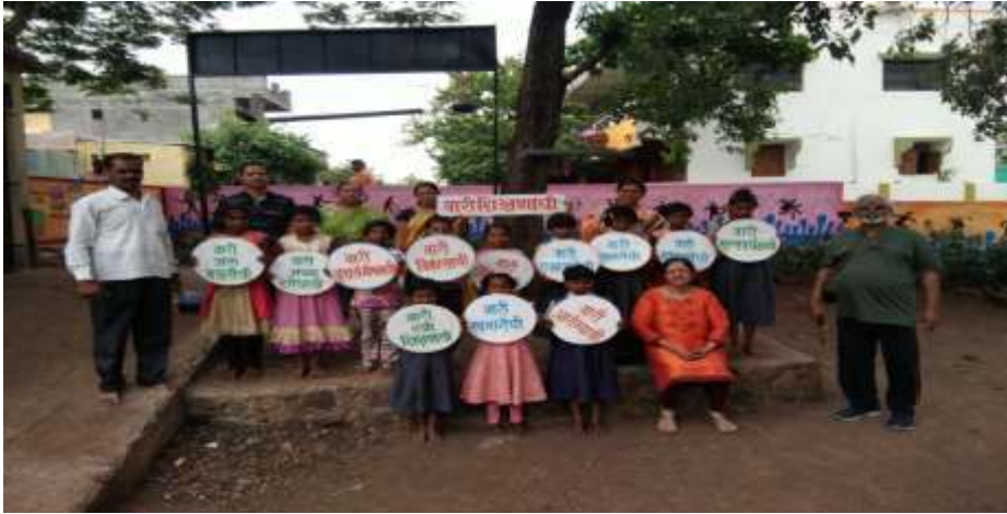
शिक्षणाच्या वारीत सहभागी विद्यार्थी व शिक्षक

शिक्षणाची वारी:- शाळेत शिक्षणाची वारी उपक्रम आयोजित करण्यात आला होता. या निमित्ताने मुलांनी विविध शैक्षणिक साहित्य तयार केले. गावात प्रभात फेरी काढली. विविध मान्यवरांनी यावेळी भेटी दिल्या.