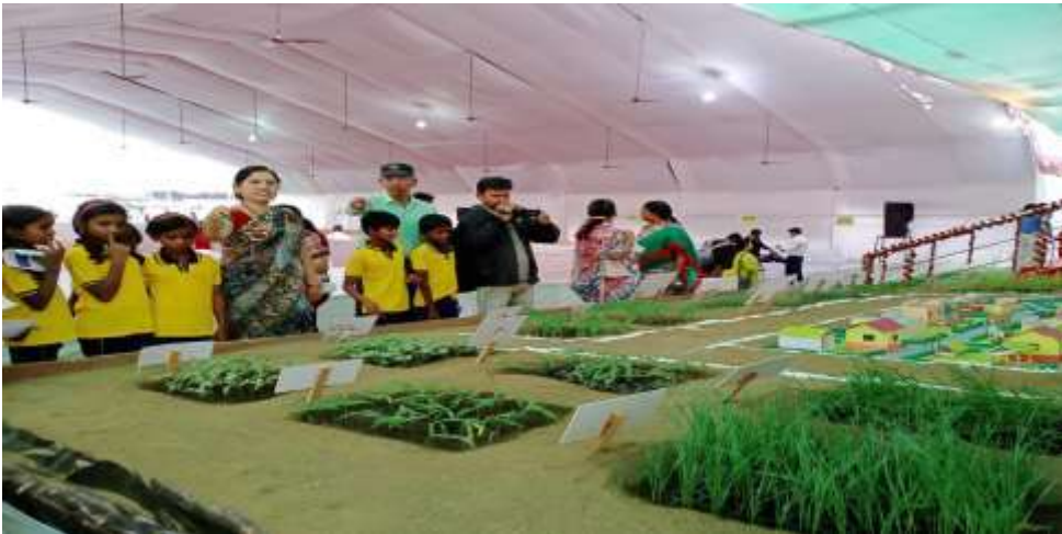
पंजाबराव कृषी विद्यापीठ अंतर्गत आयोजित कृषी व तंत्रज्ञान प्रदर्शनीला विद्यार्थ्यांची भेट