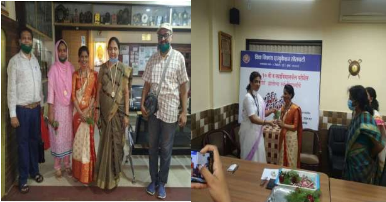
Felicitation of our successful student