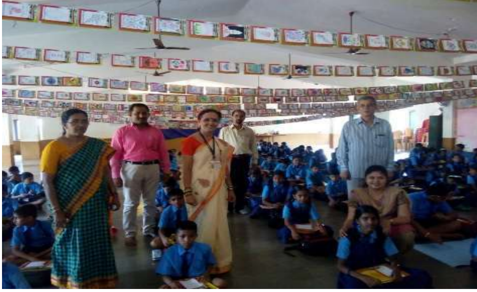
दिवाळी भेट कार्ड बनवितांना विद्यार्थी सोबत शिक्षक वृंद