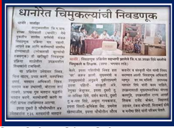
शाळेमध्ये पार पडलेल्या मंत्रीमंडळ निवडणुकिची छायाचित्रे व प्रसिद्धी पत्रक

मुख्याध्यापक व शिक्षकांचा स्वविकास :- मुख्याध्यापक व शिक्षकांनी शैक्षणिक व व्यवसायिक पात्रता वाढवल्या आहेत. तालुका स्तरापासून ते राज्यस्तर तसेच केंद्रसरकारच्या CCRT प्रशिक्षणाचाही लाभ घेतला आहे. नवोपक्रमांचे लेखन व कृतीसंशोधने सादर केली आहेत. सर्व शिक्षकांनी शैक्षणिक व व्यवसायिक पात्रता वाढवल्या मुळे नियोजन व व्यवस्थापनात सुसूत्रता येऊन संघबांधणी झाल्यामुळे विद्यार्थ्यांच्या सर्वांगीण विकासासाठी फायदा झाला. शिक्षकांनी केलेले लेखन, शालेय भाषणे, प्रज्ञाशोध मार्गदर्शिका, यशवंत शिष्यवृत्ती, प्रश्नपत्रिका संच, इत्यादीची निर्मिती, शैक्षणिक लेख लिहिले तसेच विभागस्तर, जिल्हास्तर, तालुकास्तर प्रशिक्षणात तज्ञ मार्गदर्शिकाची भूमिका पार पाडली. त्यामुळे शाळेला व शिक्षकांना खालील पुरस्कार प्राप्त झाले.