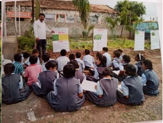
औषधी वनस्पतीचा उपयोग समजावताना