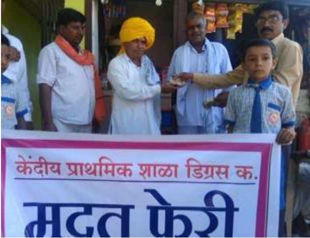
शाळेतील लोकसहभाग मदत फेरी

याशिवाय शाळेतील सर्व वर्गखोल्या डिजीटल करणे, शुध्द पिण्याचे पाणी उपलब्ध करून देणे, शैक्षणिक साहित्याची वैशिष्टपूर्ण मांडणी करणे, सौर पॅनल बसवून विजेच्या बाबतीत शाळेला स्वयंपूर्ण बनविले आहे अशा अनेक वैशिष्ट्यांमुळे डिग्रसची शाळा जिल्ह्याच्या मानबिंदुपैकी एक मानली जाते.