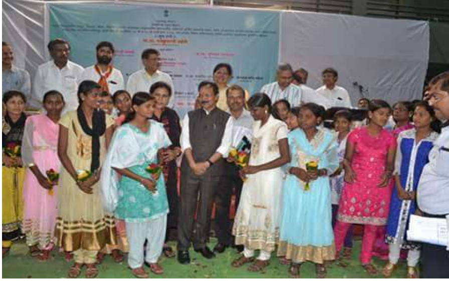
गुणवंत विद्यार्थीनींचा सत्कार करताना मा. राजकुमार बडोले तत्कालीन सामाजिक न्याय मंत्री.

नवोपक्रम :- शासकीय शाळेच्या जनमानसातील प्रतिमेला छेद देण्याचा संकल्प आम्ही केला. त्यासाठी विविध गटसमितीच्या माध्यमातून अनेक उपक्रम यशस्वी करण्याचा निर्णय झाला. शाळेस ४ एकरचा भव्य परिसर असून यात १२०९ चौमीटरची ३ मजली इमारत, व परिसर आहे. अपुऱ्या मनुष्यबळावर लक्ष देऊन काम करून घेणे जिकरीचे होते म्हणून विद्यार्थीनींच्या विविध विषयाच्या समित्या स्थापन केले. यात प्रामुख्याने, स्वच्छता, अरोग्य, अभ्यास, पर्यावरण, वीजबचत, पाणीबचत, मीनामंच, युकोक्लब, भोजन, वसतीगृह इ. समिती स्थापन करून प्रत्येक समितीस पालक मार्गदर्शन म्हणून एक शिक्षक, शिक्षिका देण्यात आले. या प्रमाणे प्रत्यक्ष अंमलबजावणीस प्रारंभ झाला.