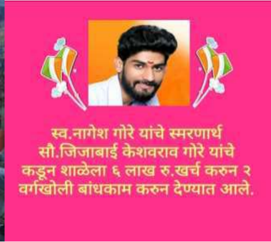
शाळेसाठी दिलेली देणगी

शालेय उपक्रम:- प्राथमिक शाळा ही लोकशाही शिक्षणाचे पहिले केंद्र असते. संविधानातील मूल्ये सहज रूजवावीत असेच उपक्रम शाळेत आखले जावेत, अशी समाजाचीही अपेक्षा असते. अशा सर्व अपेक्षांना पूर्ण करत शाळेत कायम समता व समानतेची वागणूक दिली जाते. दैनंदिन परिपाठ असो किंवा विज्ञान प्रयोगाचे सादरीकरण, सांस्कृतिक कार्यक्रम असो वा कथाकथन स्पर्धा, शाळेतील कामाची विभागणी असो वा शालेय पोषण आहाराचे वाटप असो, प्रत्येक बाबतीत सर्व विद्यार्थ्यांना संधी मिळालीच पाहिजे याकडे सर्व शिक्षकांचा कटाक्ष असतो. काही बाबतीत मागे असणा-या विद्यार्थ्यांना लगेच मुख्य प्रवाहात आणावे यासाठी जाणिवपूर्वक प्रयत्न केले जातात. जेव्हा सर्वांगिण विकासासाठी प्रयत्न होतात तेव्हा त्यातून काही पायंडे पडतात. काही सवयी आपोआपच विद्यार्थ्यांमध्ये रूजत जातात. काही संस्कारांची ठेव सहजच एकमेकांकडे हस्तांतरीत होते. यातूनच