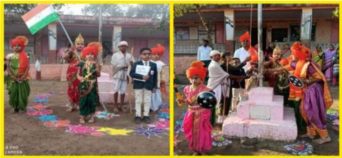
विद्यार्थिनींच्या हस्ते ध्वजारोहण करताना

शालेय विकास :- यासाठी शालेय समस्यांचे विश्लेषण, प्राधान्य क्रमाने करावयाच्या कामांची यादी, नवनवीन उपक्रमांची मालिका, दूरदृष्टी ही त्यांची वैशिष्ट्ये मला भावली. त्यांचा पहिला निर्णय ध्वजगीत म्हणणाऱ्या मुलींच्या हस्ते झेंडावंदन! ध्वजारोहणाचा अध्यक्षाना सन्मान बाजूला ठेवून केलेल्या या छोट्याशा कृतीमुळे एकसंघता वाढली. अध्यक्षांच्या मते, शाळेच्या विकासाचा एक हात शिक्षक आणि दुसरा हात समिती. दोघांनी हातात हात मिळवून एकसंघ, एक दिलाने काम करू या. आमच्या टीमने पहिले पाऊल टाकत दाते शोधून मुलांच्या आणि शाळेच्या गरजा पूर्ण केल्या.