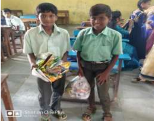
प्लास्टिक कचरा संकलन

प्लास्टिक टाळा पर्यावरण वाचवा :- सध्या विविध प्रकारच्या प्रदुषणामुळे पर्यावरणाची प्रचंड हानी होत आहे. विद्यार्थी दशेतच विद्यार्थ्यांना पर्यावरण संरक्षणासाठी मार्गदर्शन केल्यास विद्यार्थी स्वयंस्फूर्तीने पर्यावरण रक्षणासाठी प्रवृत्त होतात. खोपोली नगरपरिषदेच्या कचरा गोळा करण्याच्या मोहिमेत विद्यार्थी सहभागी झाले होते. त्यासाठी विद्यार्थ्यांना नोंदवही देण्यांत आले होते. विद्यार्थ्यांनी गोळा केलेला प्लास्टिक कचरा वर्गशिक्षक नोंदवहीमध्ये नोंद करत. व सहभागी सर्व विद्यार्थ्यांना पारितोषिके व प्रमाणपत्र दिली गेली. तसेच विद्यालयात प्लास्टिक पिशव्या ऐवजी कापडी पिशव्या वापराव्यात यासाठी प्रत्यक्ष कापडी पिशव्या कश्या तयार कराव्यात यासाठी मार्गदर्शन करण्यांत आले. यातून विद्यार्थ्यांना कमवा व शिका हा मंत्र मिळाला.