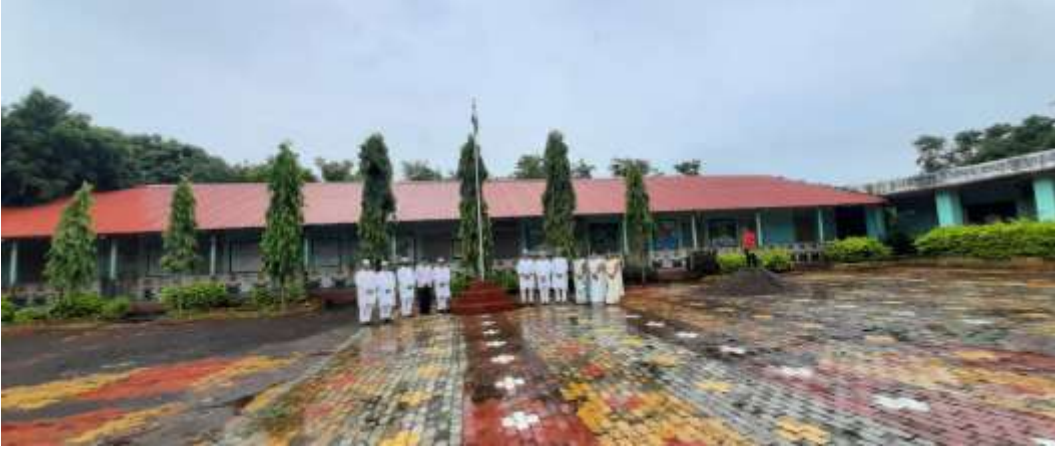
जिल्हा परिषद प्राथमिक शाळा, खलाणे शाळेची इमारत