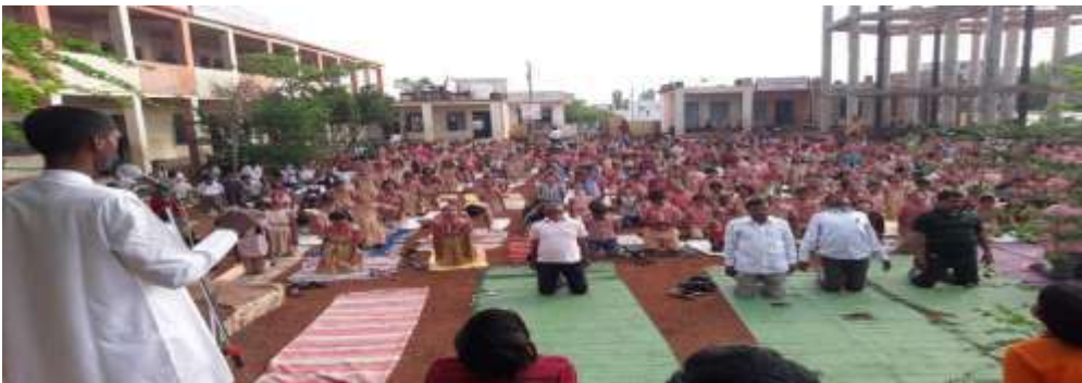
विशेष उन्हाळी मार्गदर्शन शिबिरामध्ये योगासने करताना विद्यार्थी व शिक्षक

अशा परिस्थितीमध्ये शाळेने एक अभूतपूर्व असा निर्णय घेतला. इयत्ता पहिलीची पटसंख्या 56 झालेली होती. त्याच वर्षी नवीन दोन वर्गखोल्या उपलब्ध होताच शाळेने लातूर जिल्ह्यात सर्वप्रथम इयत्ता पहिलीपासून सेमी इंग्रजी माध्यमाचा वर्ग सुरु केला. तत्कालिन गटशिक्षणाधिकारी यांनी स्वखर्चातून शाळेला प्रोत्साहन म्हणून विद्यार्थ्यांना लागणारी पुस्तके व इतर सर्व आवश्यक साहित्य पुरवले. पुढील वर्षी इयत्ता पाचवीचा वर्ग सुरु करण्याचे ठरले व पाचवीपासून ही सेमी इंग्रजी माध्यम देण्याचे निश्चित केले. विद्यार्थ्यांसाठी शाळेने 16 एप्रिल ते 31 मे या कालावधीत 46 दिवसांचे “मोफत विशेष उन्हाळी मार्गदर्शन शिबिर” आयोजित केले. सकाळी 6 ते 11 या वेळेत योगासने, प्राणायाम, विविध व्यायाम प्रकारच्या एका तासिकेसह इयत्ता पाचवी सेमी इंग्रजी माध्यम पूर्वतयारी तसेच इतर वर्गांची स्पर्धा परीक्षा पूर्वतयारी करून घेतली.