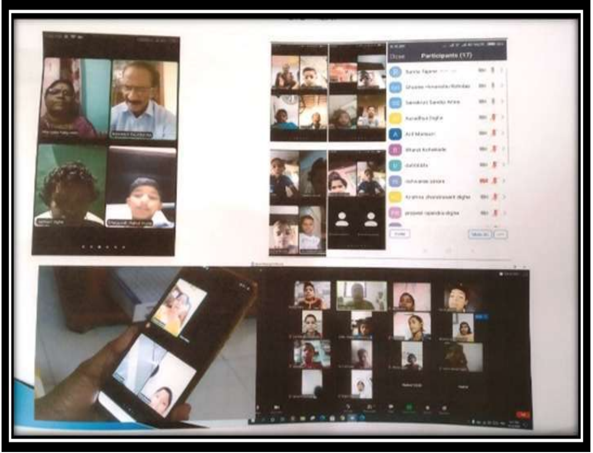
तंत्रज्ञानाच वापर करून कोविड-१९ काळातील online शिक्षण

तंत्रज्ञानाचा वापर :- तंत्रज्ञानामुळे अवघे जग मानवाच्या मुठीत आल्याचे भासू लागले आहे. प्रशासकीय कामकाजात संगणकाचा वापर केला जात आहे. तसेच दैनंदिन अध्यापनात ई-लर्निंग, प्रोजेक्टर, इंटर ACTIVE बोर्ड, झूम APP, दीक्षा APP, यांचा वापर तसेच स्वनिर्मित व्हिडीओ, ऑनलाईन टेस्ट शिक्षकांनी बनवल्या आहेत.