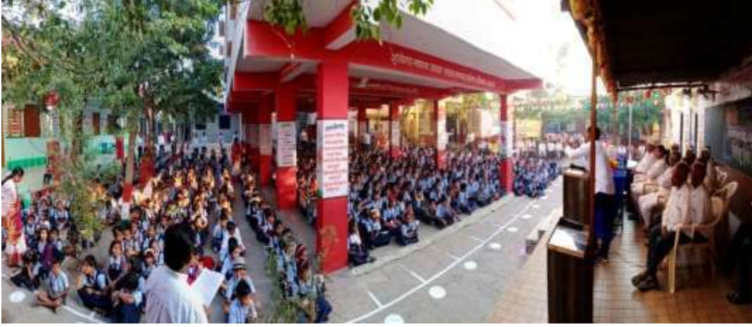
गुणवत्ता वाढीसाठी राबवलेले विशेष उपक्रम

शाळा. उदा.गुणवत्ता वाढीसाठी राबवलेले विशेष उपक्रम, डिजीटल शाळा--प्रत्येक वर्ग डिजिटल. हँडवाश सेंटरविद्यार्थी संख्येच्या प्रमाणात उपलब्ध. वृक्षारोपण पुढाकार शालेय परिसरात वृक्षारोपण व वृक्ष संवर्धन. सामाजिक समस्यावर उदबोधन गावातील प्रत्येक घरात स्वच्छतागृह. दारूबंदी आणि अंधश्रद्धा निर्मूलन इ. विद्यार्थ्यांचे क्रिडा स्पर्धातील यश केंद्र,तालुका,जिल्हा व राज्य स्तरावर विविध क्रीडा स्पर्धेत नेत्रदिपक यश. शाळेत राबविण्यात आलेले नाविन्यपूर्ण उपक्रम.