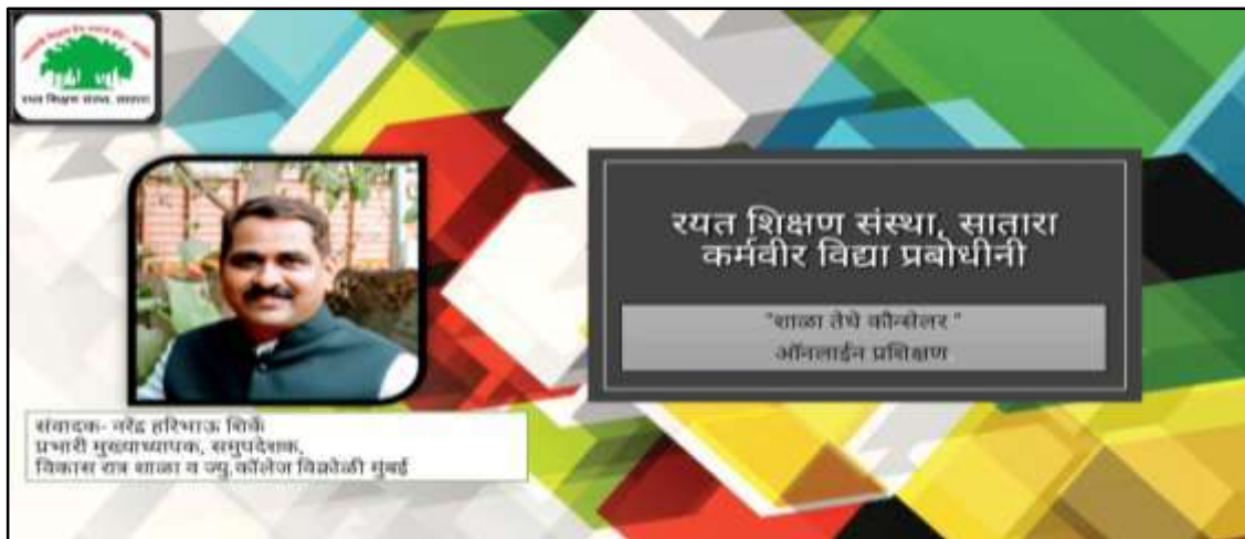
Rayat Shikshan Sanstha Online Webinar Series to support Online Educaction of our students in the Lockdown

Career guidance and counselling: - In a role of a State-counsellor. It helps us to overcome the challenges of the students in night school and junior college. We have taken 10 online sessions of renowned people working in various areas in National and International institutions these sessions give them the vision to choose their career. Some of our students have migrated from Mumbai to the natives as they have lost their jobs. Our motivation and positive thoughts gave them the strength to cope up with the stress. Till now we have given the information about 150 careers on Whats app status. It is very helpful for them. Students feel free to share their views and Ideas well as challenges. During the pandemic, 425 counsellors in Maharashtra have done Tele counselling for near about 2 lakh students in Maharashtra.