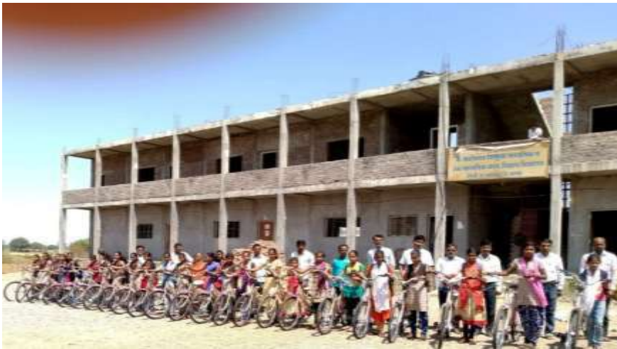
मानव विकास मिशन अंतर्गत मुलींना मिळालेल्या सायकली

लोकसहभाग :- पालक सहभागातून विद्यार्थ्यांच्या गुणवत्तेत होणाऱ्या बदलांचा विचार केला जातो पालकांच्या सूचनांचा आदर करून विद्यार्थ्यांच्या समस्या सोडवल्या जातात. शाळेमध्ये टेंभुर्णी परिसराच्या आजूबाजू मधून विविध खेड्यांमधून विद्यार्थिनींना बरेच अंतर पायी यावे लागत असे, परंतु ही समस्या देखील मानव विकास मिशन अंतर्गत मिळालेल्या सायकली मुळे दूर झाली.