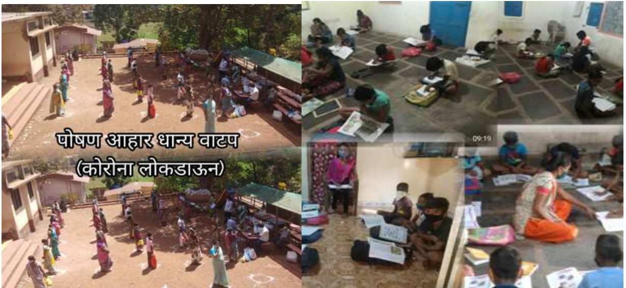
कोरोना कालावधीतील उपक्रम

शासन स्तरावरून सुरु असलेला शाळा बंद शिक्षण सुरु, स्वाध्याय पुस्तिका, रोजचा स्वाध्याय व विविध शासन परिपत्रका नुसार जिल्हा परिषद रत्नागिरी शिक्षण विभाग यांचेकडून आलेले सर्व उपक्रम Online पद्धतीने राबवत आहे. कोरोना कालावधीमध्येही हे सर्व उपक्रम विद्यार्थी, पालक, शा.व्य. समिती, सर्व शिक्षक, मुख्याध्यापक उत्तम रीतीने राबविले जात आहेत.