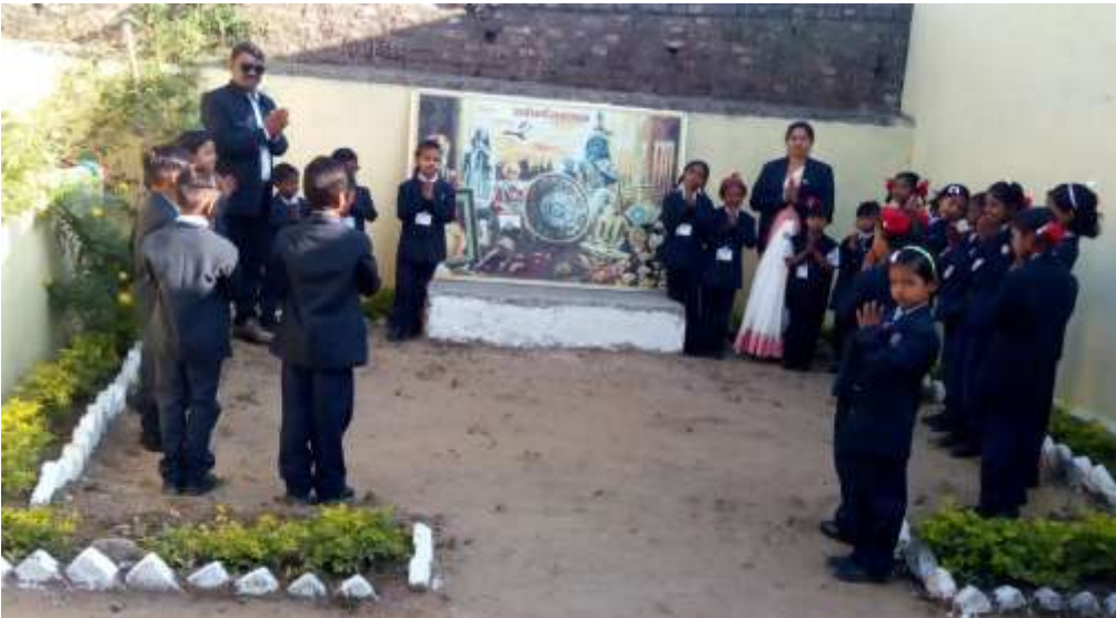
सर्वधर्म समभाव प्रार्थना करताना विद्यार्थी

सर्वधर्मसमभाव स्थळ : आधुनिक युगात विकासासोबत विनाश सुद्धा वाढतांना दिसत आहे. याला कारण धर्मांधता, जातीयता, वंशवाद वाढताना दिसत आहे. याकरिता सर्वधर्मसमभावाचे संस्कार बालपणात मिळाल्यास ते चिरकाल टिकते. याकरिता शालेय परिसरात अतिशय सुंदर असे प्रार्थनास्थळ तयार केले. नियमित सर्वधर्मसमभाव प्रार्थना व कथा गोष्टी ध्यानाच्या माध्यमातून संस्कार केले जाते.