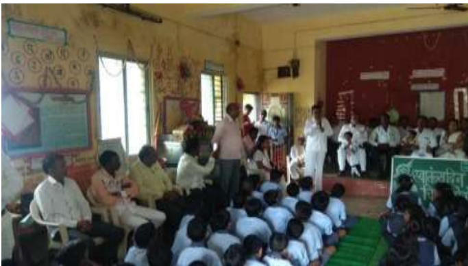
व्यवस्थापन समिती सभा

पालक व व्यवस्थापन समितीचा सहभाग : शाळा,पालक व व्यवस्थापन समिती नेहमीच शाळेचा विकासाचा योजनेत सहभागी असते. दुपारच्या सुट्टीत जेवणानंतर अभ्यास करायला लावणे असो किंवा रात्री अभ्यासाला बसायला लावणे असो त्यांचे नेहमीच सहकार्य असते. शाळा सुंदर करण्यास, ती नेहमी सुंदर राखण्यास संपूर्ण गावकरी सहकार्य करतात. पालकांच्या सहकार्यानेच आम्ही क्रीडा स्पर्धा, सहल, वनभोजन या सारखे उपक्रम राबविणे आम्हाला सोपे जाते .