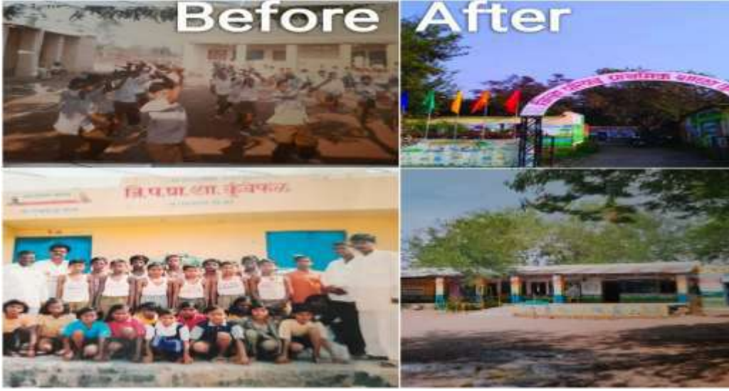
जिल्हा परिषद प्राथमिक शाळा कुंबेफळ शाळेची इमारत