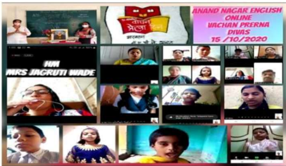
Online Reading Day celebration

Prosperous Library:- There are a lot of books available for the students in the school. Books have been made available by the Mumbai Municipal Corporation through a comprehensive curriculum. Reading Day is a government initiative for schools which is being implemented very successfully in schools. Reading has started boosting the self-confidence of the students. Little Poets and writers have started expressing themselves through stories, poems as well. Reading helped students to enrich their vocabulary. Surprisingly some of them started to compose poems!