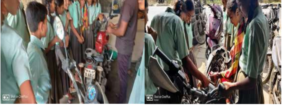
ऑटोमोबाईलचे प्रात्यक्षिक करताना विद्यार्थी

तंत्रशिक्षण :- राष्ट्रीय माध्यमिक शिक्षा अभियान अंतर्गत विद्यार्थ्यांमध्ये विविध प्रकारची कौशल्य विकसित करण्यासाठी विद्यालयामध्ये ऑटोमोबाईल व रिटेल या विषयांचे अध्यापन इ.9वी व इ.10वी च्या विद्यार्थ्यांना करण्यांत येते.