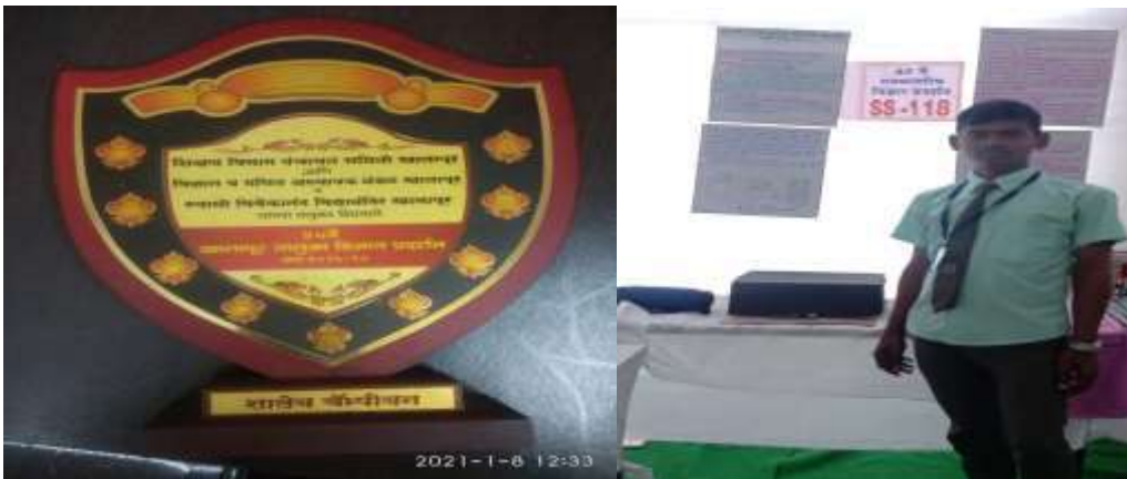
राज्य स्तरीय विज्ञान प्रदर्शनात सहभाग

विज्ञान प्रदर्शन व विज्ञान मेळावा :- दिनांक 2 जानेवारी 2018 रोजी विद्यालयात अपूर्व विज्ञान मेळाव्याचे आयोजन करण्यांत आले होते. विद्यार्थ्यांना विज्ञानाच्या संकल्पना अधिक स्पष्ट व्हाव्यात. प्रयोगशिलता निर्माण व्हावी. प्रयोग त्यांनी स्वतः करावेत. विज्ञानाची गोडी वाढावी यासाठी विज्ञान मेळाव्याचे आयोजन करण्यांत आले होते. या निमित्ताने विज्ञान रांगोळी, निबंध स्पर्धा, विद्यार्थी प्रयोग मांडणी यांचे आयोजन करणेत आले होते. व त्या विद्यार्थ्यांना प्रथम, द्वितीय, तृतीय क्रमांक काढून त्यांना प्रोत्साहन मिळावे या साठी बक्षिसे दिली. त्याचप्रमाणे प्रत्येक वर्षी 28 फेब्रुवारी हा दिवस विज्ञानदिन म्हणून साजरा करण्यांत येतो. दिनांक 31 जानेवारी 20 ते 2 फेब्रुवारी 2020 रोजी रायगड जिल्हा परिषद अलिबाग यांचे मार्फत घेण्यांत आलेल्या जिल्हा विज्ञान प्रदर्शनात या शाळेतील विद्यार्थ्यांना विज्ञान प्रदर्शनात आधुनिक शेती अवजार या प्रतिकृतीस द्वितीय क्रमांक, निबंध स्पर्धेत तृतीय क्रमांक प्राप्त झाला असून त्या प्रकल्पाची राज्यस्तरावर निवड झाली आहे. तसेच दि. 24 फेब्रुवारी 2020 ते 27 फेब्रुवारी 2020 रोजी आत्मामालिक माध्यमिक व उच्च माध्यमिक गुरूकुल कोकमठाण ता.कोपरगांव जि.अहमदनगर येथे राज्यस्तरीय विज्ञान प्रदर्शनात प्रतिकृती सहभाग नोंदविला.