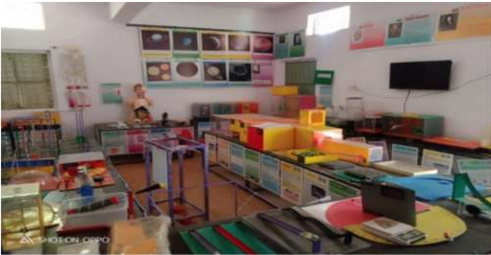
शाळेची सुसज्ज प्रयोगशाळा

सायन्स व्हॅली:- विद्यार्थी दशेत मुलांना विज्ञान विषयाची आवड तसेच वैज्ञानिक दृष्टिकोन निर्माण होणे यासाठी विद्यार्थ्यांची "विज्ञान दूत " म्हणून निवड करण्यात येते. नुक्तेच " महाराष्ट्र शासन" यांनी आपल्या शाळेची दखल घेत सुसज्ज अशी 10लक्ष रूपयांची "नाविन्यपूर्ण विज्ञान केंद्र" अंतर्गत प्रयोग शाळा दिली आहे.