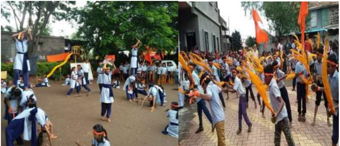
शाळेचे लेझीम व झांज पथक

सामुदायिक साहित्य कवायत(रिंग डंबेल्स लेझीम घुंगरूकाठी) :- विद्यालयात आठवड्यातून एकदा प्रत्येक शनिवारी विद्यार्थ्यांच्या कडून योगासने तसेच वेगवेगळे रिंग, डंबेल्स यासारखे कवायत प्रकार करून घेतले जातात. त्याचबरोबर लेझीमचा मुलांचा गट व मुलींचा गट झांजपथक मुलांचा गट व मुलींचा गट यासारखे पथक विद्यालयात निर्माण करण्यात आलेले आहेत. https://youtu.be/kz8IVJrqmdl