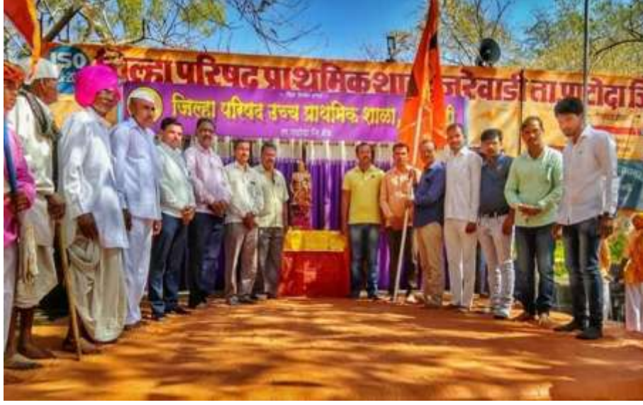
शाळेच्या विविध उपक्रमात गावकऱ्यांचा सहभाग