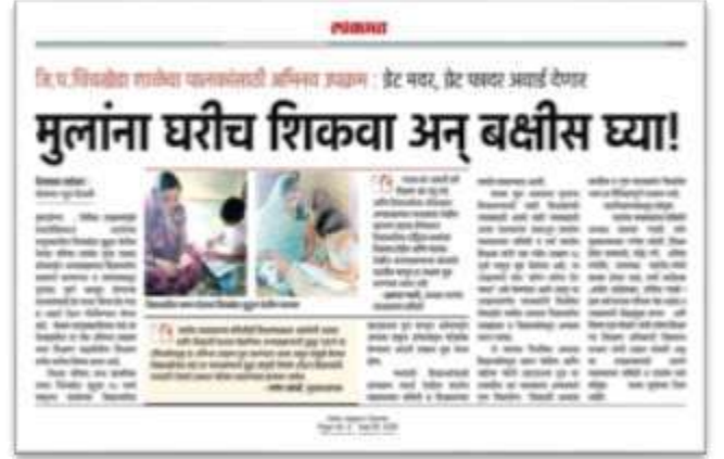
कौन बनेगा ग्रेट फादर व मदर

शिक्षण आपल्या दारी :- आमच्या शाळेचे शिक्षक यांची गाडी आणि शाळेचा एलईडी टीव्ही यांच्या मदतीने तयार झाला ‘शिक्षण रथ’ आमचा हा शिक्षण रथ गावातील विद्यार्थी वस्तीच्या चौकाचौकात संध्याकाळी उभा राहायचा. कोरोना पार्श्वभूमीवर दिलेल्या नियमांना पाळत आमची मुले शिकण्यासाठी पालकांसह उपस्थित असायची. यामुळे मुलांना भेटण्याचा, शिकण्यातील अडचणी दूर करण्याचा प्रयत्न झाला. सायंकाळी तीन तास हा रथ गावातील चौकात इयत्ता आणि विषयनिहाय मार्गदर्शन करायचा. यावेळी शाळा बंद पण शिक्षण सुरू, शिक्षण आपल्या दारी उपक्रम सोबतीला होतेच. आपोआप शाळेचे, गावाचे, शाळा व्यवस्थापन समितीचे बंध घट्ट जोडले गेले. मुले शिकती होऊ लागली.