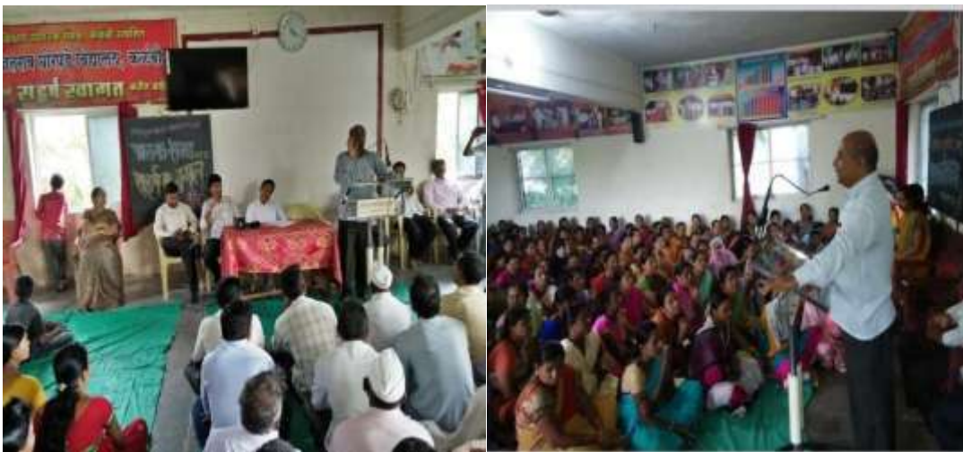
पालक सभेत सहभागी पालक

शाळा विकासात शिक्षक सहभाग पंचायत समिती शाळा व्यवस्थापन व पालक संघ :- शैक्षणिक वर्षाच्या सुरवातीला इयत्ता पाचवी ते दहावी च्या सर्व पालकांचे मेळावे आयोजित करण्यात येतात. सदर मेळाव्यात पालकांना विद्यार्थ्यांच्या अभ्यासाचे वेळापत्रक व शाळेचे वार्षिक, मासिक नियोजन, शिस्त, संस्कार, नियम याविषयी सूचना दिल्या जातात. विद्यार्थी शिस्त, वैयक्तिक स्वच्छता, सवयी, या सर्व मुद्द्यावर चर्चा करून मार्गदर्शन करण्यात येते. विद्यालयात शाळा व्यवस्थापन समिती, शिक्षक-पालक संघ, माता पालक समिती, शाळा व्यवस्थापन व विकास समिती, विद्या समिती, शालेय पोषण आहार समिती इत्यादी समित्या कार्यरत असून त्यांची नियमितपणे सभा होते. शाळा विकासाच्यादृष्टीने नवनवीन धोरणे उद्दिष्टे याबाबत चर्चा करून त्याचे अंमलबजावणी साठी व योग्य कार्यवाही साठी महत्त्वाचे धोरणात्मक निर्णय घेतले जातात. याचा शाळा विकासाच्या बदलसाठी खूप उपयोग झालेला आहे.