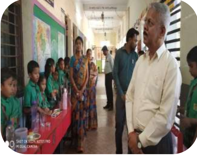
शाळेला नाविण्यपूर्ण विज्ञान केंद्र असून विद्यार्थी नवनवीन प्रयोगाचे प्रात्याक्षिक करून दाखवितात.