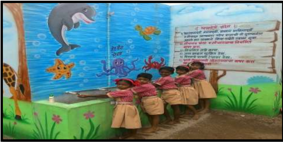
शाळेतील आकर्षक HAND WASH STATION

जून 2011 मध्ये कदमवाडी शाळेची पटसंख्या 20 होती. गुणवत्ता व पालक संपर्क या माध्यमातून सन 2019-20 या वर्षात शाळेची पटसंख्या 64 आहे. 2012-13 या वर्षात शाळेत इ.1 लीते 5 वी च्या वर्गशिक्षकांची शैक्षणिक साहित्य निर्मिती कार्यशाळा घेऊन शिक्षकांना प्रेरणा व मार्गदर्शन करण्यात आले. 2013-14 या वर्षात शाळेला गुणवत्ता विकास कार्यक्रमात तालुकास्तरीय प्रथम क्रमांकाचे 5000 रुपयांचे पारितोषिक प्राप्त झाले. 2016-17 या वर्षात शाळेला आय.एस.ओ. मानांकन प्राप्त झाले. 2016-17 या वर्षात प्रगत शैक्षणिक महाराष्ट्र कार्यक्रमांतर्गत 'प्रगत शाळा' म्हणून घोषित करण्यात आले. 2017-18 पासून शाळेत मिशन स्कॉलरशिप राबविण्यास सुरुवात. 17-18 व 18-19 या दोन वर्षात 2 विद्यार्थ्यांची नवोदयसाठी निवड झाली. स्कॉलरशिप मध्ये 14 विद्यार्थी पात्र व 4 विद्यार्थी शिष्यवृत्तीधारक झाले आहेत. 2019-20 मध्ये मिशन स्कॉलरशिप अंतर्गत बीटमधील टॉप 30 विद्यार्थ्यांचे दोन दिवसीय निवासी शिबीर शिक्षकांच्या निधीतून आयोजित केले. याचा खूप सकारात्मक निकाल यावर्षी लागला. शाळेतील 8 पैकी 8 विद्यार्थी पात्र व 4 विद्यार्थी शिष्यवृत्तीधारक झाले. सन 2011 पासून "सायंकाळचा अभ्यास" हा उपक्रम राबवीत आहोत. पालकांची बैठक घेऊन या उपक्रमाची माहिती दिली. घंटीच्या सूचनेनुसार सायंकाळी 6.30 ते 7.30 या वेळेत विद्यार्थी घरी अभ्यास करतात. या वेळेत एकही विद्यार्थी रस्त्यावर किंवा इकडे-तिकडे दिसणार नाही. अधून-मधून या वेळेत गावात फेरफटका मारून शिक्षक आढावा घेतात.