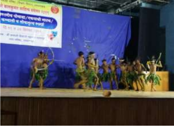
लोकनृत्य सादर करताना विद्यार्थी