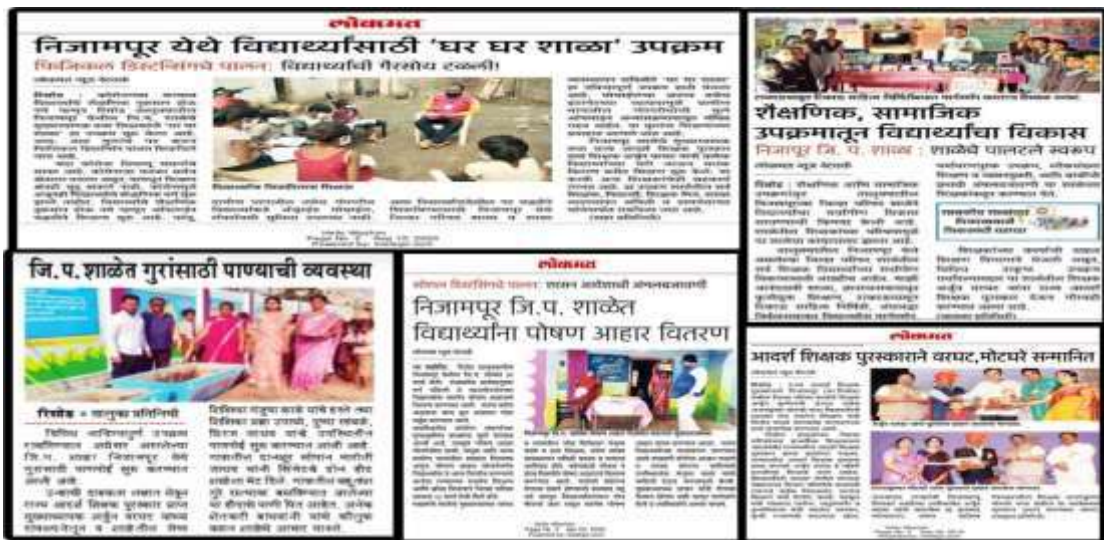
शाळेच्या विविध उपक्रमांना व यशाला मिळालेली वृत्तपत्रातील प्रसिद्धी

शाळेत राबविलेले विविध नवोपक्रम, लोकसहभागातून शाळा विकास, शाळा संगणकीकरण, गुणवत्तापूर्वक शिक्षण शालेय व सहशालेय उपक्रम व केलेल्या सामाजिक, शैक्षणिक व सांस्कृतिक कार्याची दखल घेवून शाळेच्या मुख्याध्यापकाना महाराष्ट्र शासनाने 'राज्य आदर्श शिक्षक पुरस्कार' दि. 5 सप्टेंबर 2018 रोजी प्रदान केला.