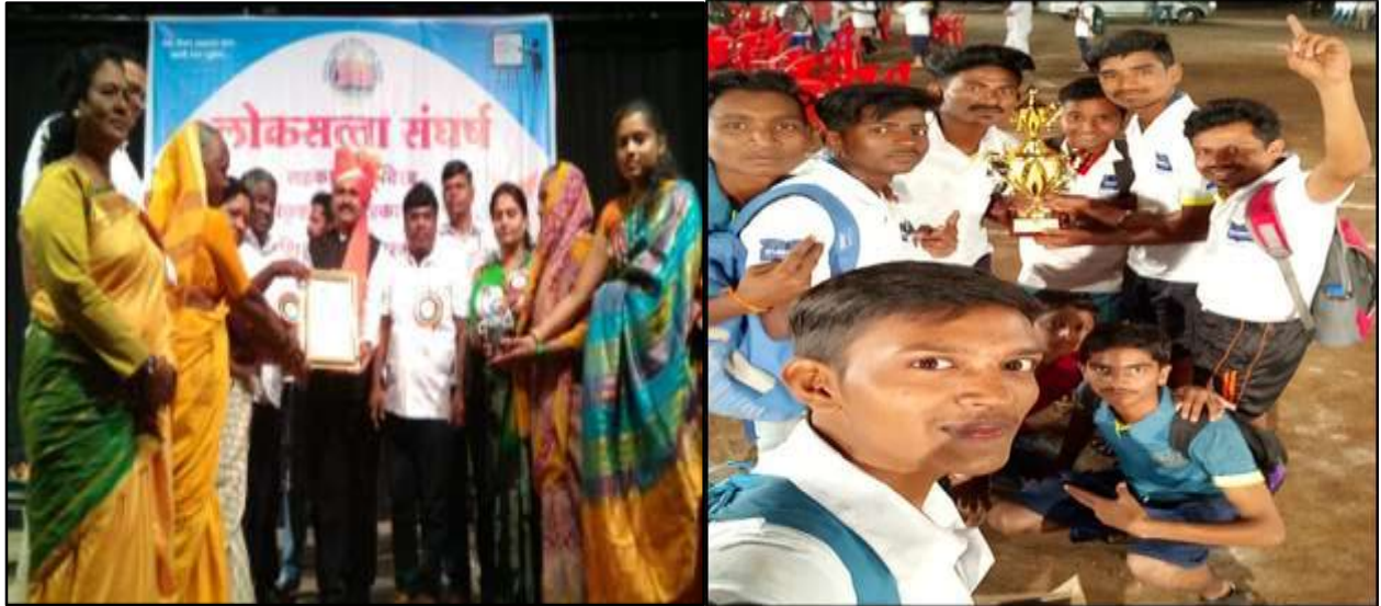
Achievements of our schools teacher and student