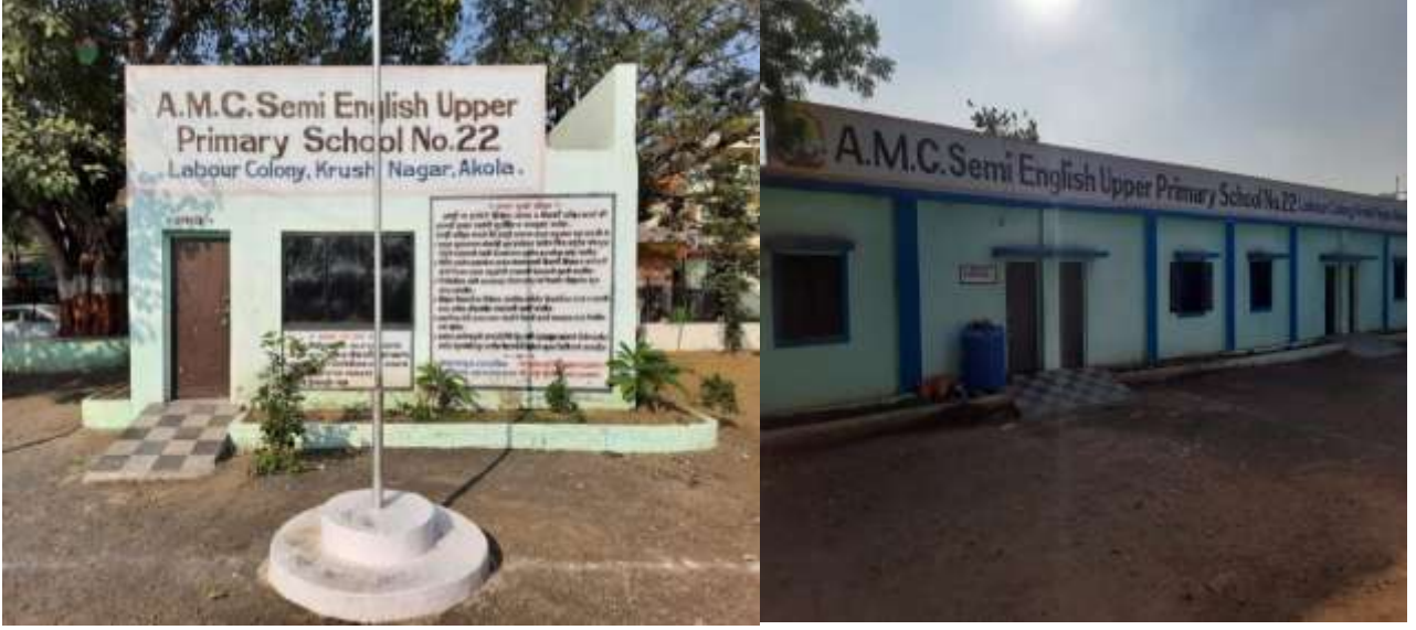
म.न.पा.उच्च प्राथमिक शाळा क्र.22,कृषिनगर,अकोला शाळेची इमारत