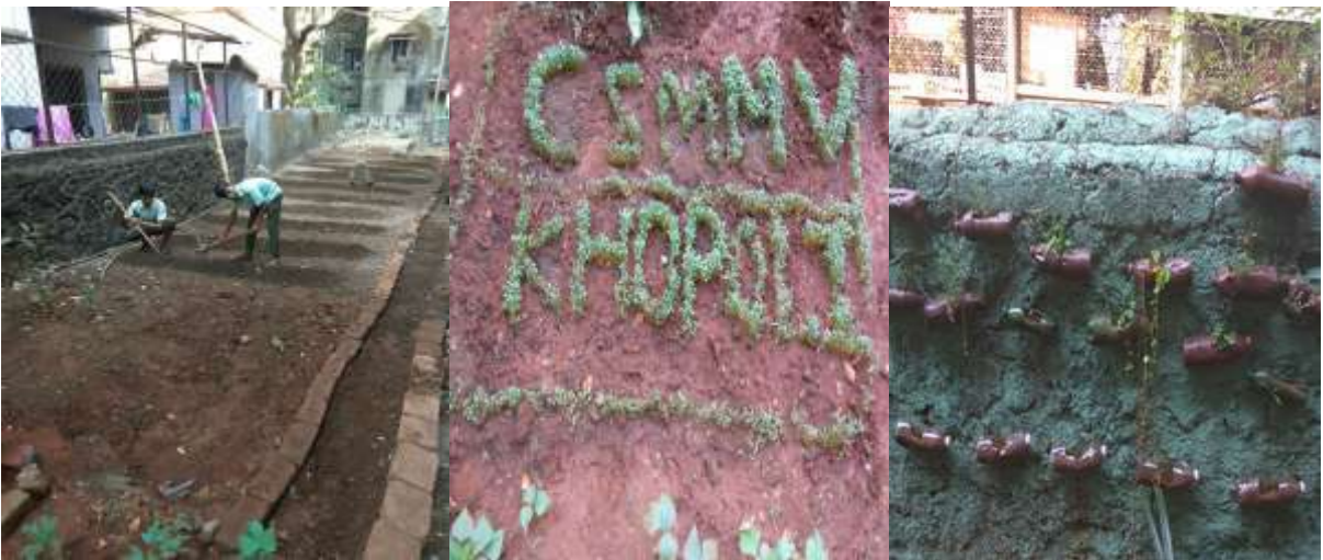
शालेय परिसरात औषधी वनस्पती लागवड

शालेय परिसरात औषधी वनस्पतींची लागवड:- शाळेच्या मुख्य इमारतीच्या परिसरात काही मोकळी जागा होती. लोकसहभागातून या जागेचे सपाटीकरण करून घेतले. त्याचबरोबर माती टाकून घेतली. या जागेत नगरपरिषदेच्या माध्यमातून मिळणारे गांडूळ खत मिसळून बगिचा तयार करण्यांत आला. या जागेमध्ये आयुर्वेदिक औषधी वनस्पती गवतीचहा, तुळस, हिरडा, शेवगा, सदाफुली, जास्वंद पानफुटी, आवळा, शतावरी पिंपळी काळी हळद अडूळसा कडूनिंब त्याचबरोबर फणस, केळी, अननस पेरू,पपई,डाळींब अंबा,शेवगा, रताळी या सारख्या फळ व भाज्यांची लागवड विद्यार्थ्यांच्या मदतीने करण्यांत आली. यामुळे रिकाम्या जागेचा योग्य वापर होवू लागला. औषधी वनस्पतींची विद्यार्थ्यांना ओळख होवू लागली. यातील काही वनस्पतींचा विद्यार्थ्यांना अध्यापनासाठी प्रत्यक्ष उपयोग होण्यात मदत झाली. सदर बगिच्यामध्ये 27 नक्षत्रांवर आधारित वनस्पतींची लागवड करणेचा मानस आहे.