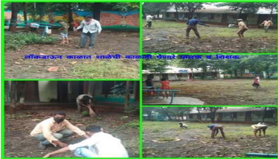
शाळेची निगा राखताना पालक

शाळेच्या विकासात शाळेच्या व्यवस्थापन समिती तसेच पालकांचा सहभाग :- आमच्या शाळेतील विद्यार्थ्यांचे पालक हे सर्व मजुरी करणारे असल्यामुळे त्यांची आर्थिक परिस्थिती बेताचीच आहे. ते जरी शाळेसाठी आर्थिक मदत देऊ शकत नसले तरी आपल्या परीने श्रमदानात सक्रीय सहभाग देत असतात. पालकांच्या सहकार्यातून शालेय कंपाउंड रंगकाम, तसेच परसबाग निर्मिती व शाळेच्या भौतिक सुविधेत सुधारणा करण्यात मोलाचा वाटा असतो. कोरोना कालावधीत शाळा बंद असताना पालक शाळेत येऊन शाळेच्या परिसराची स्वच्छता स्वतःहून ठेवत होते.