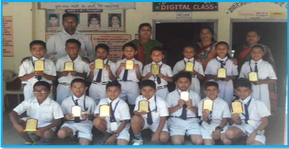
विविध स्पर्धांमध्ये बक्षिस पटकाविलेले शाळेचे विद्यार्थी

याचाच परीणाम म्हणून शाळेची 8 जानेवारी 2018 ला सिंगड टेक्निकल एज्युकेशन सोसायटी, लोणावळा येथे 'तेजस' करीता निवड झाली. जिल्हास्तरावर शिष्यवृत्ती परीक्षेत, M.T.S.E परीक्षेत, नवोदय परीक्षेत, गणित संबोध स्पर्धा परीक्षेत विद्यार्थ्यांना यश मिळाले. चित्रकला, हस्तकला, सांघिक खेळ, वैयक्तिक खेळ, क्रीडा स्पर्धा, संगीत, कराटे, लांब उडी, इत्यादी विविध स्पर्धेत विद्यार्थी जिल्हा व राज्यस्तरावर पात्र झाले. शारीरिक व बौद्धिक स्पर्धा, सुंदर हस्ताक्षर स्पर्धा, शुद्धलेखन स्पर्धा, स्वच्छता गीत व नाट्य स्पर्धा, ऑलिम्पियाड, विज्ञान इंस्पायर्ड अवॉर्ड, विज्ञान प्रदर्शनात सहभाग व क्रमांक मिळवू लागले. दैनंदिन उपक्रम राबवून, उत्तरोत्तर पटसंख्या वाढविणारी एकमेव नगर परिषद शाळा क्र.4 म्हणून ख्याती निर्माण झाली.