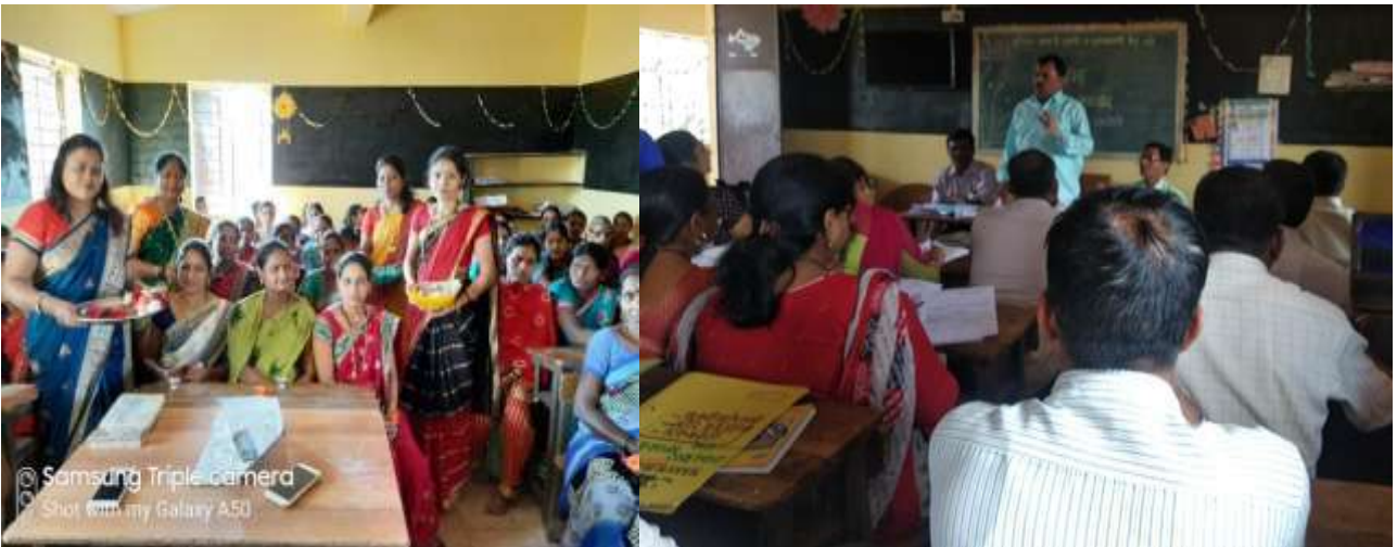
पालक सभा व हळदी कुंकू कार्यक्रम आयोजन

शाळा व्यवस्थापन समिती सदस्यांचे प्रशिक्षण – विद्यार्थ्यांच्या प्रगतीची मुख्य जबाबदारी जरी शिक्षक आणि शाळांची असली, तरी मुलांच्या सर्वांगीण विकासासाठी पालकांनीही योगदान द्यायला हवे. या समितीमध्ये पालकांना महत्त्वाचे स्थान दिल्याने गेल्या काही वर्षांत शिक्षक आणि पालक यांनी एकत्र येऊन समाज सहकार्यातून रहाटोली शाळा ही डिजिटल, ज्ञानरचनावादी शाळा तयार करण्यात यश मिळवले आहे.