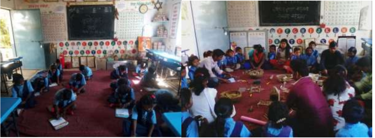
गावातील 10 वी 12 शिकलेले विद्यार्थी शाळेच्या विद्यार्थ्यांचा अभ्यास घेताना

विषयनिहाय नवोपक्रम:- शाळा 100 टक्के प्रगत करण्याच्या दृष्टीकोणातून विषयनिहाय नवोपक्रम राबविण्यात येतात. भाषा विषयाकरीता विद्यार्थ्यांना अक्षर वाचन, शब्द वाचन, गटागटातून शिक्षण, स्वयंम अध्ययन कार्ड देण्यात आले. गणित विषयाकरीता अंकज्ञान, पाढे, गणितीय क्रिया या करीता गणित पेटी, भाषा पेटी, त्यासोबत नवनविन व्हिडीओ, टिव्ही, भाषा चित्र अंक कार्ड चित्र इत्यादि चा उपयोग करण्यात आला. इंग्रजी विषयाकरीता चित्र कार्ड व मुळाक्षरे कार्ड याचा उपयोग केला. इंग्रजी शब्द संपत्ती वाढविण्याकरीता शिक्षक हजेरी घेतांना विद्यार्थी YES सर म्हणण्या ऐवजी फुलांची नावे, झाडांची नावे, रंगाची नावे, प्राण्याची नावे, फळांची नावे, पक्ष्यांची नावे, अवयवांची नावे व इतर शब्दांचे स्पेलिंगसह म्हणण्याचा उपक्रम घेण्यात आला. याकरीता विद्यार्थी आधीच्या दिवशी कोणता विषय व कोणता वर्ग राहिल याची निश्चीती करतात व ते स्पेलिंग सह म्हणतात. या नवोपक्रमांमुळे विद्यार्थ्यांची इंग्रजी शब्द संपत्ती वाढण्यास मदत झाली. गावातील 10 वी व 12 शिकलेले विद्यार्थी शाळेच्या विद्यार्थ्यांना गृह अभ्यास करून घेण्यासाठी दररोज गावाच्या मध्यभागी घेउन बसू लागले. अशा प्रकारे विविध नवोपक्रमाद्वारे शाळेच्या विद्यार्थ्यांना प्रगत करण्याचा प्रयत्न आम्ही केला.