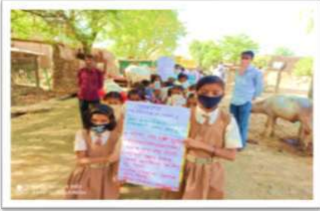
कोरोना जनजागृती रॅली