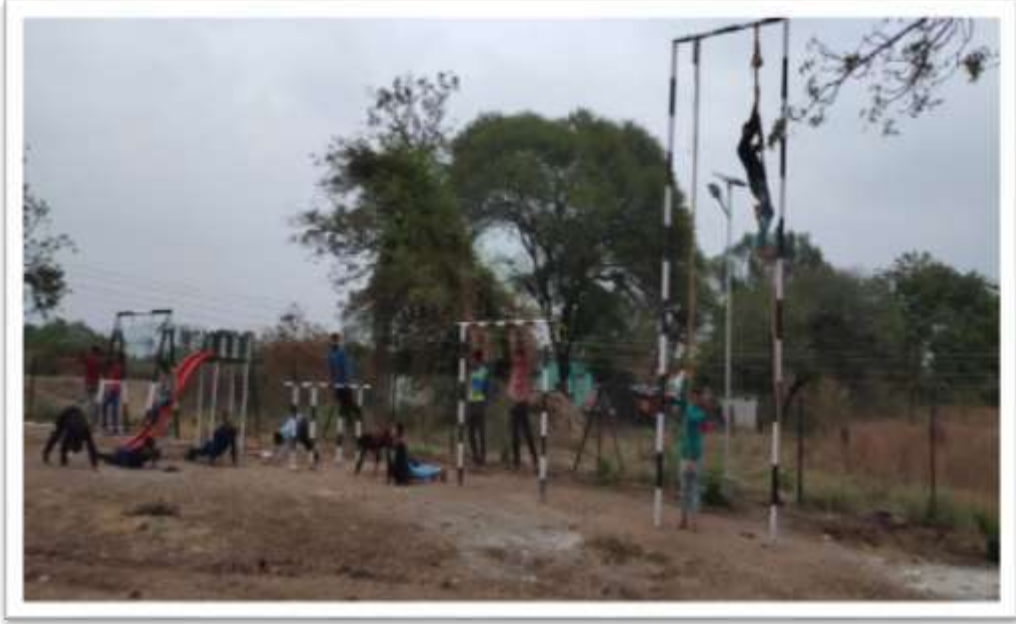
शाळेच्या मैदानात कसरतीचा सराव करताना तरुण

कोणत्याही सेवेत रुजू झाल्यानंतर पहिले दोन महिन्यांचे वेतन शाळेस देण्याचा मानस करून शाळेप्रती आपली बांधिलकी व्यक्त केली आहे. निश्चित ही बाब गाव व शाळा यांना भविष्याप्रती आश्चस्त करणारी आहे.