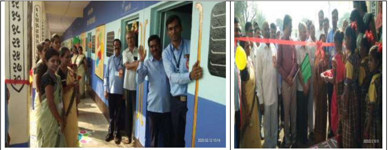
शाळेचे बदललेले आकर्षक रूप

शाळेचा भौतिक विकास :- विविध उपक्रम राबवीत असतांना शाळेचे बाह्यंग आकर्षित करणे आवश्यक होते. त्या दृष्टीने ग्रामपंचातीच्या सहकार्याने नंदूरबार जिल्ह्यातील सर्वात आकर्षक अशी शाळा झाली आहे. शाळेला 'रेल्वेगाडी लुक' रंगकाम करण्यात आले. त्यामुळे आमची शाळा गावकऱ्यांसाठी सेल्फी पॉईंट ठरली. या रंगकामाचा शिक्षकां बरोबरच शालेय विद्यार्थ्यांना व पालकांना खुपच आनंद होता. माजीविद्यार्थिनी, महाविद्यालयीन मुले मुली शाळा पाहण्यास येत होते.