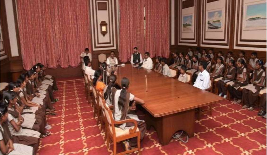
तत्कालीन शिक्षण मंत्री माननीय विनोदजी तावडे साहेब यांच्याशी चर्चा करताना विद्यार्थी व शिक्षक

शैक्षणिक सहूल व क्षेत्रभेट - आमच्या शाळेत दरवर्षी विविध सहूल किंवा क्षेत्रभेटीचे आयोजन केले जाते. यामध्ये कृषी विषयक ज्ञान मिळविण्यासाठी विविध शेतांना भेटी, ऐतिहासिक स्थळे धार्मिक स्थळे, भौगोलिक स्थळे यांना भेटी. या सर्व क्षेत्र भेटी किंवा सहूलिंमध्ये आमच्यासाठी अविस्मरणीय ठरली ती मुंबईची सहूल. मुंबईच्या सहूल दरम्यान तत्कालीन शिक्षण मंत्री माननीय विनोदजी तावडे साहेब यांना प्रत्यक्ष भेटण्याची संधी आमच्या शिक्षक व विद्यार्थ्यांना मिळाली. मंत्रालयात जाऊन तत्कालीन शिक्षण मंत्री विनोद तावडे साहेब यांची फक्त भेट झाली नाही तर या भेटीमध्ये विद्यार्थी व मंत्रीमहोदयां मध्ये समोरासमोर सुसंवाद देखील झाला. या भेटीमध्ये विद्यार्थ्यांनी मंत्री महोदयांना आपल्या शेतातील प्रसिद्ध बोरे व पेरू भेट म्हणून दिले. ही भेट स्वीकारून मंत्रीमहोदयांनी विद्यार्थ्यांना विचारले, की आता माझ्याकडून तुम्हाला काय भेट हवी आहे? आमच्या एका विद्यार्थ्याने तत्काळ उठून उत्तर दिले की, महोदय आमच्या शाळेमध्ये सर्व सुविधा आहेत, आता आम्हाला फक्त एका विज्ञान प्रयोग शाळेची गरज आहे. तावडे साहेबांनी त्या विद्यार्थ्याला तुमच्या शाळेत प्रयोगशाळा नक्कीच येईल असे आश्वासन दिले. आणि त्यामुळे आमच्या शाळेमध्ये आज सुसज्ज अशी विज्ञान प्रयोगशाळा देखील आहे.