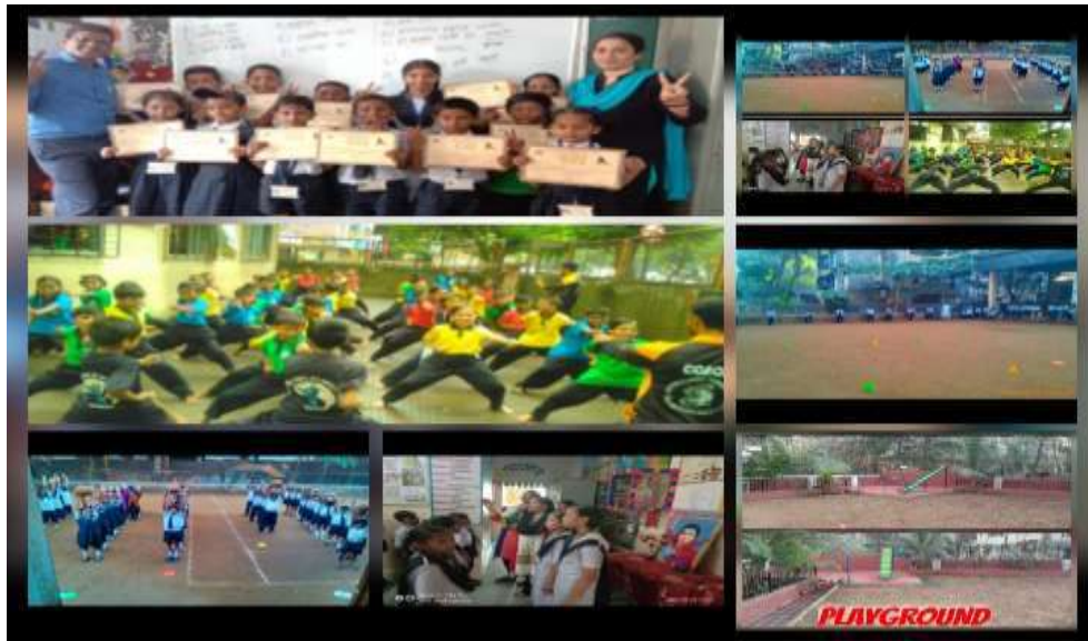
Various activities on school playground

plants are planted and taken care of daily. Students have achieved a great success in many sports and games.