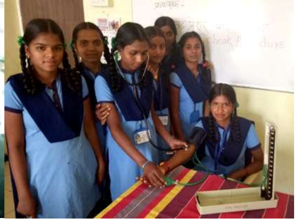
क्षेत्रभेट : शासकीय प्राथमिक आरोग्य केंद्र