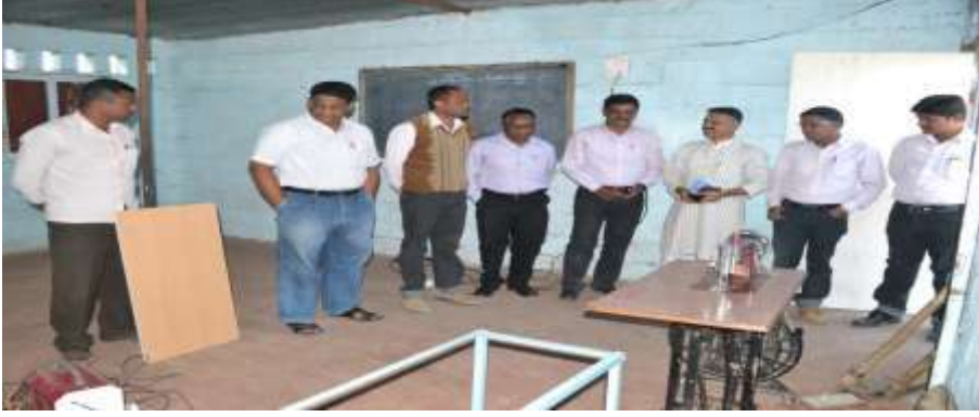
शाळेत शिलाई काम शिकवण्यासाठी शिलाईचे मशीन उपलब्ध करून दिले

कृतीशील उपक्रम:- राष्ट्रीय अभ्यासक्रम आराखडा व राज्य अभ्यासक्रम आराखड्यात दिलेल्या उद्दिष्टांप्रमाणे अध्यापन करण्याच्या दृष्टीने विद्यालयात सातत्याने प्रयत्न केले जात आहेत. प्राथमिक ते माध्यमिक स्तरावरील विद्यार्थ्यांना अध्ययन सुलभ व्हावे यासाठी ज्ञानरचनावाद अत्यंत उपयुक्त पद्धती असल्याचे सिद्ध झाले आहे. या पद्धतीमुळे शालेय गुणवत्तेत मोठ्या प्रमाणात वाढ झाली. याचा गुणात्मक फायदा दिसून आला. विद्यालयात कृतियुक्त शिक्षण कसे देता येईल, याबाबत विचार केला. त्यातूनच व्यवसायात्मक शिक्षणाची संकल्पना पुढे आली. विद्यार्थी आणि शिक्षक यांच्या मदतीने विद्यालयातील मुलामुलींना शिलाई मशीन, फोटो प्रेम बनविणे, वेल्डिंग मशीनच्या साह्याने टेबल बनविणे, सुतारकाम, गवंडीकाम अशी कामे शिकविली. कृतियुक्त आणि वेगळ्या पद्धतीने शिकावयास मिळाल्याने विद्यार्थ्यांची शाळेप्रती ओढ वाढली. विद्यार्थी आनंदाने या सर्व गोष्टी शिकू लागले.