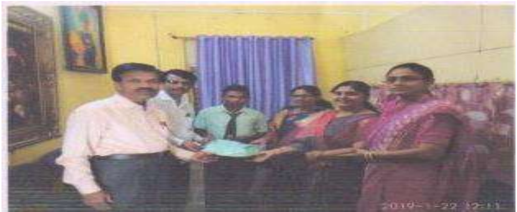
शालेय गणवेश व शैक्षणिक साहित्याचे वाटप करतांना मान्यवर.

लोकसहभाग :- 26 जून 2018 पाउलवाट मैत्रिची या संस्थेमार्फत शाळेतील गरीब, गरजू विद्यार्थ्यांना शैक्षणिक साहित्याचे मान्यवरांच्या हस्ते वितरण करण्यांत आले. इ.9वी व इ.10वी 23 विद्यार्थ्यांना प्रत्येकी 1 डझन वह्यांचे वितरण करण्यांत आले. इ.10वी च्या पाच विद्यार्थ्यांना पाठ्यपुस्तकांचे पुर्ण सेटचे वितरण करण्यांत आले. 17 जून 2019 - शाळेतील इ.5वी ते इ.8वी च्या विद्यार्थ्यांना सर्व मुली व एस.सी, एस.टी मुले यांना मोफत गणवेश वाटप मा.सभापती यांचे हस्ते सर्वशिक्षा अभियानांतर्गत करण्यांत आले. या व्यतिरिक्त जे विद्यार्थी गणवेश व शैक्षणिक साहित्यापासून वंचित रहात होते अश्या विद्यार्थ्यांना आमच्या प्रयत्नातून नगरपरिषदेस विनंती करून इ.5वी ते इ. 8वी चे उर्वरीत विद्यार्थी व इ. 9वी व इ.10वी चे सर्व विद्यार्थ्यांना मोफत गणवेशाची व शैक्षणिक साहित्याची तरतूद करून, नगरपरिषदेकडून वाटप करण्यांत आले. त्याचप्रमाणे नगरपरिषदे मार्फत शाळेतील सर्व विद्यार्थ्यांना मोफत दप्तरही वाटप करण्यांत आले.