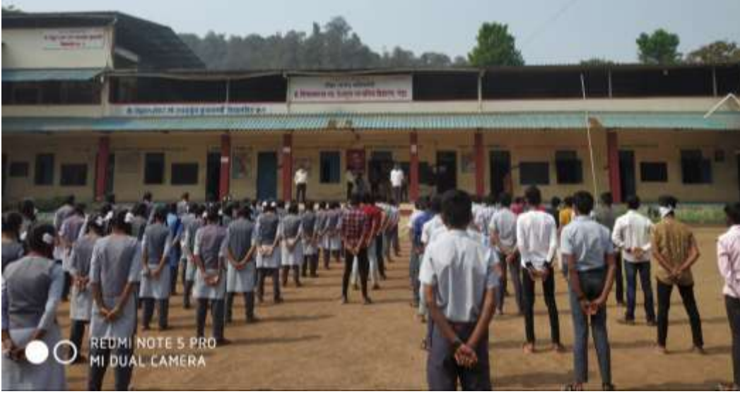
शाळेचा दर्शनी भाग व परिसर