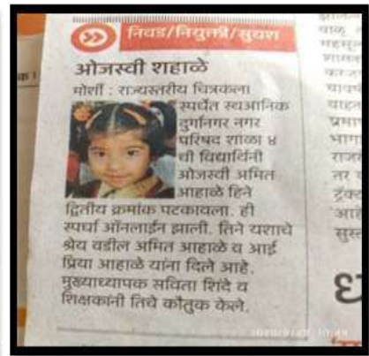
शालेय यशाचे शिल्पकार यशस्वी विद्यार्थी