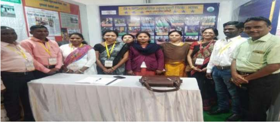
शिक्षणाच्या वारीतील सहभाग

या शाळेत केलेल्या कार्याची दखल घेत शाळेच्या शाळा व्यवस्थापन समितीला शिक्षणाच्या वारीत प्रदर्शनाची संधी मिळाली. राज्यस्तरातून आलेल्या मान्यवरांनी सर्व टीम चे अगदी भरभरून कौतूक केले. किशोर मासिकात शाळेतील मुलांचा सहभाग असतो. त्यातील प्रश्नसंच सोडवून घेणारी आजही जिल्ह्यातील एकमेव शाळा आहे.