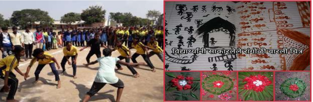
क्रीडा प्रकार – कबड्डी विजेता संघ

शाळेची यशोगाथा :- जिल्हा, विभाग, राज्य, राष्ट्रीय स्तरावर यशस्वी उपक्रम क्रीडा प्रकार कला प्रकार यात नैपुण्य. शासकीय माध्यमिक आश्रम शाळा, पारेगाव, चांदवड येथे विद्यार्थ्यांच्या कला व क्रीडा गुणांना वाव मिळण्यासाठी दररोज योगासने, व्यायाम, खेळ, घेतले जातात. त्याच प्रमाणे विविध स्पर्धा आयोजित केल्या जातात. व्यायाम, खेळ, नाट्य स्पर्धा, रांगोळी स्पर्धा, कथाकथन, वैज्ञानिक प्रयोग घेतले जातात. खेळात शाळेतील विद्यार्थ्यांनी गतवर्षी कबड्डी (मुले) मोठा गट, तालुका स्तरापर्यंत प्राविण्य मिळवले होते तसेच प्रकल्पात घेतलेल्या नाट्यस्पर्धेत शाळेच्या मुलींच्या गटाने तालुका स्तरापर्यंत नैपुण्य मिळवले. विज्ञान मध्ये (Inspire Awards) अंतर्गत प्रयोगाची निवड जिल्हा स्तरावर गेल्या वर्षी झालेली आहे. अशा पद्धतीने शाळेतील विद्यार्थ्यांना दररोज खेळ, व्यायाम, कला, संगणक, शिकवले जाते.