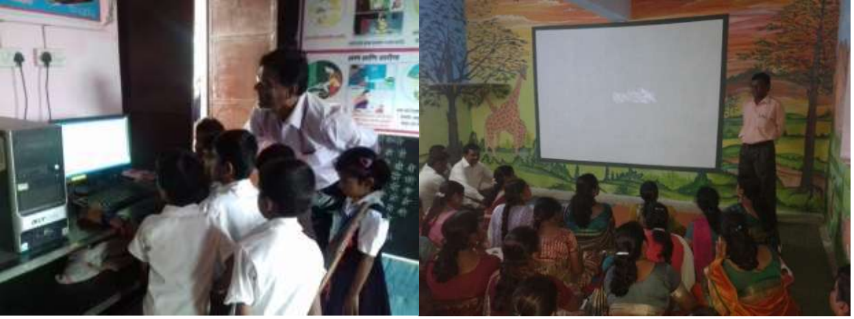
विद्यार्थ्यांना संगणक विषयी माहिती देताना

रेडीओ, दूरदर्शन, LCD संगणक यांचा वापर अध्यापनात केला जातो. वेगवेगळे शैक्षणिक video दाखवले जातात. लहान वयापासून मुलांना संगणकाची माहिती व्हावी यासाठी शाळेत 'संगणक कक्ष' उपलब्ध आहेत. तंत्रज्ञानाचा वापर होत असल्यामुळे विद्यार्थी पट वाढला आहे, उपस्थितीमध्ये सुद्धा लक्षणीय वाढ झाली आहे. शैक्षणिक गुणवत्ता वाढ झाल्यामुळे प्रगत शाळा म्हणून तालुका तसेच जिल्ह्यात रहाटोली शाळेचा नावलौकिक आहे.