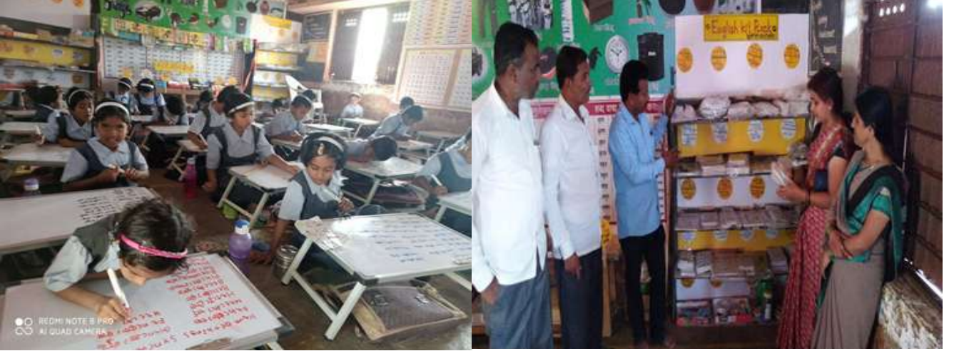
लिहूआनंदे गुणवत्ता उपक्रम

लिहू आनंदे :- या उपक्रमात इयत्ता पहिलीच्या वर्गात लेखनाची गोडी लागण्यासाठी “स्टडी टेबल” चा प्रभावी उपयोग केल्याने दुपारच्या सुट्टीत अन्य मोकळ्या वेळेत विद्यार्थी लिहू लागल्याने हस्ताक्षर व लेखन गती सुधारण्याचे जाणवले. इयत्ता पहिलीच्या वर्गातील विद्यार्थी 100% लेखनाचा आनंद घेऊ लागले.