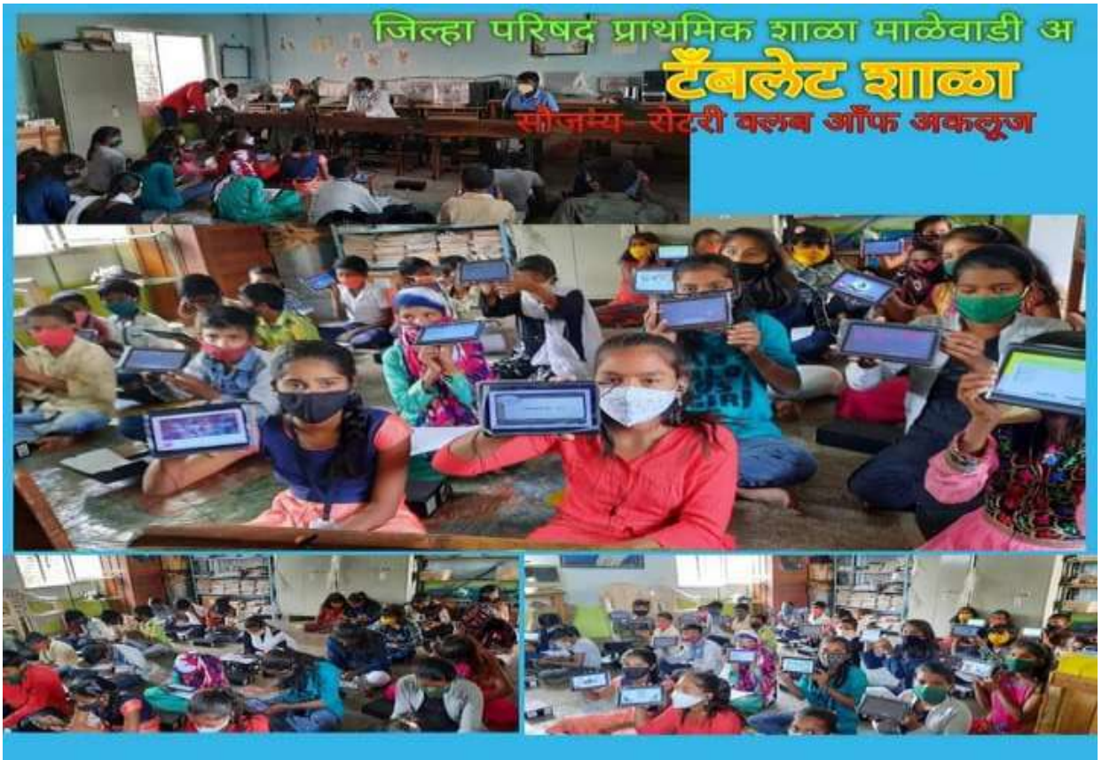
टॅबच्या सहाय्याने विद्यार्थी अध्ययन करतांना

तंत्रज्ञानाचा वापर :- शालेय कामकाजात तंत्रज्ञानाचा वापर करून अध्ययन अध्यापन प्रक्रिया सुलभ व परिणामकारक केल्या जाते. संगणक कक्ष, इ-लर्निंग साठी प्रोजेक्टर, प्रत्येक विद्यार्थ्यांसाठी टॅब सुविधा असणारी डिजिटल शाळा म्हणून आमची शाळा ओळखली जाते. युट्यूबच्या माध्यमातून विविध प्रकारचे समाजप्रबोधन, श्यामची आई कथामाला असे संस्कारक्षम उपक्रम घेण्यात येतात. इ-लर्निंगचा नियमितपणे अध्यापनात वापर करणारे सर्व तंत्रज्ञेही शिक्षक आहेत. विद्यार्थी शिक्षक व्हाॅट्सअप ग्रुप आहेत त्यामुळे कोवीड सारख्या परिस्थिती मध्ये सुद्धा या डिजिटल माध्यमातून आपले काम चालू ठेवले आहे. विद्यार्थ्यांसाठी विविध ऑनलाईन उपक्रम सुरु करून मुलांना शिक्षण देत रहावे व मुले आपल्या शाळेपासून दुरापास्त होणार नाहीत हाच उद्देश ठेवून उपक्रमाला सुरुवात झाली. विद्यार्थी व शिक्षक व्हाॅट्सअप ग्रुप, साधे फोन असणाऱ्या विद्यार्थ्यांना मेसेज योजना व ऑफलाईन विद्यार्थ्यांना पीडीएफ वितरण करण्याचे नियोजन केले. वरील सर्व उपक्रमा बरोबरच शाळेतील सर्व विद्यार्थी लर्निंग फ्रॉम होम या उपक्रमात ही आवडीने सहभागी होतात. ऑनलाईन चाचण्या सोडवतात. विज्ञान विषयावर आधारित अभ्यासक्रमानुसार व्हिडिओ यु-ट्युब च्या माध्यमातून विद्यार्थ्यांना पुरविले जातात. झुम अँप व गुगल मीट अँपच्या माध्यमातून नियमितपणे वर्ग अध्यापन केले जाते.