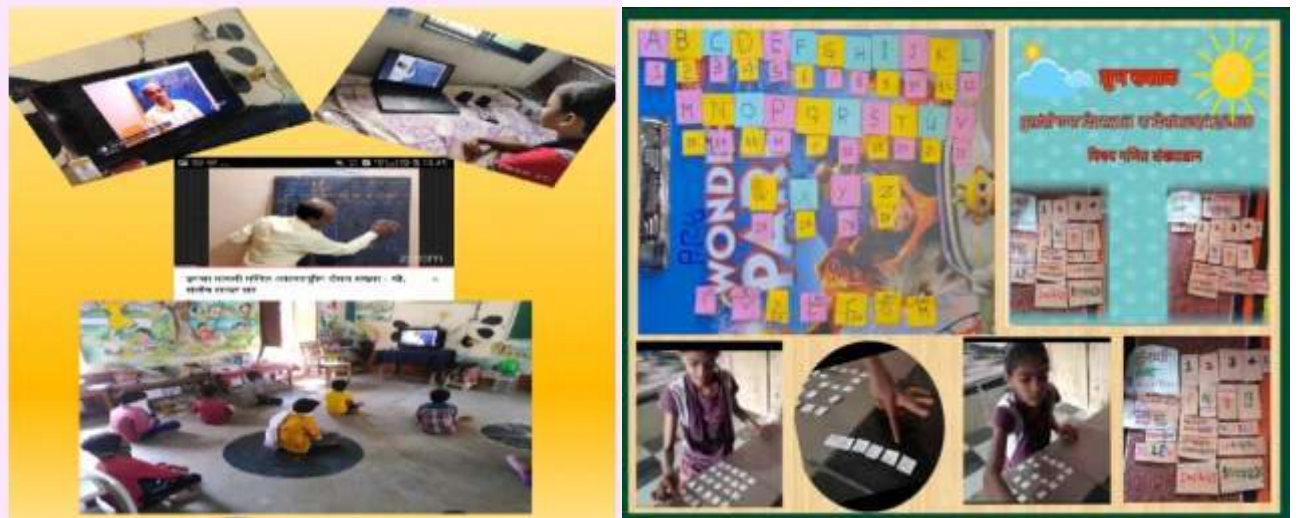
शैक्षणिक कामकाजात तंत्रज्ञानाचा वापर

प्रशासकीय कामात तंत्रज्ञानाचा वापर :- सुट्टीचा सदुपयोग घेत आम्ही शाळेतील सन 1969 च्या पटसंख्येपासून आजपर्यंतच्या सर्व प्रवेश निर्गम नोंदी संगणकात Save केल्या आहेत, ज्यामुळे ग्रामस्थांना प्रवेश निर्गम, TC देणे सोपे होणार आहे. तसेच सर्व सांख्यिकीय अहवालाची नोंद जतन करून ठेवण्यास सोपे झाले आहे. Google Form च्या मदतीने माहितीचे संकलन असेल, किंवा जिल्हा परिषद नांदेडचा प्रज्ञाशोध 2021 हा उपक्रम असेल ज्यामध्ये विविध विषयांच्या चाचणी प्रश्नपत्रिका जिल्ह्यातील 5 वी व 8 वीतील सर्व विद्यार्थ्यांना दररोज सकाळी नियमितपणे पाठवल्या जातात.