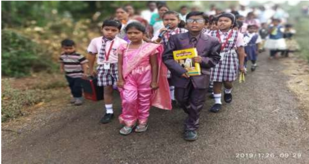
शाळेतील विद्यार्थी सामाजिक उपक्रमात सहभागी

स्व-विकासासाठीचे प्रयत्न:- आम्ही झाडगाव जिल्हा परिषद शाळेला मुख्याध्यापक समवेत दोघेच शिक्षक आहोत. त्यात आम्ही असा विचार केला की, प्रगती साधायची असेल तर त्या साठी स्वतःचे ज्ञान वाढविणे गरजेचे आहे. असे ज्ञान वाढवित राहणे म्हणजेच स्वः विकास साधणे होय. त्यासाठी एक संधी चालून आली ती म्हणजे सन २०१८-१९ मध्ये RAA औरंगाबाद तर्फे आमच्या एका शिक्षकाची Tag Co-ordinator पदी नियुक्ती झाली त्यामुळे त्यांना औरंगाबाद द्वारे वर्षभरात विविध प्रशिक्षणाला उपस्थित राहता आले. त्यानंतर Tag Group ला मार्गदर्शक म्हणून ते काम करू लागले. ह्यामुळे आम्हा दोघांचाही स्वःविकास होण्यास मदत होवून आम्हास नविन संकल्पना अवगत झाल्या. त्याचा शालेय विद्यार्थी विकासावर सकारात्मक परिणाम जाणवला. स्वःविकासासाठी निष्ठा प्रशिक्षण हे उत्तम साधन ठरले अतिशय प्रभावी व परिणामकारक रितीने चालणारी ही निरंतर प्रक्रीया आहे.