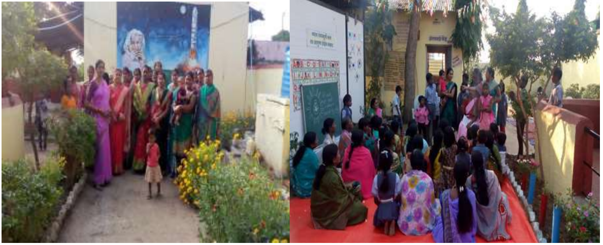
माता पालक संघ सभा

शाळा विकासात गावाचा सहभाग :- शाळा विकासात शाळा व्यवस्थापन समिती, माता पालक संघ, शिक्षक-पालक संघ व गावकरी यांची खूप मोठी भूमिका आहे. लोकवर्गणी गोळा करणे, विविध उपक्रमाचे आयोजन करणे, सांस्कृतिक कार्यक्रम, वृक्षारोपण, ग्रामस्वच्छता, आठवडी बाजार इत्यादी करिता शाळा व समाज एकरूप होऊन काम केले. त्यामुळे शाळा नावारूपाला आली, काम करताना शिक्षकांना उत्साह मिळाला. यात महिलांची भूमिका फार मोलाची ठरली.