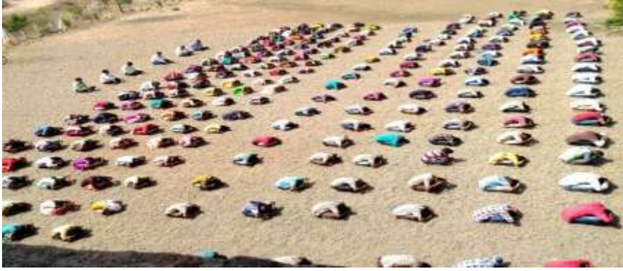
विद्यार्थी योगा करताना

शालेय उपक्रम:- ज्यामध्ये शैक्षणिक कंटेंट असलेली कॉम्पॅक्ट डिस्क, डीव्हीडी तसेच यूएसबी पेन ड्राईव्ह उपलब्ध करून देण्यात आले. इंटरनेट देखील शाळेमध्ये उपलब्ध असल्यामुळे विद्यार्थ्यांना अभ्यासासाठी पूरक असलेली माहिती मिळू लागली. त्यामुळे त्यांच्यामध्ये रुची निर्माण झाली. शाळेमध्ये विविध सांस्कृतिक कार्यक्रमांचे आयोजन आम्ही करत असतो. त्यातून विद्यार्थ्यांच्या कलागुणांना वाव देऊन ते शोधण्याचा प्रयत्न देखील शाळेतून केला जातो. सोबतच विद्यार्थ्यांचा शारीरिक विकास व्हावा यासाठी शाळेमध्ये विविध स्पर्धा देखील आयोजित केल्या जातात मग त्यामध्ये मैदानी खेळ असेल फुटबॉल, हॉलीबॉल, खो-खो, धावणे या प्रकारच्या स्पर्धांचे देखील आयोजन केले जाते. यासोबतच चित्रकला स्पर्धा रांगोळी स्पर्धा देखील आयोजित केल्या जातात. विविध प्रकारची माहिती मिळण्याच्या दृष्टीने प्रदर्शन देखील आयोजित केले जाते. शाळेतील विद्यार्थ्यांच्या गुणवत्तेत झालेला बदल दर शनिवारी विद्यार्थ्यांना योगाचे प्रशिक्षण दिले जाते त्यामुळे विद्यार्थी शारीरिक दृष्ट्या बलवान करण्यासाठी प्रयत्न केला जातो.