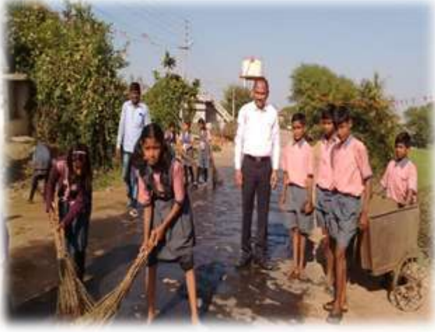
स्वच्छता अभियानात सहभागी विद्यार्थी