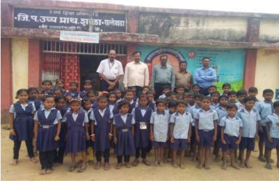
जि.प.प्रा.शाळा, छल्लेवाडा, शाळेची इमारत