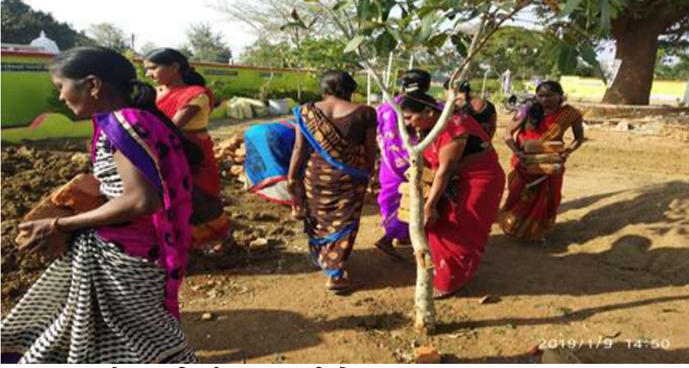
शाळेच्या परिवर्तनात सहभागी होऊन माता पालक श्रमदान करताना

स्व-विकासासाठीचे प्रयत्न:- आम्ही झाडगाव जिल्हा परिषद शाळेला मुख्याध्यापक समवेत दोघेच शिक्षक आहोत. त्यात आम्ही असा विचार केला की, प्रगती साधायची असेल तर त्या साठी स्वतःचे ज्ञान वाढविणे गरजेचे आहे. असे ज्ञान वाढवित राहणे म्हणजेच स्वः विकास साधणे होय. त्यासाठी एक संधी चालून आली ती म्हणजे सन २०१८-१९ मध्ये RAA औरंगाबाद तर्फे आमच्या एका शिक्षकाची Tag Co-ordinator पदी नियुक्ती झाली त्यामुळे त्यांना औरंगाबाद द्वारे वर्षभरात विविध प्रशिक्षणाला उपस्थित राहता आले. त्यानंतर Tag Group ला मार्गदर्शक म्हणून ते काम करू लागले. ह्यामुळे आम्हा दोघांचाही स्वःविकास होण्यास मदत होवून आम्हास नविन संकल्पना अवगत झाल्या. त्याचा शालेय विद्यार्थी विकासावर सकारात्मक परिणाम जाणवला. स्वःविकासासाठी निष्ठा प्रशिक्षण हे उत्तम साधन ठरले अतिशय प्रभावी व परिणामकारक रितीने चालणारी ही निरंतर प्रक्रीया आहे.