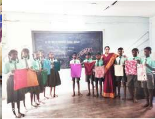
कापडी पिशव्या तयार करतांना

महाराष्ट्र शैक्षणिक व नियोजन व प्रशासन संस्था (मिपा) औरंगाबाद आयोजित शालेय नेतृत्व विकास अंतर्गत या विद्यालयात विविध उपक्रमांचे लोकसहभागातून आयोजन करून विद्यालयात सकारात्मक व शाश्वत असे बदल झाले असून शालेय गुणवत्ता विकासास मदत झाली.