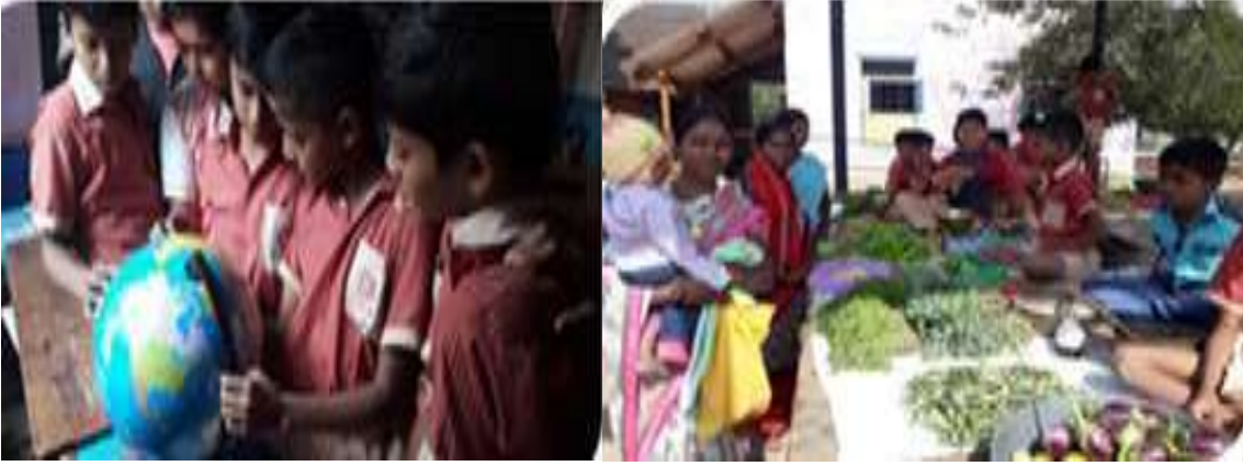
विद्यार्थी ज्ञानरचनावादी पद्धतीने स्वयंअध्ययन करताना

अध्ययन निष्पत्ती :- अध्ययन निष्पत्तीचे प्रशिक्षण झाल्यानंतर सर्व शिक्षकांनी याचा चांगला अभ्यास करून ज्ञानरचनावादी अध्यापन पद्धती अवलंबली. आणि विद्यार्थ्यांमध्ये अपेक्षित वर्तनबदल झाला.