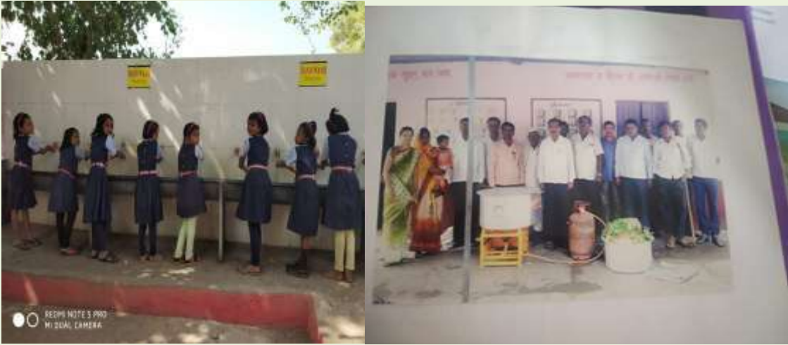
लोकवर्गणीतून हॅडवॉश स्टेशन बांधले व धुर विरहित गॅस शेगडी पालकांनी भेट दिली

लोक सहभाग :- लोकवर्गणीतून चाररूम बांधल्या. शाळा व्यवस्थापन समिति, पालक संघ, यांनी 4 रूम बांधून दिल्या व बसण्याची आडचण सोडवली. धुर विरहित शालेय पोषण आहारासाठी गॅस शेगडी दिली. लोकवर्गणीतून मुला-मुलीसाठी स्वतंत्र स्वच्छतागृह बांधले. सर्व मुलासाठी हॅडवॉश बांधले. स्पर्धा परीक्षेस पालकांनी बक्षिसे ठेवली,शाळेत मुलांना खेळण्या साठी 5 एकर ग्राऊंड निर्माण करून दिले. फिल्टर पाणी,बोअर,मोटार नळजोडणी करून दिली. परिपाठ साठी ग्रीन शेड निर्मिती, रात्रीची अभ्यासिका चालवणे ,विद्यार्थी गट ,निर्माण केले त्यावर शालेय, व्यवस्थापन समिति सदस्य नेमले,सर्व वर्गात फॅन,लाइट,प्रोजेक्टर टीव्ही बसवले.