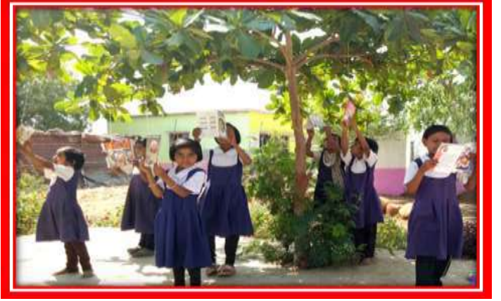
पुस्तक वाचनाचा आनंद

तंत्रज्ञानाचा वापर:- सध्याचे युग हे संगणकाचे युग म्हणून ओळखले जाते. संगणकाचा वापर दैनंदिन जीवनात पदोपदी होत आहे. प्राथमिक शाळा वसई येथे संगणकाची लॅब आहे. संगणक लॅब मध्ये पाच संगणक उपलब्ध आहेत. विद्यार्थ्यांच्या शैक्षणिक प्रगतीकरिता संगणकाचा वापर शाळेमार्फत केला जातो. विद्यार्थ्यांकडून स्कॉलरशिप, नवोदय विद्यालय, व MTS मंथन या परीक्षांचा सराव घेतल्या जातो. हे विषय शिकविण्यासाठी संगणकाचा वापर शाळेत प्रभावीपणे केला जातो. संगणक हे दृक्श्राव्य माध्यम असल्यामुळे विद्यार्थ्यांच्या मनावर ज्ञान प्रभावीपणे ठसविले जाते. प्रशासकीय कामकाजात सुद्धा संगणकाचा वापर केला जातो.