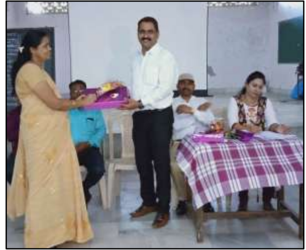
CHES Symposium organised by English Dept. RAA Mumbai ELCRM Mumbai District Training ( RAA Mumbai )

Career guidance and counselling: - In a role of a State-counsellor. It helps us to overcome the challenges of the students in night school and junior college. We have taken 10 online sessions of renowned people working in various areas in National and International institutions these sessions give them the vision to choose their career. Some of our students have migrated from Mumbai to the natives as they have lost their jobs. Our motivation and positive thoughts gave them the strength to cope up with the stress. Till now we have given the information about 150 careers on Whats app status. It is very helpful for them. Students feel free to share their views and Ideas well as challenges. During the pandemic, 425 counsellors in Maharashtra have done Tele counselling for near about 2 lakh students in Maharashtra.