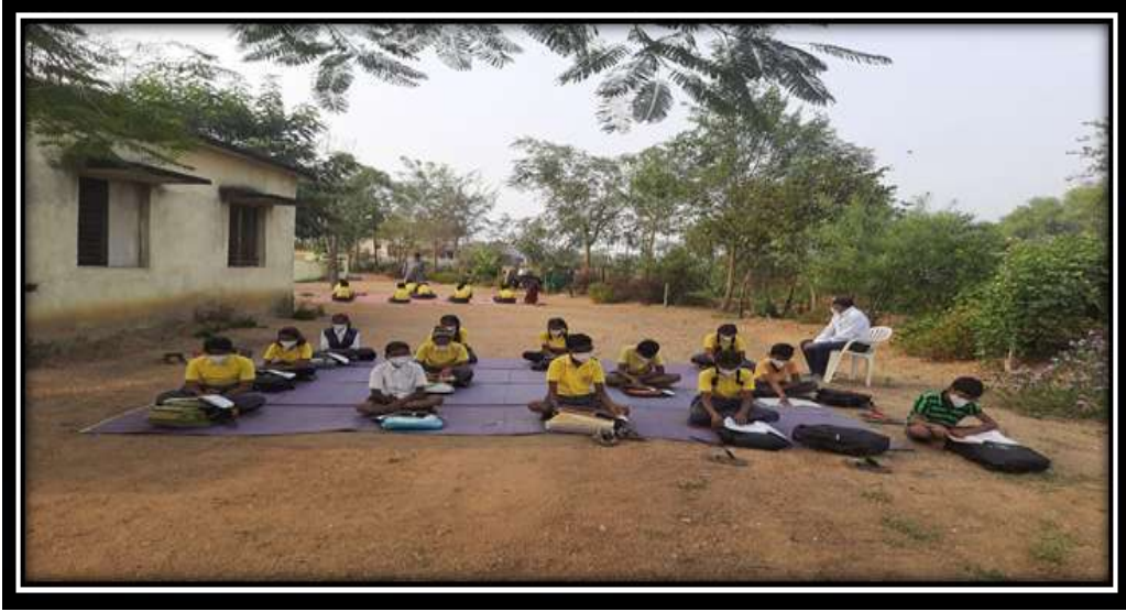
मोकळ्या मैदानात OFFLINE शिक्षण घेताना विद्यार्थी

तंत्रज्ञानाचा वापर:- शाळेत संगणकाचा व प्रोजेक्टर चा अध्यापनात वापर केल्यामुळे त्यांच्या अमूर्त कल्पना मूर्त करण्यात आल्या. प्रत्यक्ष ऑडिओ विज्युअल अध्यापन झाले. इतिहास, भूगोल, विज्ञान, गणित, विषय अभ्यासक्रम डाउनलोड करून त्यांच्या फाईल प्रोजेक्टर वर दाखवल्यामुळे आनंददायी व चिरकाल टिकणारे ज्ञान प्राप्त करून वातावरण निर्मिती झाली. कोरोना काळात विद्यार्थ्यांचे WHATSAPP ग्रूप करून विद्यार्थ्यांना अभ्यास पाठवून विद्यार्थ्यांचे अभ्यासात खंड पडू दिला नाही. SCERT पुणे मार्फत स्वाध्यायमाला विद्यार्थांकडून सोडवून घेण्यात येत आहे. शनिवार ची गोष्ट विद्यार्थ्यांना नियमितपणे ऐकविण्यात येत आहे. READ TO ME APP आणि DIKSHA APP च्या माध्यमातून विद्यार्थी शिकत आहेत. शाळेला डिजिटल बनवले आहे. शाळा बंद पण शिक्षण सुरु यानुसार ज्यांचेकडे ANDROID मोबाईल नव्हते त्यांना कोरोना चे नियम पाळून मोकळ्या मैदानात OFFLINE शिक्षण देण्यात आले.