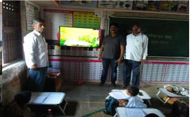
डिजिटल वर्ग LED TV देणगीदार