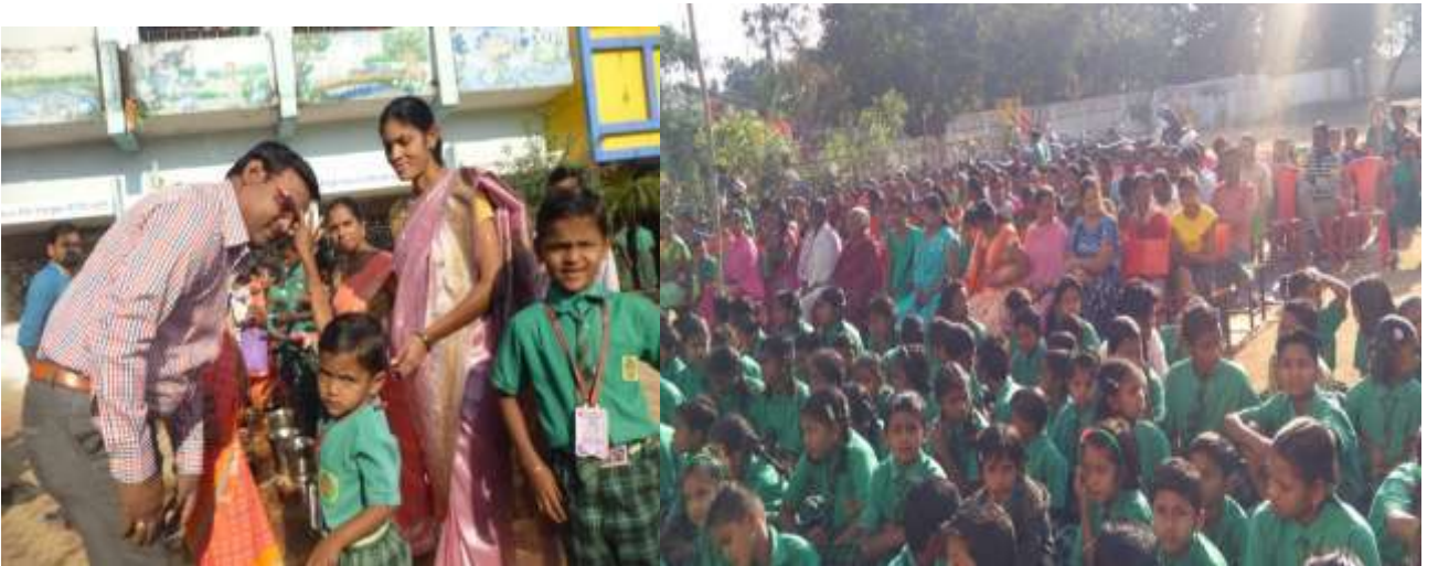
शालेय उपक्रमात सहभागी विद्यार्थी व पालक

शाळेमध्ये राबविले जाणारे विविध उपक्रम:- शाळेच्या विकासात शालेय उपक्रमांचा सिंहाचा वाट असतो. हे लक्षात घेऊन शाळेत नवनवीन उपक्रम राबविण्यात येतात. ज्यात नवागतांचे स्वागत, आदर्श परिपाठ, दिनांकानुसार पाढा, कथाकथन, एक विषय देऊन त्यावर आपले मत व्यक्त करणे, सामान्य ज्ञानावर आधारीत प्रश्न, विविध स्पर्धा, स्नेहसंमेलन, शिक्षक पालक मेळावा, स्वच्छ शाळा सुंदर शाळा, क्षेत्रभेटी, मकर संक्रात निमित्त हळदीकुंकू, महिला मेळावा, बालसभा, बाल आनंद मेळावा, विज्ञान मेळावा, मीना राजू मंच, स्काऊट गाईड, मुल्यधिष्ठीत शिक्षण, शिष्यवृत्ती व नवोदय परिक्षा, NMMS परिक्षा, नवरत्न स्पर्धा, क्रीडा स्पर्धा, सांस्कृतिक स्पर्धा, बाल संस्कार शिबीर, इत्यादी सारखे विविध उपक्रम शाळेत राबविले जातात. 14 फेब्रुवारी मातृ-पितृपूजन या उपक्रमाद्वारे मुलगा आपल्या आई-वडिलांशी कसा जवळीक साधतो त्यांच्याविषयी त्यांच्या मनात काय भावना निर्माण होतात. आईवडिलांची पुजा करून त्यांना प्रणाम करून एक नवचैतन्य निर्माण होतो मुल संस्कारी बनलीत. मातीपासुन गणपती, बैल, मातीची भांडी, दिवे तयार करणे हा एक नाविण्यपूर्ण उपक्रम आहे. जेणेकरून विद्यार्थी माती घेऊन मातीपासुन अशा विविध वस्तू तयार करतात. या सर्व उपक्रमांचा फायदा विद्यार्थ्यांना भविष्यात उपयोगी ठरू शकतो.