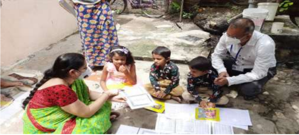
कोविड काळात विद्यार्थ्यांच्या घरी जाऊन शिक्षक शिकविताना

( https://drive.google.com/file/d/138E7660PblsRA_p6RFTJ_HdoqybKARHG/view?usp=drivesdk )