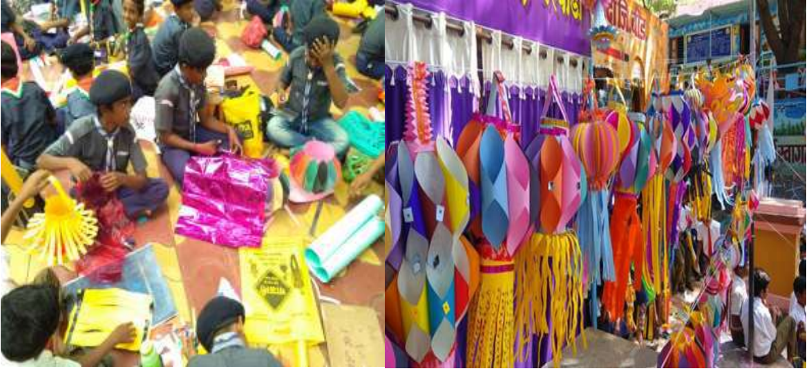
जरेवाडी शाळेतील हस्तकला प्रदर्शन

Talent Search ही साप्ताहिक परीक्षा घेतली जाते. यात एकूण 25 प्रश्नांना 50 गुण असतात. गणितातील मुलभूत संकल्पना वर्गस्तर संकल्पना, तर्क, शाब्दिक उदाहरणे, व्यवहारातील उदाहरणे अशा विविध घटकांचा समावेश यामध्ये केलेला असतो. पाठ्यांशासोबत भौमितीक रचना, वर्ग, वर्गमूळ, आलेखवाचन, पोस्ट व बँक व्यवहार, नाणी व चलन इत्यादींचा सुद्धा गणित अध्ययन-अध्यापनात समावेश केला जातो. याचा फायदा विद्यार्थ्यांना विविध स्पर्धा परिक्षांमध्ये होतो आणि त्यांचा आत्मविश्वास वाढीस लागतो. मराठवाडा मुक्तीसंग्राम दिनाच्या निमित्ताने जरेवाडी शाळेने विद्यार्थ्यांनी निर्माण केलेल्या टाकाऊ पासून टिकाऊ साहित्याचे हस्तकला प्रदर्शन भरवण्यात येते. यामध्ये नारळाच्या करवंटीपासून बनवलेली कलाकुसर, विणकाम, मातीकाम, तरंगचित्र या वस्तू प्रदर्शनात मांडण्यात आल्या. शिवाय दरवर्षी दिवाळीच्या दिवसांमध्ये, आकाश कंदील निर्मिती कार्यशाळा, भेटकार्ड निर्मिती कार्यशाळा, दिवाळीच्या फराळाचे वाटप असे उपक्रम शाळेमध्ये राबवले जातात.