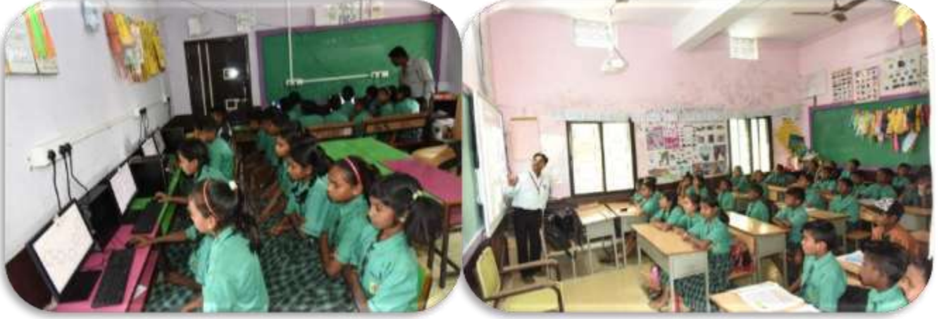
विद्यार्थी डिजिटल शिक्षणाचा लाभ घेताना

शैक्षणिक व प्रशासकीय कामकाजात तंत्रज्ञानाचा वापर :- दिक्षा ॲप द्वारे सर्व विषयांच्या संकल्पना स्पष्ट करून त्यांना गुणवत्तापूर्ण शिक्षणाच्या प्रवाहात आणले. विषयपुरक व्हिडीओ, माहिती, युट्युबच्या माध्यमातून विद्यार्थ्यांपर्यंत पोहचविण्याचे कार्य शाळेमार्फत केले जाते. प्रत्येक वर्गाचे whats up ग्रुप तयार केलेले आहेत. त्याग्रुपवर विविध शैक्षणिक लिंक्स, व्हिडीओ, याद्वारे माहिती देण्यात येते. इलर्निंगद्वारे अध्ययन अध्यापन करण्यात येते. त्यासाठी शाळेच्या वर्ग खोल्या डिजिटल करण्यात आल्या आहेत. कोरोनाच्या काळात सुद्धा शिक्षण बंद न पाडता ऑनलाईन पध्दतीने विद्यार्थ्यांच्या घरीजाऊन शिक्षण त्यांच्यापर्यंत पोहचवले जात आहे. विविध ऑनलाईन स्पर्धे मध्ये जास्तीत जास्त विद्यार्थी सहभागी होऊन शाळेचे नावलौकिक करीत आहे.