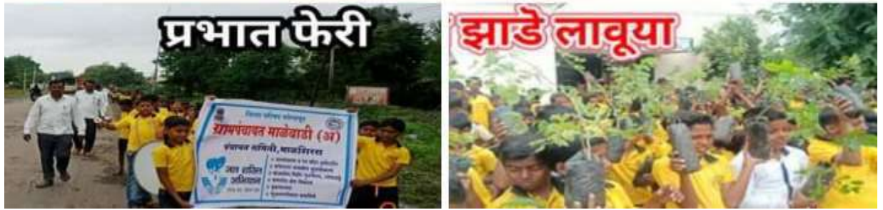
पर्यावरण जनजागृती साठी शाळेने राबविलेले विविध उपक्रम