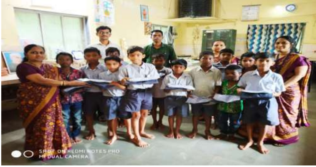
मोफत गणवेश वाटप

शाळेमध्ये मुलांना स्वच्छ व शुद्ध पाणी उपलब्ध व्हावे यासाठी प्रयत्न केले. एक्सलं कंपनीकडून कुलर व फिल्टर उपलब्ध झाले. त्यामुळे मुलांची पिण्याच्या पाण्याची सोय झाली. शाळेत स्वतंत्र प्रयोग शाळा आहे. विद्यार्थ्यांना विज्ञानातील संकल्पना प्रात्यक्षिका द्वारे शिकवल्या जातात. विद्यार्थी स्वतः प्रयोग करीत असल्याने त्यांची जिज्ञासा कुतूहल वाढते.