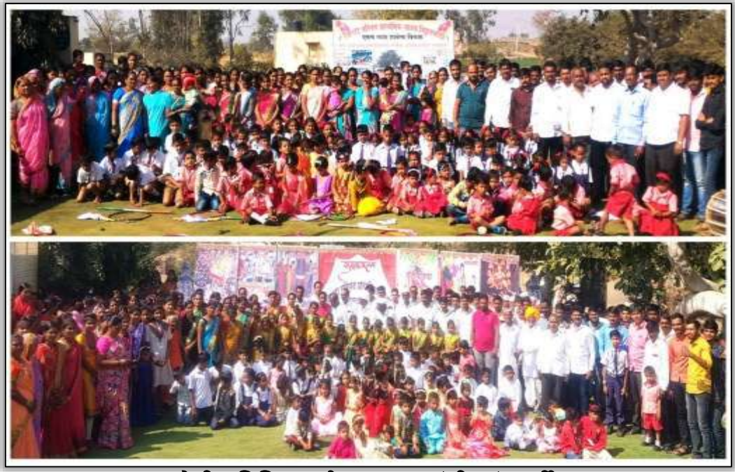
शाळेतील विविध कार्यक्रमात पालकांची तुडूंब गर्दी

लोकसहभागातून समृद्ध शाळा :- बदललेल्या सकारात्मक दृष्टीकोनातून या सर्व नागरिकांचा शाळेतील लोकसहभाग वाढवून सर्वांगसुंदर अशी समृद्ध शाळा घडली. ग्रामस्थांच्या शाळेवरील विश्वासाचा उपयोग आम्ही शाळेत विविध भौतिक सुविधा निर्माण करण्यासाठी केला. लोकसहभागातून शाळेस तसेच विद्यार्थ्यांसाठी आवश्यक असलेल्या गोष्टींची माहिती आम्ही सर्वासमोर ठेवली. त्यानुसार वाडीतील अनेकांनी रोख रक्कम तसेच आवश्यक वस्तू शाळेस दिल्या. सुमारे ७ लाख रुपयांचा निधी छोट्याशा वाडीत उभा राहिला. या रकमेतून प्रवेशद्वार, कलामंच, वॉटरफिल्टर, शाळा परिसर सुशोभीकरण, बोलक्या भिंती, प्रोजेक्टर, प्रिंटर, साउंड सिस्टीम, खेळाचे साहित्य, विविध पुस्तके, वृक्षारोपण विविध स्पर्धांसाठी साहित्य आदी भौतिक सुविधा लोकसहभागातून शाळेत निर्माण करण्यात आल्या. शाळा सर्व बाबतीत समृद्ध झाली. वाडीतील बहुसंख्य लोक हे शेतकरी आहेत. त्यामुळे “एका उजाड माळरानावर शेतकऱ्यांच्या सहकार्यातून उभी राहिलेली आदर्श शाळा ” अशी या शाळेची ओळख आम्ही सर्वांपुढे मांडली. अशा सहकार्यातून उभी राहिलेली “ स्वच्छ शाळा-सुंदर शाळा पाहून ” काही कंपन्या, संस्था, क्लबनेही शाळेस सहकार्य केले. या सहकार्यातून शाळेत बाह्य रंगरंगोटी, बालोद्यानासाठी खेळाचे साहित्य, सुसज्य शौचालय, सौर पॅनेल, हँडवॉश स्टेशन, डिजिटल क्लासरूम साठी टीव्हीसंच आदी गोष्टींची पूर्तता झाली. अशाप्रकारे मिळालेल्या मदतीतून “ समृद्ध शाळा ” उभी राहिली. पंचायत समिती दौंड याच्या वतीने आदर्श शाळा म्हणून देण्यात येणारा पहिला “ सभापती चषक ” पुरस्कार विठ्ठलवाडी शाळेस देण्यात आला .