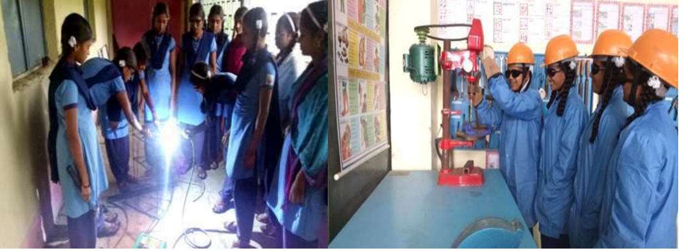
वेल्डिंग करतांना विद्यार्थिनी