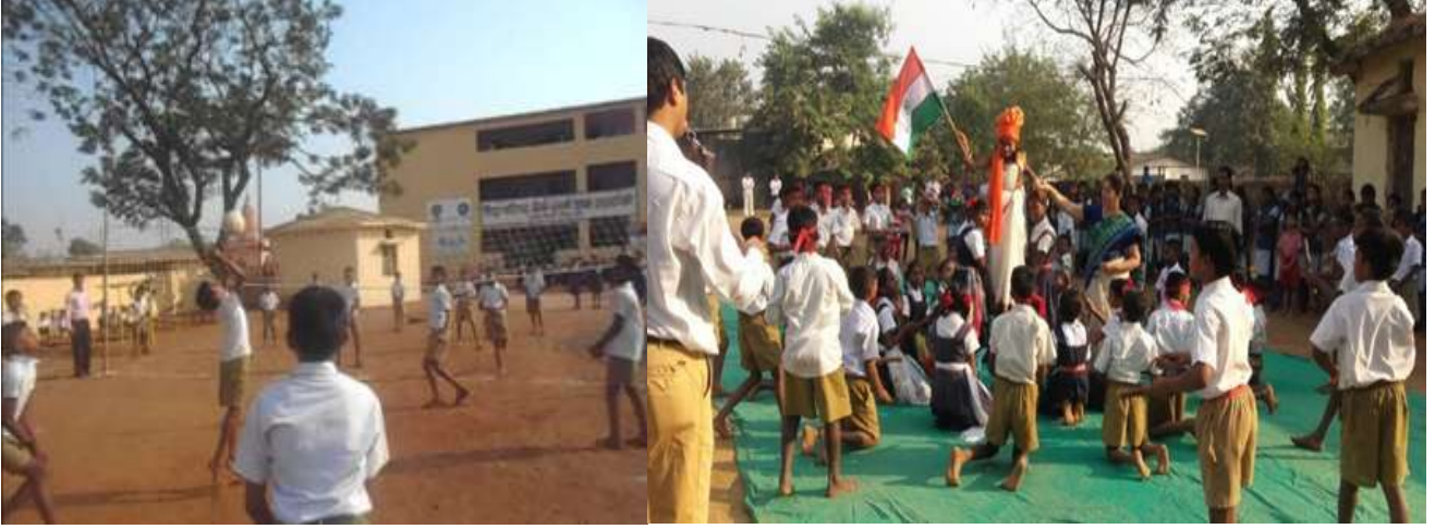
शाळेचे विद्यार्थी हॉलीबॉल खेळताना

शाळेची यशोगाथा :- शाळेतील सर्व शिक्षकांचे तंबाखू मुक्त शाळा प्रशिक्षण झाले आहे. तंबाखू मुक्त शाळेचे सर्व ११ निकष शाळेने पूर्ण केले असून रहाटोली शाळा तंबाखूमुक्त शाळा म्हणून घोषित झाली आहे. मागील २ वर्षांत तालुका तसेच जिल्हास्तरावर खालील उपक्रम तसेच स्पर्धांमध्ये यशस्वी सहभाग घेतला आहे. तालुकास्तरीय विज्ञान प्रदर्शन, तालुकास्तरीय विविध गुणदर्शन स्पर्धा यासेच वक्तृत्व स्पर्धेमध्ये प्रथम, तालुकास्तरीय समूहगान स्पर्धा सहभाग , तालुकास्तरीय क्रीडा स्पर्धांमध्ये कबड्डी, खो खो उपविजेतेपद, तालुका व जिल्हा पातळीवर कबड्डी या खेळाचे क्रीडास्पर्धेतील प्रथम ,द्वितीय क्रमांकाचे परितोषिक शाळेस प्राप्त झाले आहे