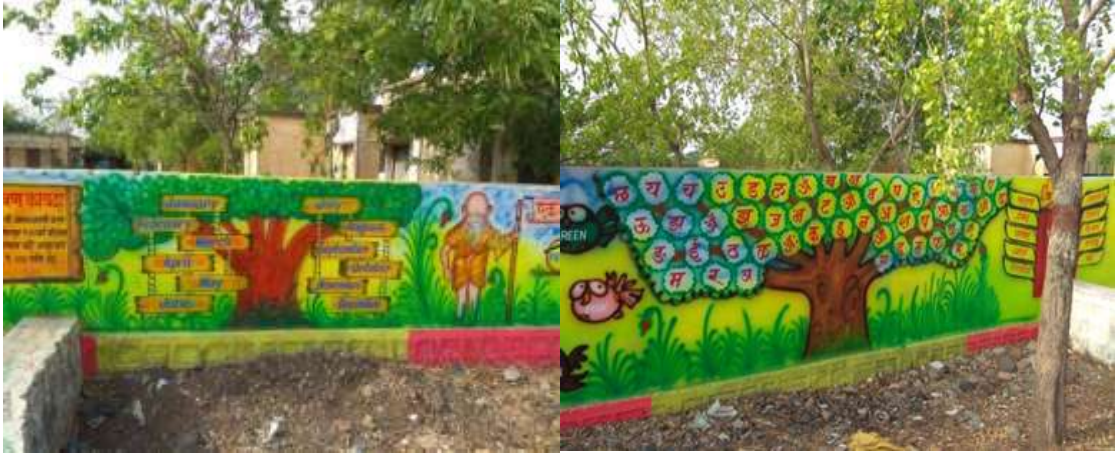
शाळेच्या बोलक्या भिंती

शाळेच्या बोलक्या भिंती :- आम्ही अध्ययन अध्यापन प्रक्रिया सुलभ , सोपी व आनंददायी होण्याच्या दृष्टीने शाळेच्या भिंती बोलक्या केल्याचं सोबत गावातील भिंतीही बोलक्या केल्या. हे काम नव्याने हाती घेतले. सर्व विषयांचे चार्ट गावातील भिंतीवर तयार करण्याचा मानस आहे. जेणेकरून संपूर्ण गाव शिक्षणाच्या प्रक्रियेत सहभागी होईल व शैक्षणिक वातावरण निर्माण होईल. मुले चालता बोलता वाचतील त्यामुळे त्यांच्यावर अभ्यासाचा ताण येणार नाही. अभ्यासाची व विषयांची मनात भीती राहणार नाही. अभ्यास आनंदाने केला तर कंटाळा येत नाही व तो कायमस्वरूपी लक्षात राहतो. हे सर्व करताना विद्यार्थी अध्ययन निष्पत्ती पर्यंत कसे पोहचतील याचे ही भान ठेवले आहे. मुलांचा चौफेर विकास व्हावा व त्यांच्या ज्ञानात वाढ व्हावी म्हणून सामान्य ज्ञानावरही भर देण्यात आला आहे.मुलांना सामान्य ज्ञानावर आधारित प्रश्नावली तयार करून पुरवण्यात आली आहे .