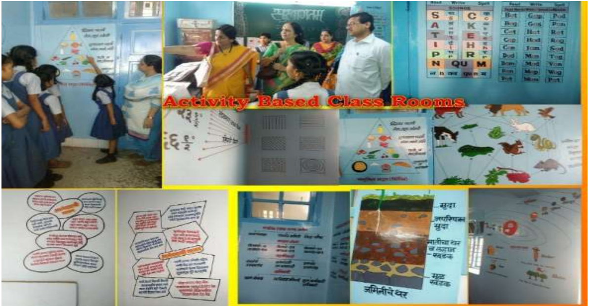
विद्यार्थ्यांसाठी तयार केलेल्या बोलक्या भिंती

अध्ययन अध्यापनातील बदल :- कृतियुक्त अध्यापन, ई लर्निंग, तंत्रज्ञानाच्या सहाय्याने अध्ययन-अध्यापन, हे सर्व तंत्रांचा वापर करून अध्ययन अध्यापनात बदल घडून आले आहेत. विविध वर्कशॉप्स उर्फ कार्यशाळा आयोजित केल्यामुळे अध्ययन सोपे आणि जवळीक साधणारे वाटले.