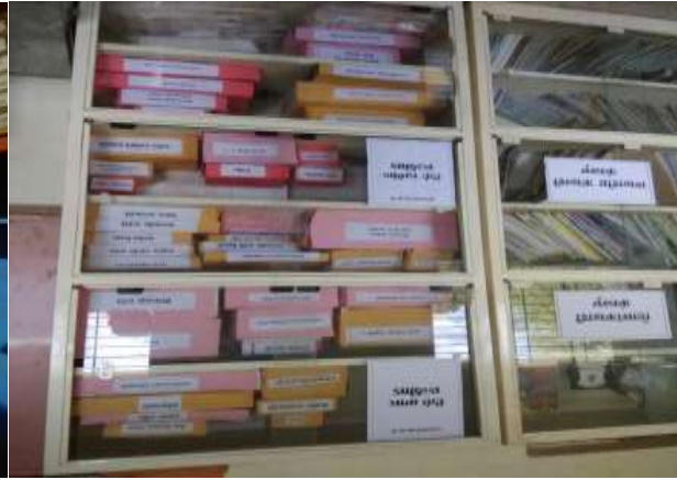
शाळेतील शैक्षणिक साहित्य

विविध उपक्रम:- शाळेत विविध नवोपक्रम राबवण्यात आले. काही उपक्रमांचा विशेषत्वाने उल्लेख करता येईल. विद्यार्थ्यांना खेळाची आवड निर्माण व्हावी म्हणून विविध क्रिडा साहित्य उपलब्ध करून ठेवले आहे. क्रिकेटचा सर्व संच, फुटबॉल, बास्केटबॉल, बॅडमिंटन, कॅरम, बुध्दीबळ, अशा प्रकारचे साहित्य वापरले जाते. दरवर्षी केंद्र , तालुका व जिल्हास्तरावर विविध क्रिडा स्पर्धाही