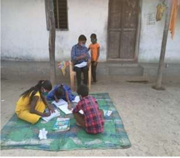
कृती पत्रिका अध्यापन