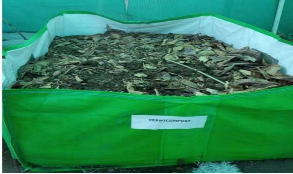
शाळेतील कचर्यापासून सॅद्रिय खत निर्मिती

सॅद्रिय खत प्रकल्प :- शालेय परिसर स्वच्छता ही दैनंदिन चालणारी प्रक्रिया आहे यामुळे शालेय परिसरातील पाने-फुले कागद कचरा गोळा करून एका खड्ड्यात टाकल्या जातो व त्यापासून सॅद्रिय खत निर्माण केले जाते या खताचा वापर शाळेतील परसबागेसाठी केला जातो.