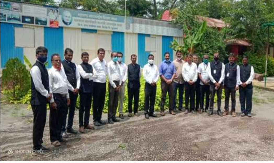
विद्यार्थ्यांच्या भविष्यासाठी सतत झटणारा शाळेतील शिक्षकवृंद

शाळेला मिळालेले सन्मान:- विदर्भातील पहिली ISO शाळा, जिल्ह्यातील पहिली आंतरराष्ट्रीय शाळा, साने गुरुजी स्वच्छ शाळा प्रथम पुरस्कार प्राप्त, वेगवेगळ्या क्रीडा प्रकारात केंद्र तालुका जिल्हा स्तरावर सहभाग नोंदवून अनेक विद्यार्थ्यांना प्राविण्य प्रमाणपत्र प्राप्त झाले आहे.