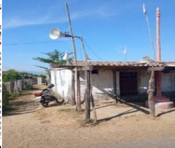
लाऊडस्पीकरवर कार्यक्रम ऐकवताना

लोकसहभाग :- मागील दोन वर्षांपुर्वी लोक सहभागातुन गावकऱ्यांनी शाळेसाठी जागा खरेदी केली. कित्येक वर्षांपासुन असलेली ईच्छा गावकऱ्यांनी खरी ठरवत शाळेसाठी स्वतःची जागा घेतली. त्याच जागेवर शाळेची इमारत उभी राहिली. त्याच ईमारतीच्या उदघाटन प्रसंगी शाळेला भेट देवुन कार्यक्रमाचे उदघाटक अध्यक्ष, जिल्हा परिषद गडचिरोली व अध्यक्ष,