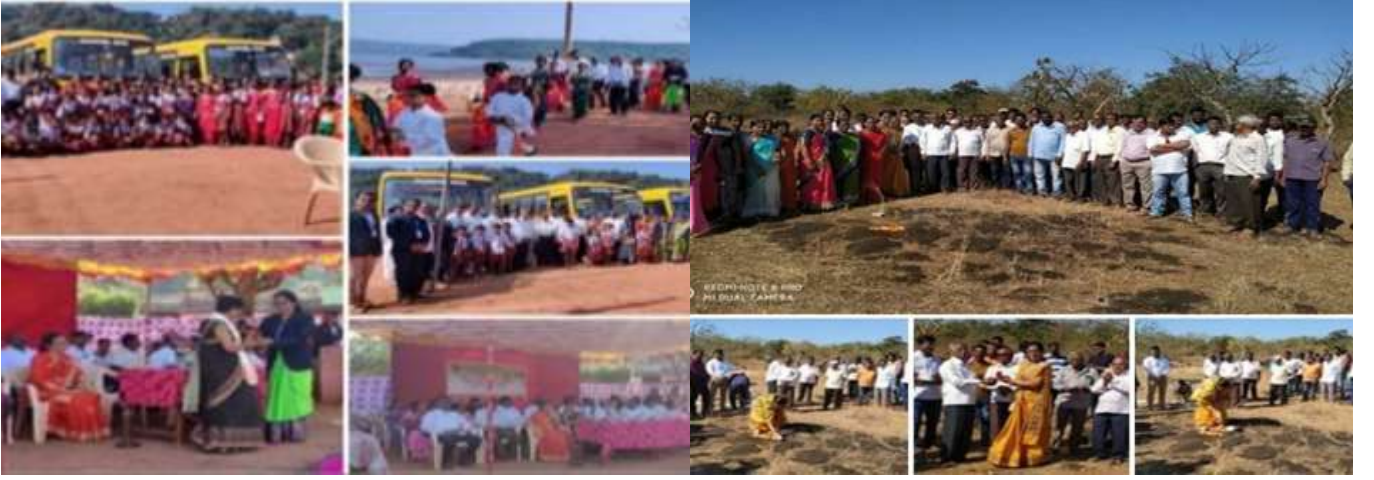
ग्रामपंचायतने दिलेल्या स्कूलबसचे उद्घाटन

लोकसहभाग :- शाळा विकासात शिक्षक पालक संघ, शाळा व्यवस्थापन समिती, पालक सहभाग तसेच निर्मल गृप ग्रंपंचायत अंजनवेल यांचे मोलाचे योगदान आहे. त्यानुसार जिल्हा परिषद रत्नागिरी यांचे कडील जिल्हा परिषद अंजनवेल नं२ (कातळवाडी) मध्ये जि.प. शाळा अंजनवेल नं.१ व जि.प. शाळा अंजनवेल नं.३ चे समायोजन करण्यात आले आहे. आंतरराष्ट्रीय शाळा मान्यता प्रस्तावामध्ये कबूल केल्याप्रमाणे निर्मल गृप ग्रामपंचायत अंजनवेल यांनी शाळेसाठी १०० गुठे जागा दिली आहे. इमारत बांधून देत आहेत. त्यातील पहिल्या टप्प्यामध्ये शालेय ९ वर्गखोल्या, मुलामुलींसाठी पुरेशी स्वच्छतागृहे, स्वयंपाकगृह, कार्यालय, Handwash station, पिण्याच्या पाण्याची व्यवस्था, लाईट, दिव्यांग विद्यार्थ्यांसाठी रॅम्प, शाळेपर्यंत रस्ता, सुरक्षित विद्यार्थी प्रवासासाठी ३ स्कूल बसेस इत्यादी भौतिक सुविधा पुरविल्या आहेत. ग्रामस्थांच्या भरीव कामगिरीमुळे आजूबाजूच्या परीसारतील विविध गावां मधून नवीन विद्यार्थी प्रवेश झाल्यामुळे सध्याची भारतरत्न अटल बिहारी वाजपेयी जि. प. आंतरराष्ट्रीय शाळा अंजनवेल नं. २ (कातळवाडी) ही प्राथमिक वर्गाची १८६ व पूर्वप्राथमिक वर्गाची १०० अशी २८६ पाटाची शाळा झाली आहे.