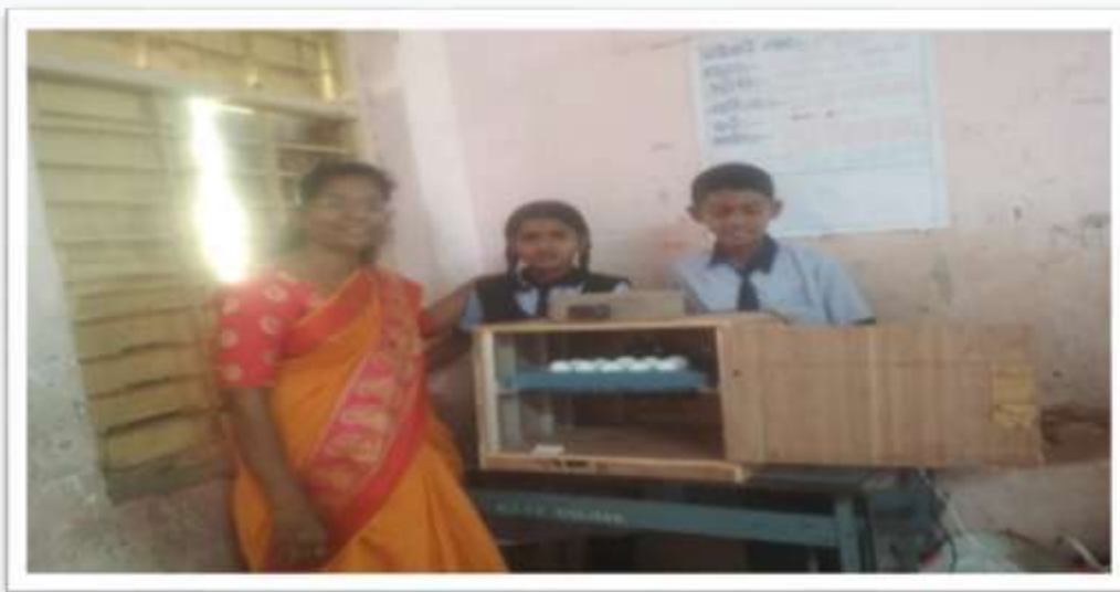
Taluka level science exhibition 1 st prize winner experiment

School Activities :- Along with all these things, various activities like making 2000 seed balls, election demonstrations, composing poems or stories from words and sentences, street plays and writing, spelling recitation, seed compilation, tree planting, reading project, accounting project are carried out in the school. Slowly the school was working towards novel ideas and development. Then we organized a science exhibition at school level and invited parents and villagers to come and give the children a chance to showcase their skills. After this, our school participated in taluka level science exhibition and won the 1 st prize.