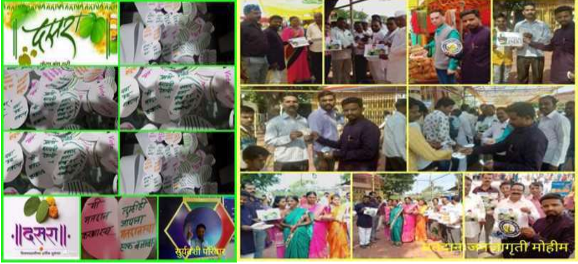
शाळेतील राबविण्यात येणाऱ्या विविध उपक्रम एका दृष्टीक्षेपात

व आकाशकंदिलाच्या प्रतिकृती बनविल्या आहेत. विद्यार्थ्यांकडून झाडाच्या पानांपासून वेगवेगळ्या कलाकृती बनवून घेतल्या जातात. पाठ्यघटकांशी संबंधित अधिकची माहितीसाठी दीक्षा app चा वापर केला जातो.