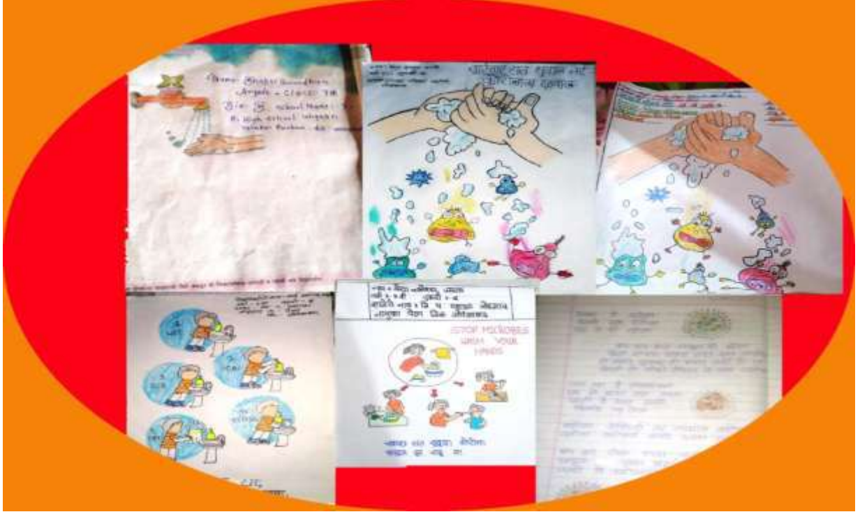
कोरोना काळात विद्यार्थ्यांनी जनजागरणासाठी तयार केलेले पोस्टर

कोव्हीड-19 उपक्रम :- कोव्हीड-19 मुळे शाळा बंद आहेत पण विद्यार्थ्यांचे शिक्षण चालू आहे. वॉट्सअप ग्रुपव्दारे झुम मिटींग तथा विविध शैक्षणिक व्हिडीओव्दारे विद्यार्थ्यांना शिक्षण प्रवाहात आणले जात आहे. कोरोनापासून सुरक्षित राहण्याचे उपाय या विषयावर इ.5 वी ते 10 वी च्या विद्यार्थ्यांची पोस्टर्स स्पर्धा, घोषवाक्य स्पर्धा, निबंध स्पर्धा आयोजित करून जनजागरण करण्यात आले. या स्पर्धांना विद्यार्थ्यांचा चांगला प्रतिसाद मिळाला.