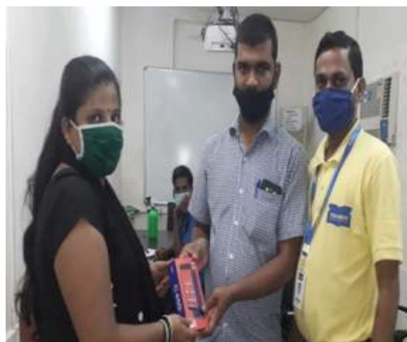
Received Notebooks from Local MLA., Distribution of Smartphone by Masoom