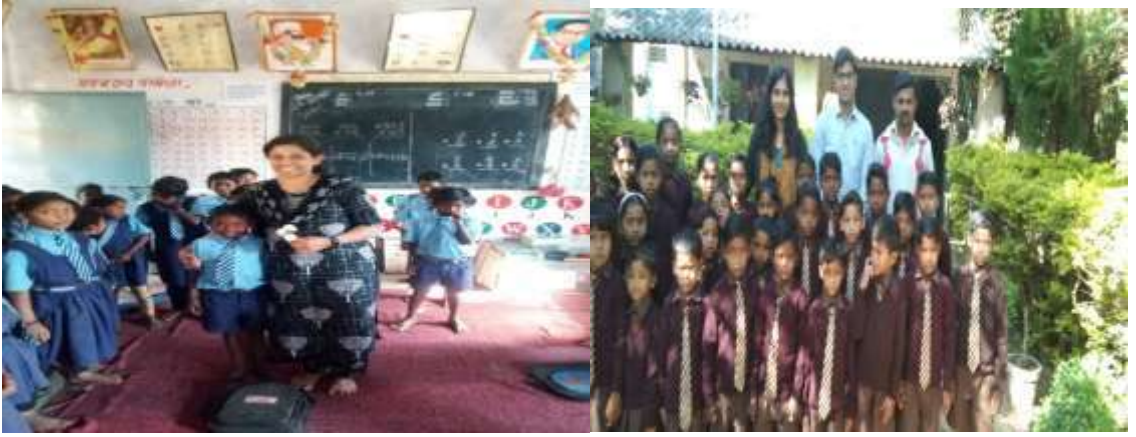
भारतीय प्रशासकीय सेवा अधिकारी यांची शाळेला भेट

यशस्विता :- सन 2018-19 मध्ये राबविण्यात आलेला 'सन्मान प्रेरणेचा व सन्मान गुणवत्तेचा' उपक्रमामध्ये तालुका स्तरावर प्रथम क्रमांकावर शाळेची निवड झाली. सन 2018-19 मध्ये सलाम मुंबई अंतर्गत तंबाखु मुक्त शाळा करण्यात तालुक्यातून प्रथम क्रमांक. सन 2018-19 मध्ये 'स्वच्छ आदत स्वच्छ भारत' कार्यक्रमांतर्गत शाळेने उल्लेखनीय कार्य केले. सन 2018-19 मध्ये शिष्यवृत्ती परीक्षेत वर्ग 5 वीतील विद्यार्थी 100% पात्र.