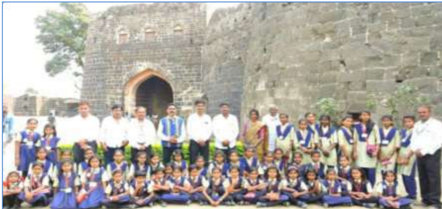
दौलताबाद किल्ला सहल

सहल व क्षेत्रभेट:- ग्रामीण भागातील विद्यार्थ्यांना ही सहल म्हणजेच आनंदाची, प्रेक्षणीय स्थळे पाहण्याची, अभ्यासाची आगळीवेगळी पर्वणीचं होती. तसेच याशिवाय शैक्षणिक सहली मुले विद्यार्थ्यांचा सर्वांगीण विकास होण्यास मदत होते. विद्यार्थ्यांना चार भिंतीबाहेरील शिक्षणमिळाले आणि त्यामुळे त्यांच्यात शिक्षणाची ओढ निर्माण झाली. शैक्षणिक सहलीमुळे विद्यार्थ्यांच्या निरिक्षण शक्तीला वाव मिळाला.