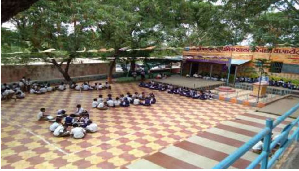
जिल्हा परिषद प्राथमिक शाळा जरेवाडीची विस्तीर्ण मैदान असलेली इमारत