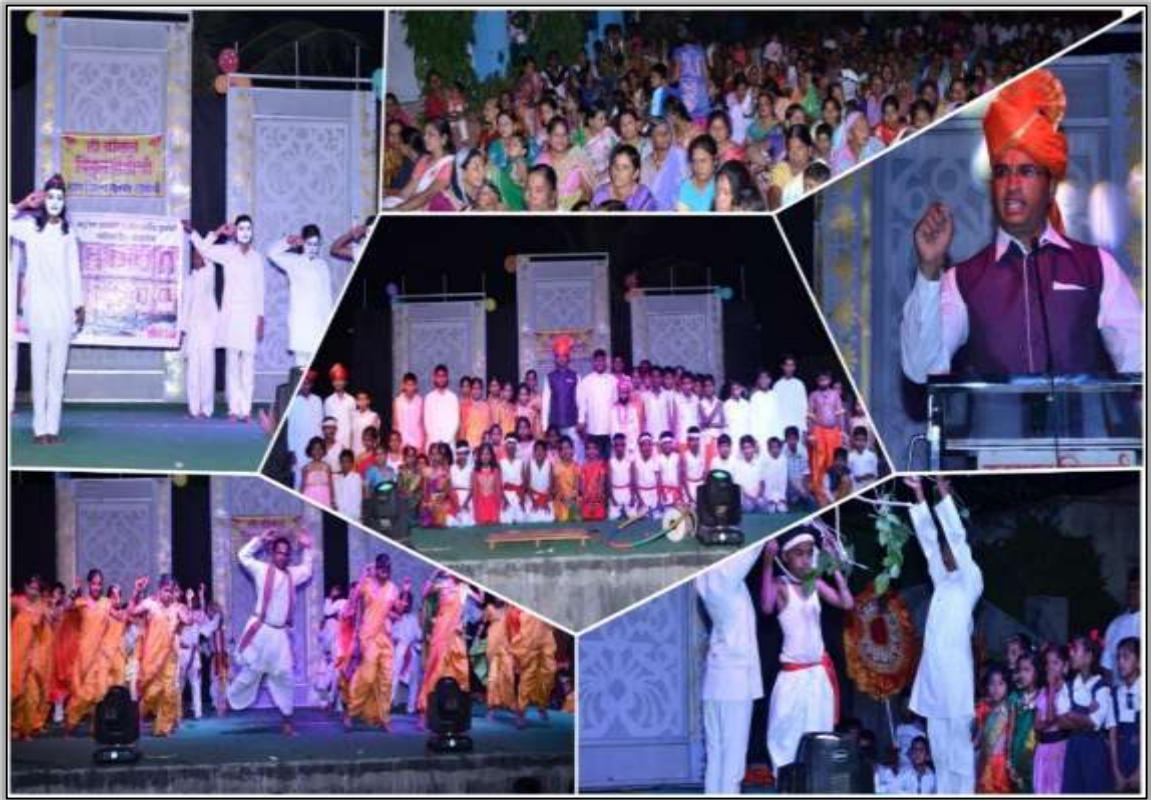
रंगारंग सांस्कृतिक कार्यक्रमात सहभागी विद्यार्थी

सांस्कृतिक कार्यक्रम :- विद्यार्थ्यांच्या कलागुणांना वाव देण्यासाठी शाळेत विविध कार्यक्रमांतून संधी देण्यात आली. नृत्य, नाट्य, गायन, वादन इ. कलागुणांसाठी शाळेत १५ ऑगस्ट, २६ जानेवारी, प्रसंगी सांस्कृतिक कार्यक्रम आयोजित केले गेले. या निमित्तानेही ग्रामस्त व पालकांचा शाळेतील सहभाग वाढला.