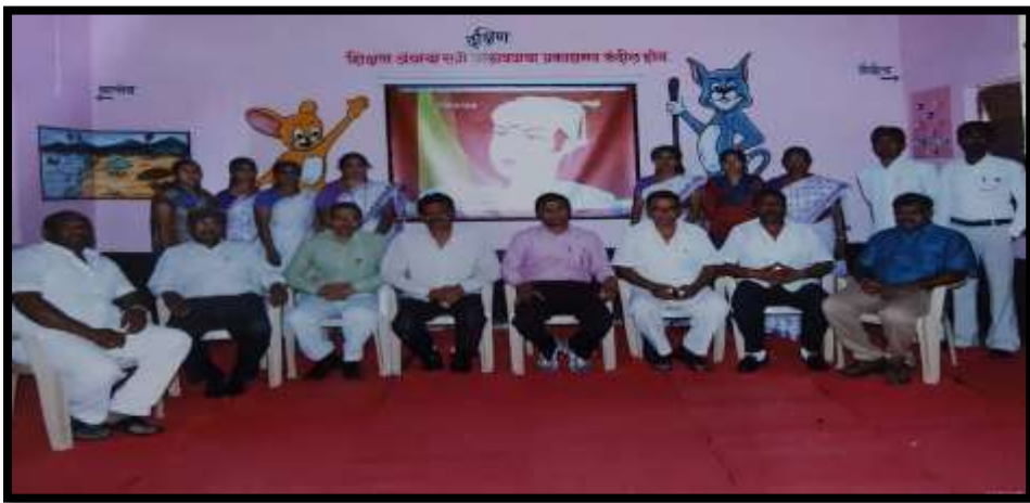
शाळा व्यवस्थापन समितीची सभा

'मोर्शी' हे गाव अमरावती जिल्ह्यातील अप्पर वर्धा नलदमयंती सरोवर असलेले orange city म्हणून प्रख्यात शहर आहे. येथे मोठ्या प्रमाणात मत्स्य व्यवसाय चालतो. येथे तीन प्रमुख नद्या असून वर्धा आणि माळू या दोन नद्या नल-दमयंती सरोवराला मिळतात. अशा या वैशिष्ट्यपूर्ण शहराच्या दक्षिणेला दुर्गानगर येथे आंतरराष्ट्रीय दर्जा मिळालेली नगर परिषद प्राथमिक मराठी शाळा क्र.4, वसलेली आहे. कमीत कमी 25 कि.मी. अंतरावरून मुले या शाळेत शिक्षणासाठी येतात. 1992 मध्ये शाळेची पटसंख्या जेमतेम बोटावर मोजण्या एवढीच होती. फारश्या भौतिक सुविधा, वर्गखोल्या पुरेशा नव्हत्या. शाळेत क्रीडांगण असून देखील त्याचा उपयोग मुलांच्या खेळण्यासाठी होत नव्हता. पिण्याच्या पाण्याची पुरेशी सुविधा नव्हती. अशावेळी वंदनीय राष्ट्रसंत तुकडोजी महाराज यांच्या ग्रामगीतेतील विचार आठविले, "गुरूजींनी ऐसे दयावे धडे । आपुला आदर्श ठेवूनी पुढे । विद्यार्थी तयार होतात चहूकडे । राष्ट्र होई तेजस्वी ।" त्यांचा हा विचार डोळ्या समोर ठेऊन आम्ही शाळेत शाळा व्यवस्थापन समिती, माता-पालक संघ, शिक्षक-पालक संघ तसेच पाल्यांच्या आजी-आजोबांना सुध्दा आमंत्रित करण्यात आले. सभेत पटसंख्या वाढविण्याच्या दृष्टीकोनातून चर्चा करण्यात आली. शाळा व्यवस्थापन समितीमधील सदस्य व आम्ही सर्व शिक्षकांनी प्रत्यक्ष घरोघरी जाऊन भेटी घेतल्या. 100% गुणवत्तेबाबत पालकांना विश्वास दिला.