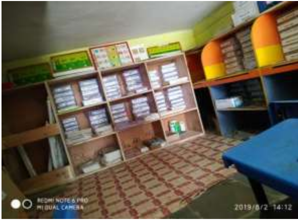
शाळेतील शैक्षणिक साहित्य

मुख्याध्यापक व शिक्षक स्वविकास:- प्रत्येक व्यक्ती हा आयुष्यभर विद्यार्थी असतो. सतत नाविन्याचा ध्यास घेऊन नवीन काही शिकण्याचा प्रयत्न करत असणे, हीचा खरी शिक्षणाची सुरुवात आहे. ह्या विचारांचा वारसा घेवून शाळेतील शिक्षक विविध प्रशिक्षणे अत्यंत जबाबदारीने घेतात. नविन तंत्रज्ञान स्वतः शिकून त्याचा अध्ययन-अध्यापनात वापर करतात. सर्व वर्ग डिजिटल असल्याने वर्गातील टिळ्ही संचावर विविध शैक्षणिक साहित्य पाहणे, व्हीडीओ लावणे, दिक्षा अॅपचा वापर करणे अशी कामे विद्यार्थीही लिलया करतात. वर्षभरात शाळेतील शिक्षक विषयानुसार विविध प्रशिक्षणे घेतात. 'गणित मुलभूत संबोध प्रशिक्षण' यामुळे इयत्ता आठवीपर्यंतच्या विविध संबोधांचे स्पष्ट आकलन झाले. निष्ठा प्रशिक्षण या प्रशिक्षणाला तर एक सर्वस्पर्शी प्रशिक्षण म्हणता येईल एवढे विविध विषय यात हाताळले गेले. अगदी प्राथमिक संबोधा पासून ते मूल्यमापना पर्यंत व विविध विषयां बरोबरच कला, क्रिडा, कार्यानुभव पर्यंत अनेक बाबींची चर्चा या प्रशिक्षणात झाली. 'मुलभूत संबोध भाषा प्रशिक्षण' या अंतर्गत मराठी तसेच इंग्रजीच्या गुणवत्ता विकासासाठी कोणते प्रयत्न करावेत यावर सविस्तर चर्चा व कृतिआराखडा तयार करण्यात आला. याशिवाय वर्षाच्या अगदी सुरवातीलाच केंद्रस्तरावर अध्ययन निष्पत्ती विषयी चर्चा करण्यासाठी कार्यशाळा घेतली जाते. पायाभूत चाचणीनंतर ज्या शाळांचा निकाल कमी आहे, त्यांच्यासाठी काय प्रयत्न करता येईल यासाठी संमेलन व सहविचार सभा घेतली जाते या सर्व प्रशिक्षणांचा निश्चितच फायदा होतो आहे. 'तंत्रस्त्रेही शिक्षक प्रशिक्षण' सध्याच्या ऑनलाईन शिक्षणाच्या काळातही या प्रशिक्षणामुळे शिकलेल्या नवीन गोष्टींचा फायदा झाला.