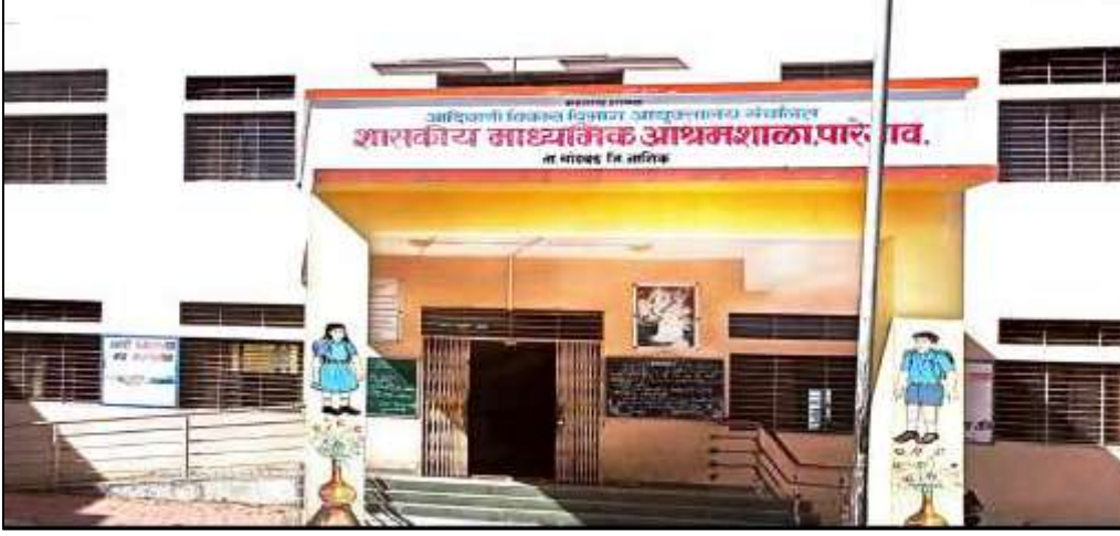
शासकीय माध्यमिक आश्रमशाळा पारेगाव- मुख्य इमारत