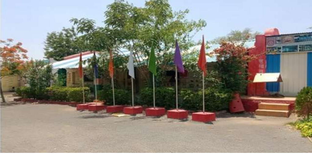
भारतरत्न अटलबिहारी वाजपेयी जिल्हा परिषद आंतरराष्ट्रीय शाळा, वरखेड शाळेचा परिसर

शैक्षणिक परिवर्तनाच्या वाटा निवडतांना :- भारतरत्न अटलबिहारी वाजपेयी जिल्हा परिषद शाळा, वरखेड, ता.चिखली, जि. बुलडाणा या शाळेची दिवसेंदिवस होत चाललेली प्रगती ही एक दिवसात घडून आलेला चमत्कार नाही तर त्यासाठी शाळेतील प्रत्येक घटकाने प्रचंड मेहनत घेतली आहे. तालुक्याच्या ठिकाणापासून १८ किलोमीटर अंतरावर वरखेड येथे ही शाळा आहे. जेथे १ ते ८ वर्ग आहेत. २०१७ पर्यंत गावातील तेवढे विद्यार्थी शाळेत येत व शिक्षण घेत होते. परंतु शाळेने विविध उपक्रम यशस्वीपणे राबवण्यास सुरुवात केली. त्यामुळे या शाळेत आजूबाजूच्या जवळपास पंचवीस गावातून विद्यार्थी येऊ लागले.