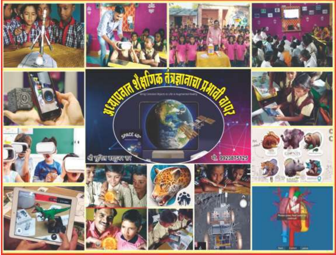
शाळेतील विद्यार्थी विविध अॅपच्या माध्यमातून शिक्षण घेताना

शैक्षणिक अॅपची शाळा- शैक्षणिक अॅप्स परिणामकारक वापर करण्यासाठी सर्वप्रथम मोबाईलचा स्व अध्ययनासाठी कसा वापर करता येतो हे पालकांना सभेमध्ये समजावून दिले. शिक्षकांच्या मदतीने उपयुक्त अॅप चे संकलन करून विद्यार्थ्यांना वर्गात सराव देणे सुरू केले. पालकांच्या मोबाईल मध्ये हे शैक्षणिक अॅप स्वतः इन्स्टॉल करून दिले. प्रत्येक अॅप चा सराव घेऊन अॅप विषयी माहिती पालकांना व्हाट्सअप ग्रुप च्या माध्यमातूनही दिली.