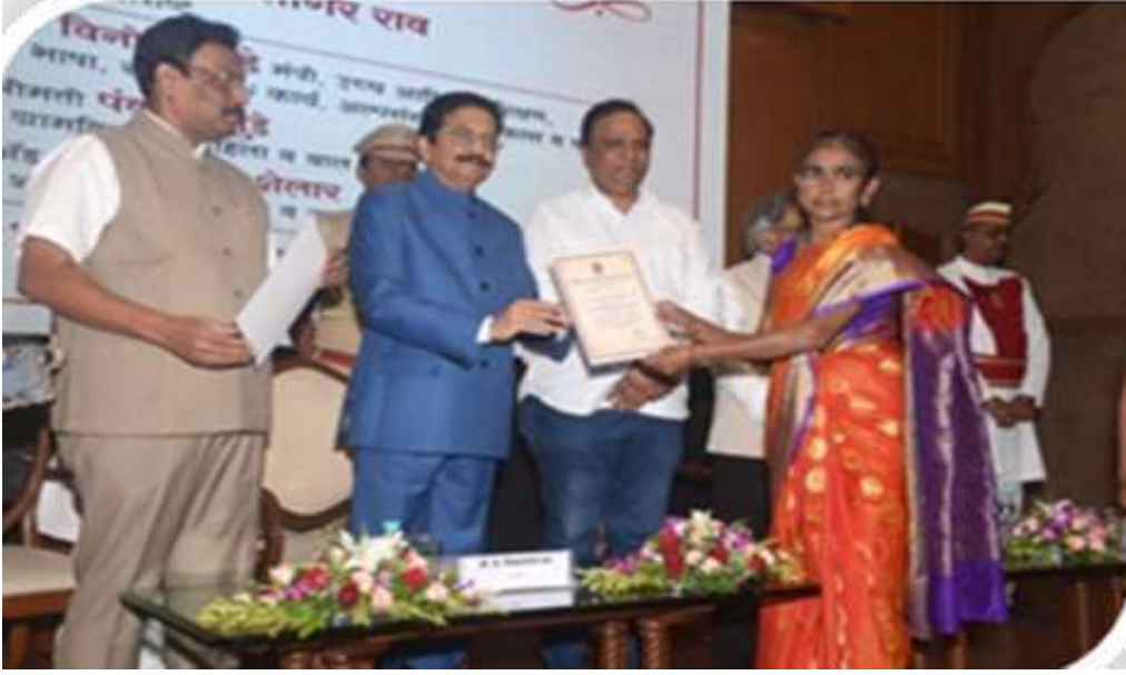
तत्कालीन राज्यपाल मा.सी.विद्यासागर राव व शिक्षणमंत्री मा.विनोद तावडे यांच्या हस्ते आंतरराष्ट्रीय शाळेचे प्रमाणपत्र स्वीकारताना

आंतरराष्ट्रीय शाळा :- तत्कालीन शिक्षणमंत्री मा. विनोदजी तावडे साहेब यांच्या संकल्पनेतून स्व. भारतरत्न अटलबिहारी वाजपेयी आंतरराष्ट्रीय शाळा प्रकल्पात शाळेची निवड करण्यात आली. या प्रकल्पात शाळांची निवड करताना उपलब्ध जागा, पटसंख्या, शालेय गुणवत्ता, लोकसहभाग, शाळासिद्धी इत्यादी निकषांचा विचार करण्यात आला.