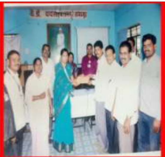
शाळेतील शिक्षक पुरस्कार स्वीकारतांना