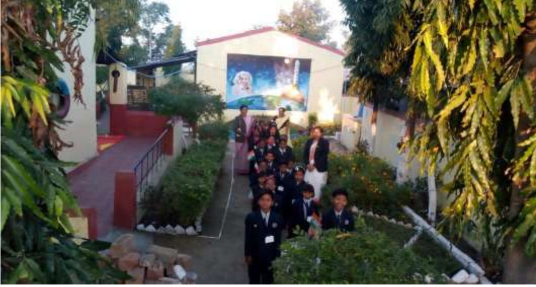
शाळेचा रमणीय परिसर

शाळेचा रमणीय परिसर शाळा: या उपक्रमांतर्गत शाळेला अतिशय सुंदर बनविण्याकरिता शाळेच्या चहुबाजूने मेहंदी ची लागवड करण्यात आली व अशोक वृक्षाची लागवड करण्यात आली. त्याचप्रमाणे शाळेत लॉन्स तयार करण्यात आले. वॉल कंपाउंडवर सुंदर चित्र काढण्यात आले. फुलांचे ताटवे तयार करण्यात आले. गावातील प्रेक्षणीय स्थळ म्हणजे शाळा हे समीकरण बनविण्यात आम्ही यशस्वी झालो.