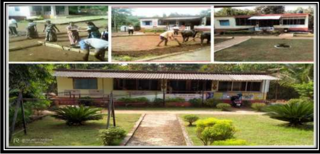
ग्रामस्थांच्या प्रयत्नातून फुललेली सुंदर बाग आणि परिसर

होता १,००,००० च्या वर निधी जमवण्याचा. या शैक्षणिक उठावातून शाळेच्या भौतिक सुविधा हळू हळू पूर्ण होत गेल्या. यातून खेळाचे साहित्य, रंगरंगोटी, फर्निचर ,परिसर विकास या गोष्टी पूर्णत्वास नेणे शक्य झाले. एक छोटीशी शाळा पटसंख्येअभावी बंद होऊ नये यासाठी प्रत्येक पालक आणि ग्रामस्थ सकारात्मक प्रयत्न करत होता. याची सुरुवात परिसर विकासाने झाली. शाळेच्या समोर ग्रामस्थांनी एक सुंदर बाग तयार केली. यामुळे शाळेच्या सौंदर्यात आणखी भर पडली.