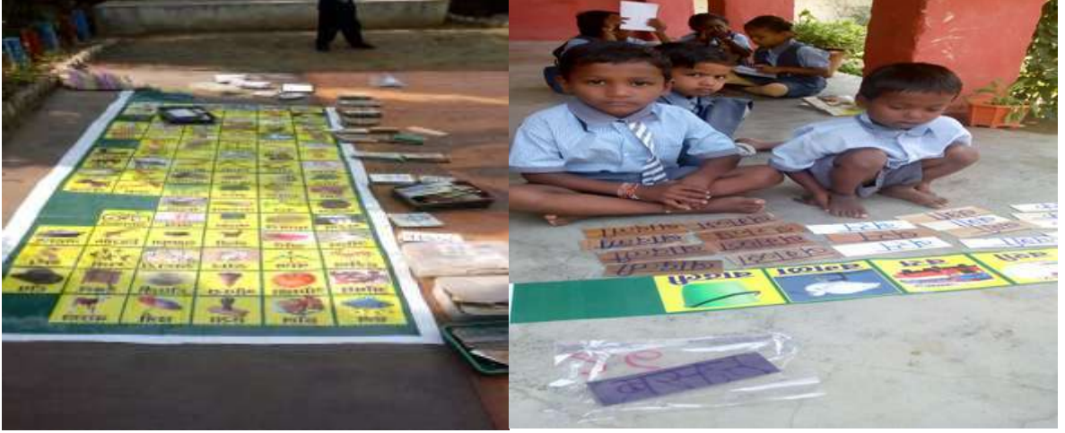
स्वयं अध्ययन करताना विद्यार्थी

शिक्षकाविना वाचन: (कोरोना काळातील शिक्षण) :- स्वयंअध्ययन, खेळ, गटकार्य, शिक्षकाची देखरेख,याकरिता 3 × 10 चे बॅनर तयार केले जाते. त्या बॅनर पासून 20 बंच तयार केले व त्या बॅनर मध्ये प्रत्येक शब्दाचे 4 याप्रमाणे 20 पट्ट्या टाकतात व त्यातील अक्षराचे 20 ते 25 अक्षर पट्ट्या टाकल्या जाते. अशाप्रकारे 20 बंच चा सराव दिला जातो. यात विद्यार्थी खूप आनंदी राहतो. या उपक्रमामुळे खडू, दसराला संपूर्णपणे सुट्टी दिली जाते. अभ्यास म्हणजे केवळ खेळ आहे. खेळातून संपूर्ण वाचन शिकण्याची प्रक्रिया पूर्ण होते. आमच्या गावात कोरोना काळात सर्व विद्यार्थ्यांच्या घरी हे बंच पोहोचविले. त्यातून विद्यार्थ्यांमध्ये वाचन क्षमता प्राप्त झाली.