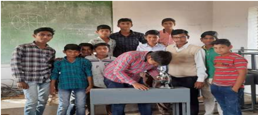
विज्ञानाचे प्रयोग करताना शाळेचे विद्यार्थी

अध्ययन अध्यापन प्रक्रिया:- अध्ययन अध्ययन प्रक्रिया सुलभ कशी करता येईल यावर विचार करण्यात आला हे करत असताना यामध्ये काही तंत्रज्ञानाचा उपयोग करता येईल का हे आजमावून पाहिले गेले. त्यासाठी शाळेमध्ये असलेल्या आय सी टी लॅबचा उपयोग केला गेला प्रोजेक्टर च्या साहाय्याने विद्यार्थ्यांना विविध अध्ययन अनुभूती देण्यात आल्या. कम्प्युटरच्या सहाय्याने तसेच प्रोजेक्टरच्या माध्यमातून ऑडिओ-व्हिड्युअल पद्धतीचा उपयोग करून चांगल्या प्रकारे विद्यार्थ्यांना समजून सांगता आले. त्याचप्रमाणे विद्यार्थ्यांचा सर्वांगीण विकास बौद्धिक, भावनिक, शारीरिक, मानसिक, सांस्कृतिक, नैतिक तसेच आध्यात्मिक विकास कसा होईल याकडे सुद्धा लक्ष दिले जाते. त्यामागील तत्त्वे तथा एखादा घटक निवडून त्याची स्लाईड तयार करून पॉवर पॉइंट प्रेझेंटेशन च्या साहाय्याने संगणकावर दाखवली जाऊ लागली. विद्यार्थ्यांना दीक्षा अॅपचा वापर करून विविध विषयातील घटक शिकवले गेले. पुस्तकातील काही बारकोड च्या माध्यमातून विद्यार्थ्यांना इंटरनेट द्वारे देखील विविध प्रकारचे ज्ञान प्राप्त होऊ लागले. मानव विकास मिशन च्या माध्यमातून विज्ञान प्रयोग शाळेचे साहित्य शाळेला मिळाले असल्यामुळे या साहित्याचा प्रयोग करण्यासाठी तसेच विद्यार्थ्यांना विविध संकल्पना प्रभावीपणे समजून सांगण्यासाठी त्याचा उपयोग केला गेला. शक्य असेल तेवढे जास्तीत जास्त ज्ञान हे प्रयोगाद्वारे दिले जाऊ लागले.