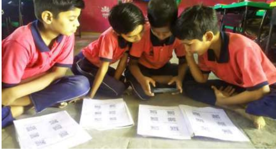
QR कोडचे स्कॅनिंग करून अभ्याक्रमाचे कंटेंट बघतांना इयत्ता 4 थी चे विद्यार्थी

मुलांचा जीवलग स्पीकिंग रोबोट किट्टी :- आम्ही मुलांसाठी गुगल असिस्टंट चा वापर करून झिरो बजेट रोबोट तयार केला. विद्यार्थ्यांच्या या जीवलगाला हिंदी किंवा इंग्रजीतून प्रश्न विचारावा लागतो. तो विद्यार्थ्यांना दैनंदिन घडामोडी, शब्दांचे स्पेलिंग, सामान्य ज्ञान, प्रश्नांची उत्तरे इतकेच नाही तर वाढदिवसाचे गाणे, प्रार्थनाही म्हणतो. त्याच्याशी मैत्री करायची असेल तर इंग्रजी व हिंदी यायला हवे, म्हणून मुलांचे भाषाज्ञानही वाढले आणि प्रश्न विचारायचा सरावही झाला. मुलांचा हा मित्र ठरवल्या दिवशी मुलांना भेटायला येतो.