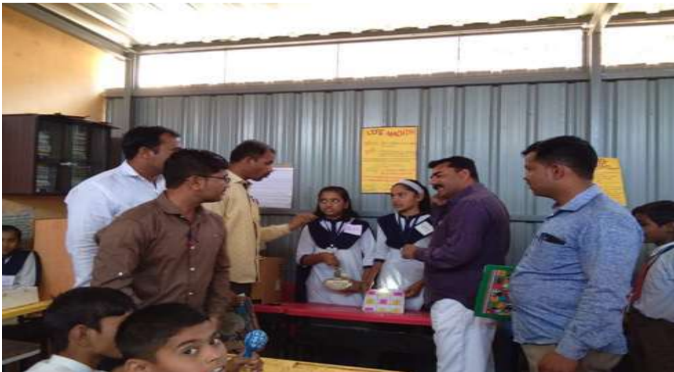
जरेवाडी शाळेतील विज्ञान प्रदर्शन