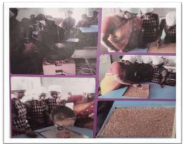
While taking a training

Self-employment: A skillful person is a self-employed person and a self-employed person can never go hungry.