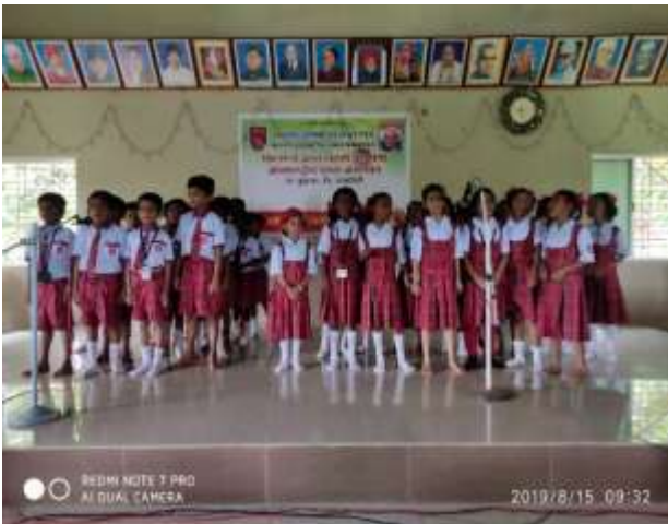
समुहगीत गायन स्पर्धा

नवोपक्रम :- मुख्याध्यापक, शिक्षक, विद्यार्थी, यांनी बालक-पालक मेळावा, बालसभा, दफतरमुक्त शाळा, उपक्रमाचा शनिवार, संगीतमय पाढे, माझे चांगले काम, मी 100% उपस्थित, कृतियुक्त संबोध स्पष्टीकरण, माझी गोष्ट, समुहगीत गायन, माझी शाळा –माझा गाव, अशा विविध नवोपक्रमांचा शाळेला शाळा विकासात फायदा झाला आहे.