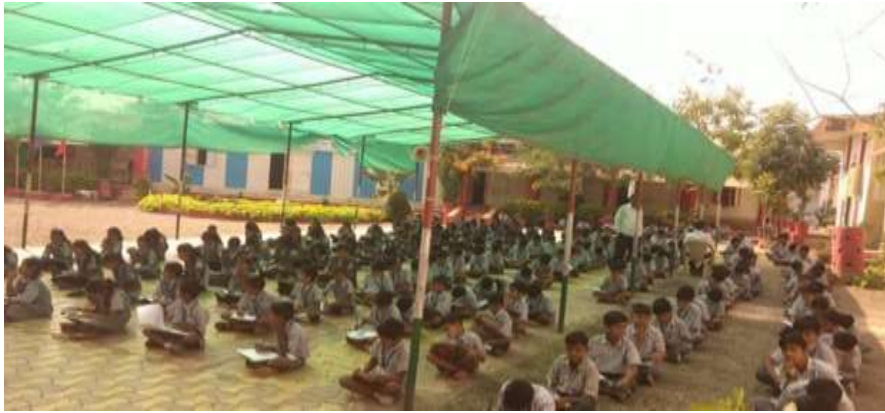
सामान्य ज्ञान चाचणी देताना विद्यार्थी

सामान्य ज्ञान:- विद्यार्थ्यांना प्रत्येक महिन्यामध्ये प्रत्येक दिवशी पाच ते दहा याप्रमाणे एकूण महिन्यात 100 ते 150 असे प्रश्न सूचना फलकावर लिहून दिल्या जातात. विद्यार्थी ते प्रश्न आपल्या वहीत लिहून घेतात. प्रत्येक दिवशी परिपाठाच्या वेळेस विद्यार्थ्यांना दहा ते पंधरा प्रश्न विचारून त्यांनी वाचलेल्या प्रश्नांची उजळणी घेतली जाते. त्यामुळे विद्यार्थ्यांना सामान्य ज्ञान या विषया अंतर्गत दिलेली माहिती चिरंतन लक्षात राहते. अशा प्रकारे चाचण्या घेणे, प्रश्न उत्तरे लिहून देणे, विडिओ दाखवणे, फोटो दाखवणे, चर्चासत्र घडवून आणणे आणि परिपाठामध्ये प्रश्नांची उजळणी घेणे या प्रकारे विद्यार्थ्यांच्या ज्ञानाच्या कक्षा रुंदावत जातात. भौगोलिक, ऐतिहासिक, वैज्ञानिक, चालू घडामोडी, थोर महापुरूष, समाजसेवक, राज्यकर्ते, संत अशा स्वरूपात सर्व ज्ञान विद्यार्थ्यांना मिळते.