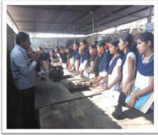
While listening carefully to guidance