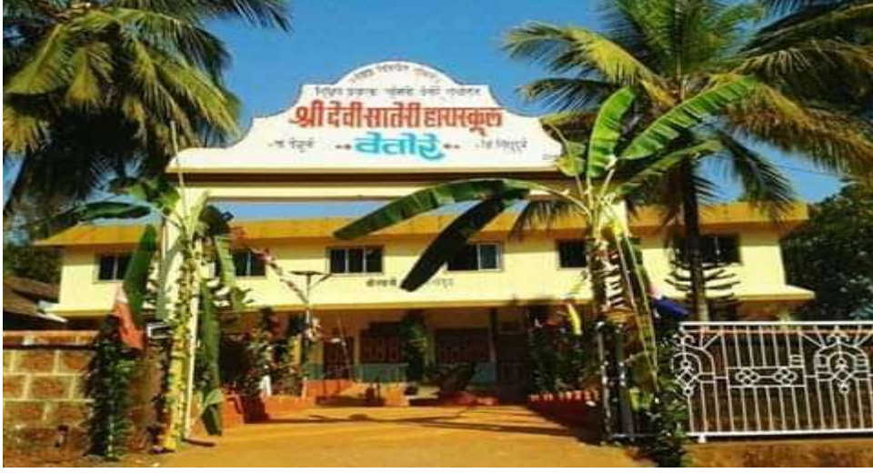
श्री देवी सातेरी हायस्कूल, वेतोरे शाळेची इमारत