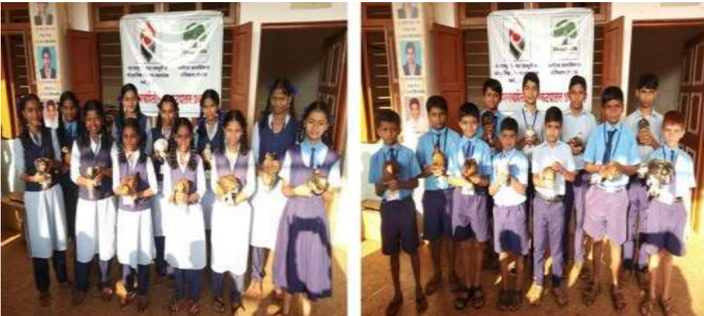
कुक्कुट प्रकल्प सहभागी विद्यार्थी

कुक्कुटपालन प्रकल्प :- ग्रामीण भागातील नुलांच्या आहारात पुरेसे प्रोटीन्स यावेत, शाळेतील मुलांना अभ्यासाबरोबर शेती पूरक उद्योगाची आवड निर्माण व्हावी आणि घरा पाठीमागील परिसराकडे पाहण्याचा त्यांचा दृष्टीकोन बदलावा या उद्देशाने प्रशालेने कुक्कुटपालन प्रकल्प हाती घेतला आहे. प्रशालेने शाळेतील मुले आणि गावातील महिलांचा दृष्टीकोन बदलण्याच्या प्रयोगावर विचार सुरु केला आणि त्यातून परसबागेतील लक्ष्मी म्हणजेच कुक्कुटपालन या अनोख्या प्रकल्पाची आखणी झाली. प्रशालेने शाळेतील मुले आणि गावातील महिलांचा दृष्टीकोन बदलण्याच्या प्रयोगावर विचार सुरु केला आणि त्यातून परसबागेतील लक्ष्मी म्हणजेच कुक्कुटपालन या अनोख्या प्रकल्पाची आखणी झाली. या प्रयोगामध्ये प्रशालेतील विद्यार्थ्यांना व गावातील बचतगटातील महिलांना कुक्कुटपालनाचे प्रशिक्षण देऊन कावेरी जातीची एक महिन्याची पाच कोंबडीची पिल्ले आणि पाच किलो खाद्य दिले. प्रत्येक विद्यार्थ्यांनी ती पिल्ले घरी नेऊन शास्त्रोक्त पद्धतीने वाढविली. त्यातून मिळणारी अंडी बाजारपेठेत विक्री केली. त्यानंतर कोंबडीची पूर्ण वाढ झाल्यानंतर बाजारपेठेत नेवून त्यांची विक्री केली. विद्यार्थ्यांना कोंबडी पालन शिकवणे हा त्यामागचा मुळीच हेतू नाही. या कोंडी पालनाच्या माध्यमातून शालेय मुलांना अभ्यासाबरोबर शेतीपूरक व्यवसायाची आवड निर्माण व्हावी, त्यांना रोजगाराचा एक नवा पर्याय मिळावा हा या मागचा प्रमुख हेतू आहे.