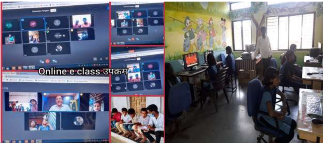
ऑनलाईन अध्ययन अध्यापन