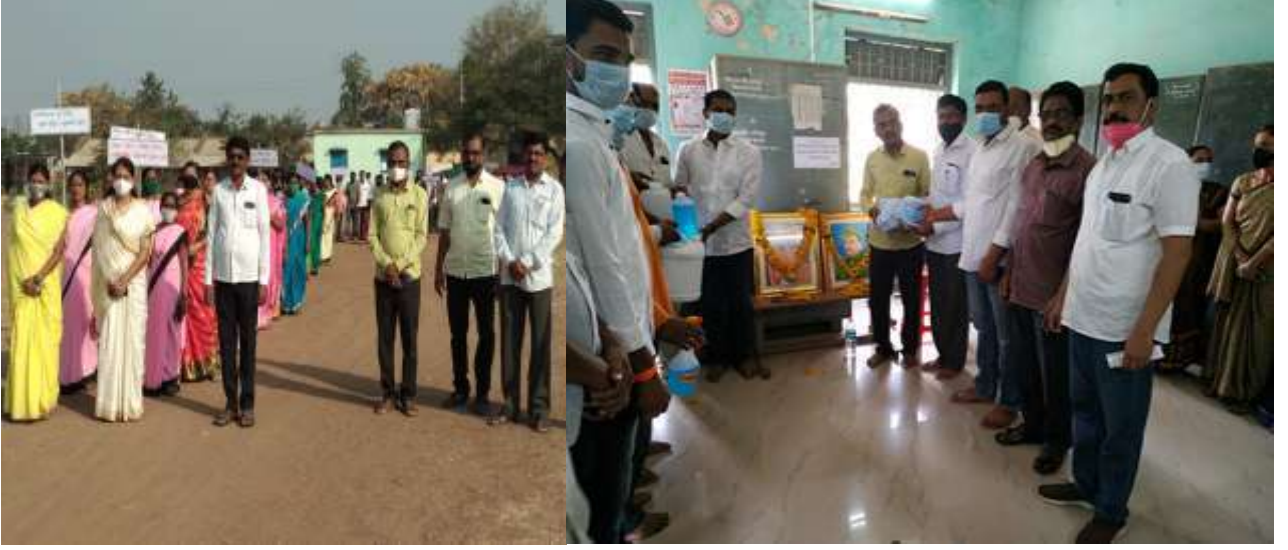
कोरोना काळात जनजागृतीसाठी प्रभात फेरी तसेच मास्क व सॅनिटायझरचे वाटप करताना

शालेय उपक्रम :- विद्यार्थ्यांनी विविध टाकाऊतून टिकाऊ वस्तू बनविणे, चित्रे काढणे, रंगभरण करणे, रांगोळी असे अनेक उपक्रमात ऑनलाईन सहभाग घेतला. पर्यावरण संरक्षण व पर्यावरण जागृती निर्माण करण्यासाठी विविध उपक्रम हाती घेतले आहेत. कोरोना कालावधीत ऑनलाईन व ऑफलाईन उपक्रम राबविले आहेत तसेच विद्यार्थ्यांकरिता बैठे खेळ उदा. बुद्धिवळासारखे खेळही खेळण्यासाठी प्रोत्साहन दिले. कोरोना जनजागृती करण्यासाठी गृहभेटी, प्रभात फेरी तसेच मास्क व सॅनिटायझर याचे वाटप केले आहे.