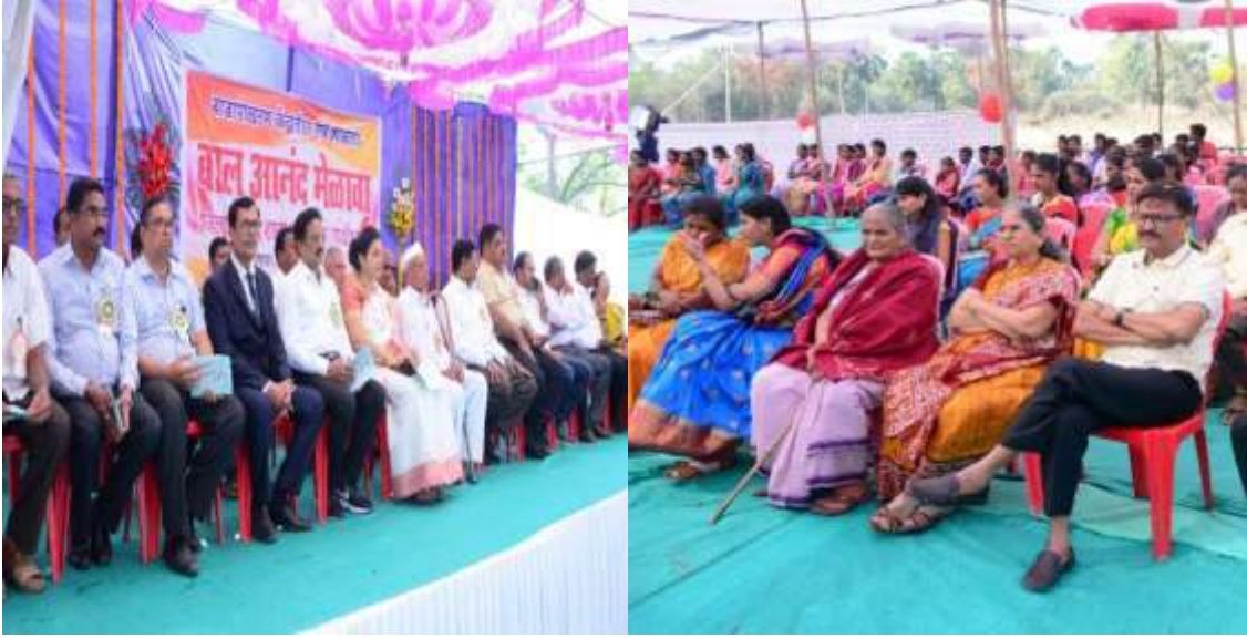
बाल आनंद मेळावा कार्यक्रम

शाळेची एकूणच प्रगती फिनिक्स पक्ष्याप्रमाणे होत असताना, विद्यार्थ्यांना शैक्षणिक साहित्याची मोठ्या प्रमाणावर गरज भासायची. शैक्षणिक साहित्याची तरतूद विविध एन.जी.ओ. तसेच परिसरातील दानशुर व्यक्तींकडून करण्यात यायची. विद्यार्थ्यांची गुणवत्ता वाढावी यासाठी गणित, इंग्रजी, विज्ञान अशा विषयांसाठी जादा तासिकेची व्यवस्था करण्यात आली. अध्यापनात डिजिटल साधनांचा वापर वाढल्यामुळे विद्यार्थी अध्ययनात रस घेऊ लागले. विद्यार्थ्यांचे इंग्रजी वाचन सुधारावे यासाठी 'सेटेन्स-टू-वर्ड' हा एक उपक्रम आम्ही राबविला. विद्यार्थ्यांचा उदंड प्रतिसाद मिळाला, या उपक्रमाची सर्वत्र फार चर्चा झाली. आदिवासी समाजातील विद्यार्थी सुद्धा चांगल्या प्रकारे इंग्रजी वाचन करू शकतात हे दाखवून देण्यात वेगळाच आनंद होता.