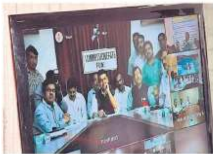
व्हिडिओ कॉन्फरन्समध्ये विद्यार्थ्यांशी संवाद साधताना मुख्यमंत्री फडणवीस तसेच शिक्षण विभागातील अधिकारी.